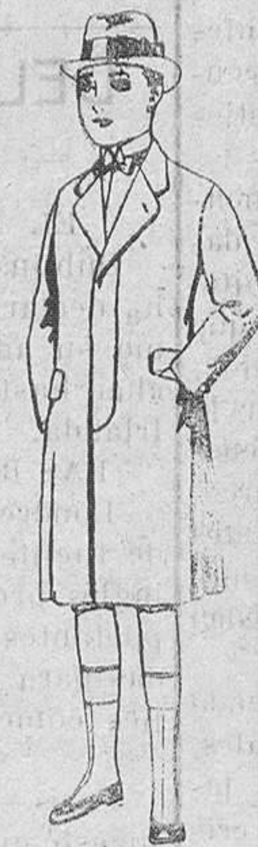
Gabanes de patén para niños de 10 a 12 años, de ptas. 35 a 82