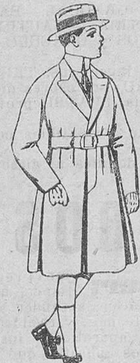
Gabanes de patén para niños de 4 a 9 años, de ptas. 30 a 58