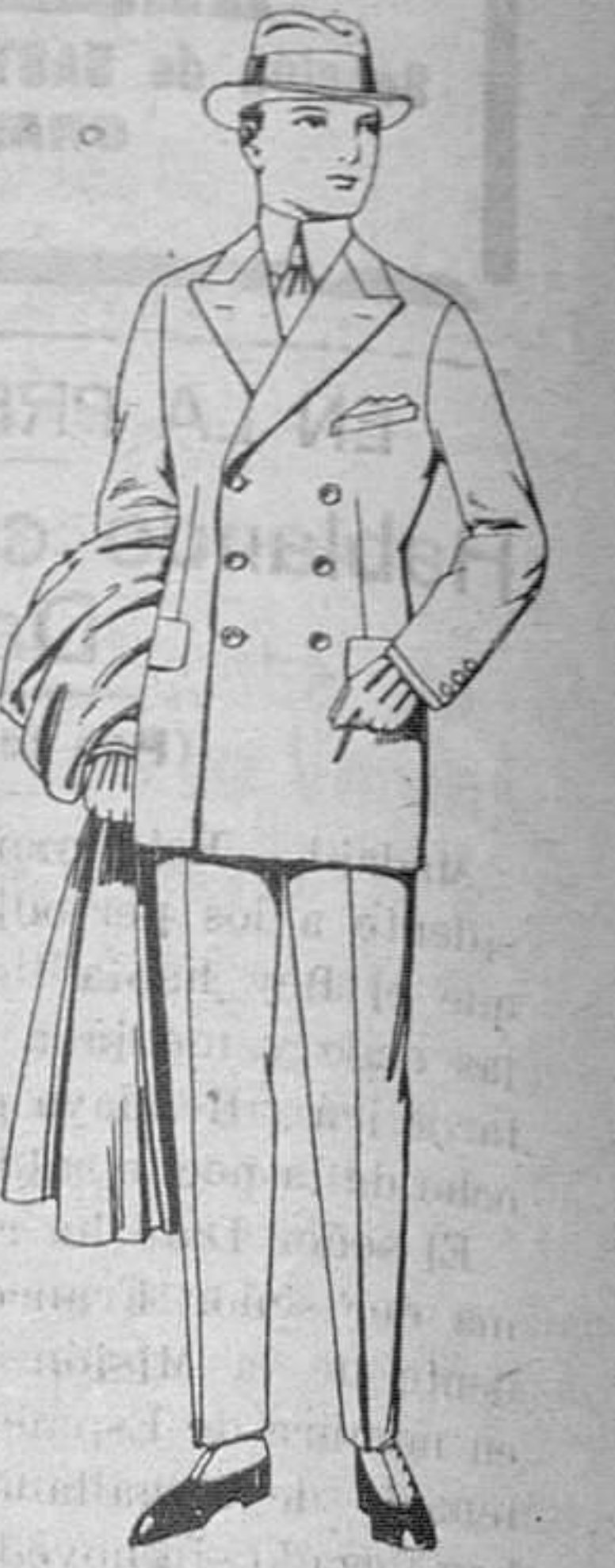
Trajes de chevrot, melton, vicuña o jerga, de ptas. 75 a 180