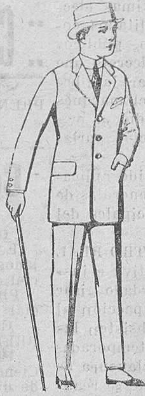
Trajes de patén, vicuña o jerga para niños de 10 a 12 años, de ptas. 37 a 83 Los mismos para jovencitos de 13 a 16 años, de ptas. 40 a 85