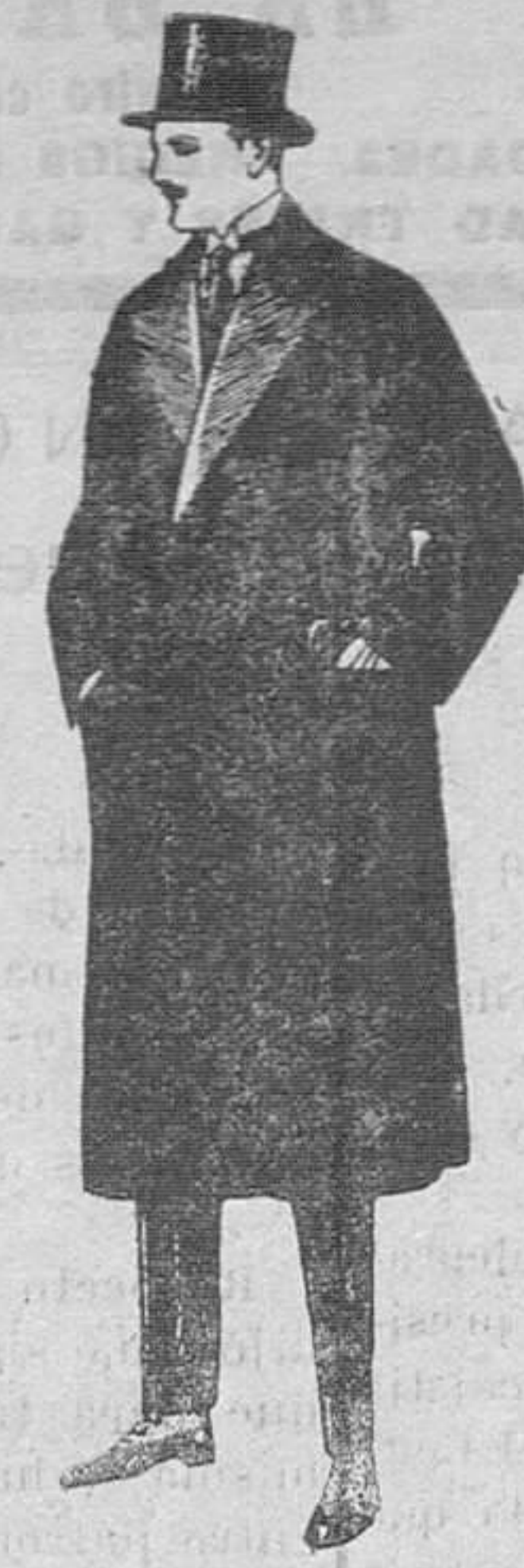
Gabanes de garza o vicuña con visos de seda, de ptas. 175 a 220