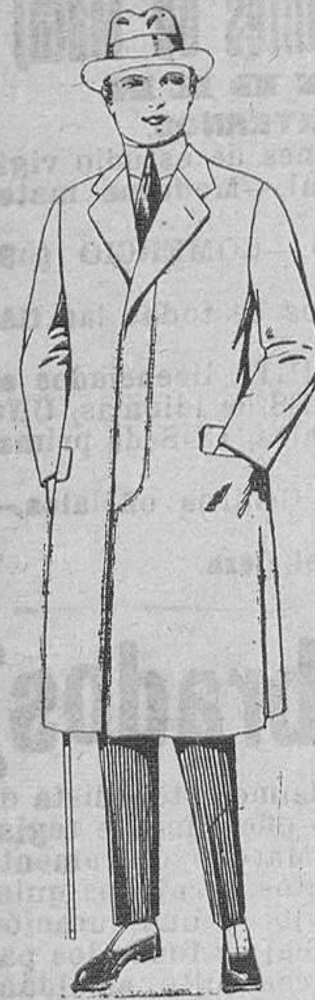
Gabanes de chevrot, gimuza patén, etc., de ptas. 55 a 70