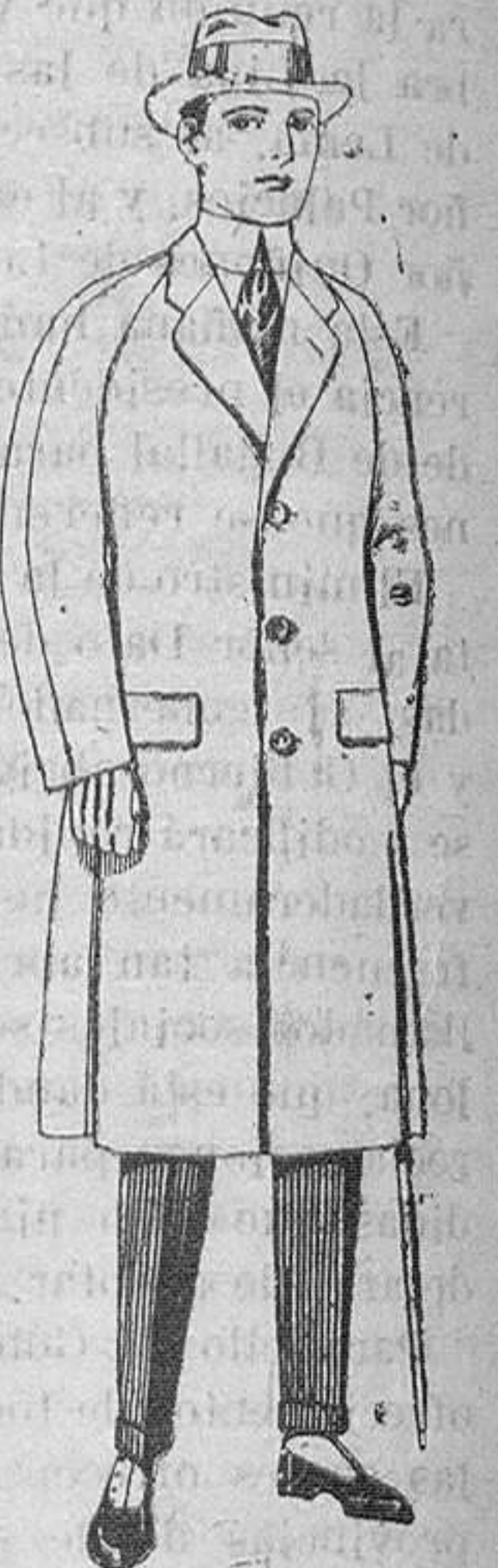
Gabanes de patén, melton o chevrot, con forro de seda, satén o escocés, de ptas. 68 a 125

Ropas confeccionadas para caballero, señora, niño y niña