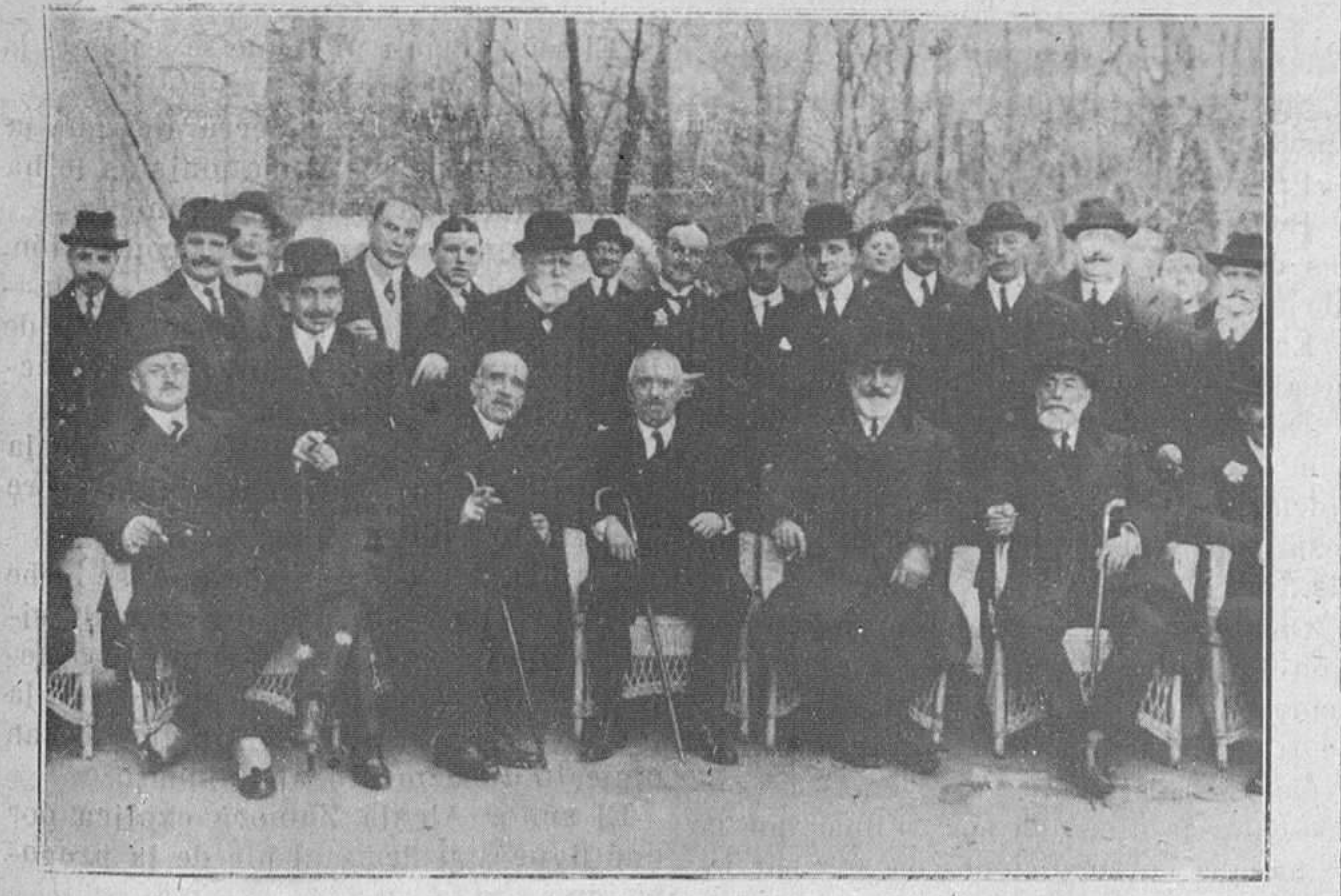
EL HOMENAJE A RUANO.—Algunos de los diputados y senadores que asistieron al banquete y la comisión organizadora.