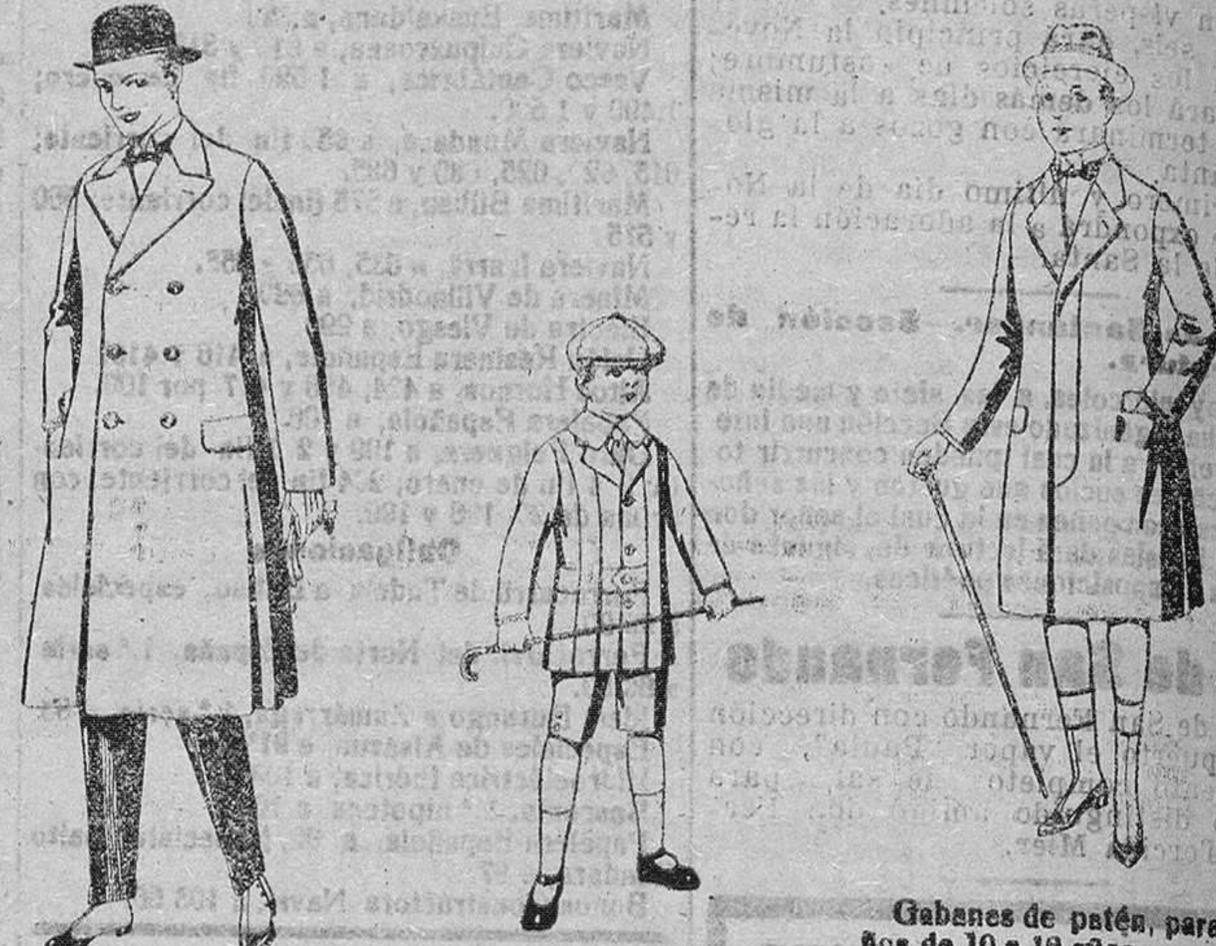
Gabanes de patén, gamuza o Cowey. de pesetas 50 a 110. Trajes de patén, modelo "Norfolk", para niños de 4 a 8 años. de pesetas 14 a 35. Gabanes de patén, para niños de 10 a 12 años. de pesetas 18 a 55. Los mismos, para jovencitos de 18 a 16 años. de pesetas 21 a 58.