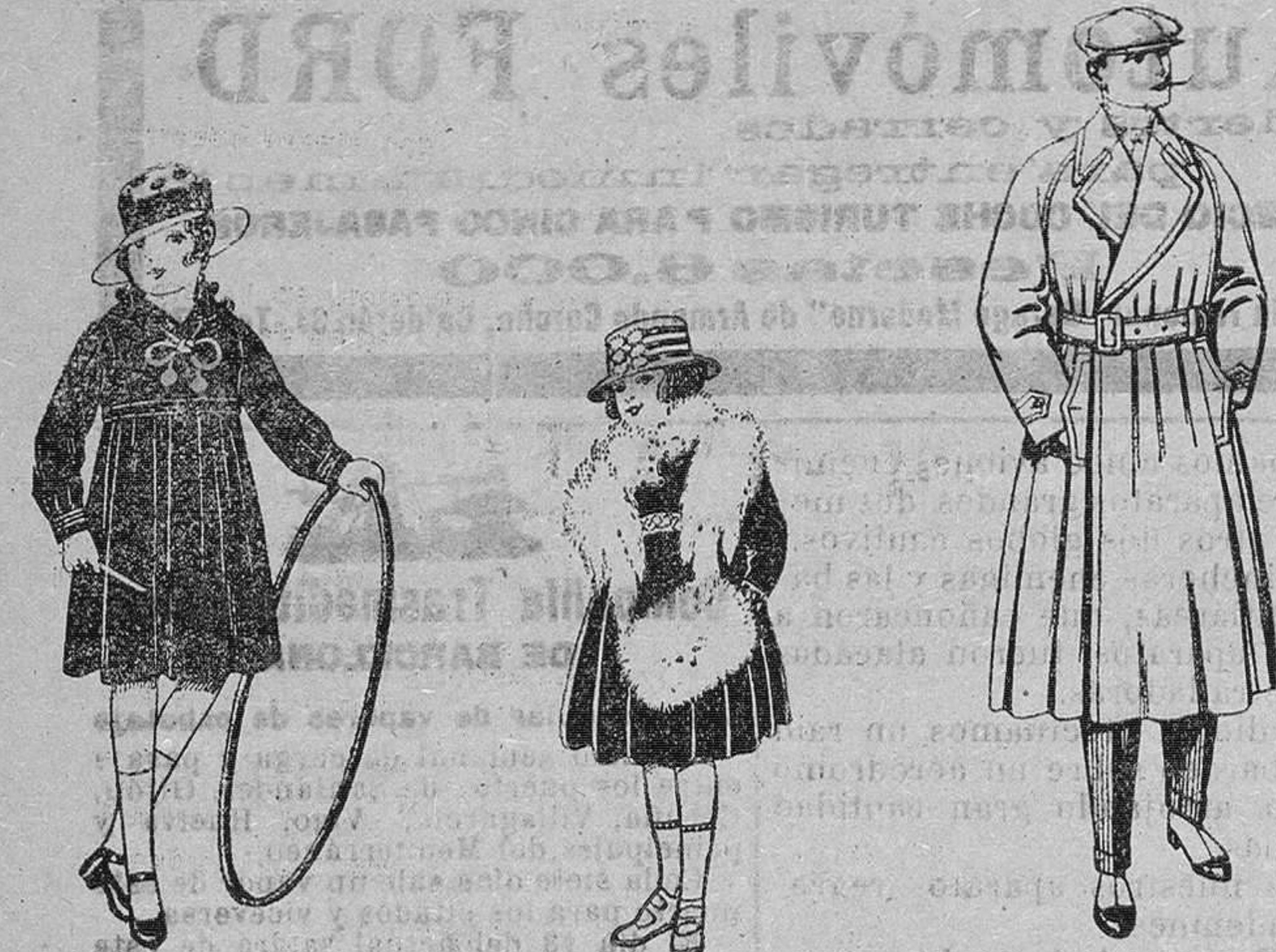
Vestidos marineros, de sarga o estambre azul, adornos seda blancos. de pesetas 25 a 30. Juegos imitación Renard, blanco. a pesetas 12. Gabanes impermeables, zados, con cinturón, color beige. de pesetas 43 a 115.

Camisería, Géneros de Punto, Corbatería, Guantería, Sombrerería, Zapatería, Paraguas, Bastones y Artículos de Viaje.