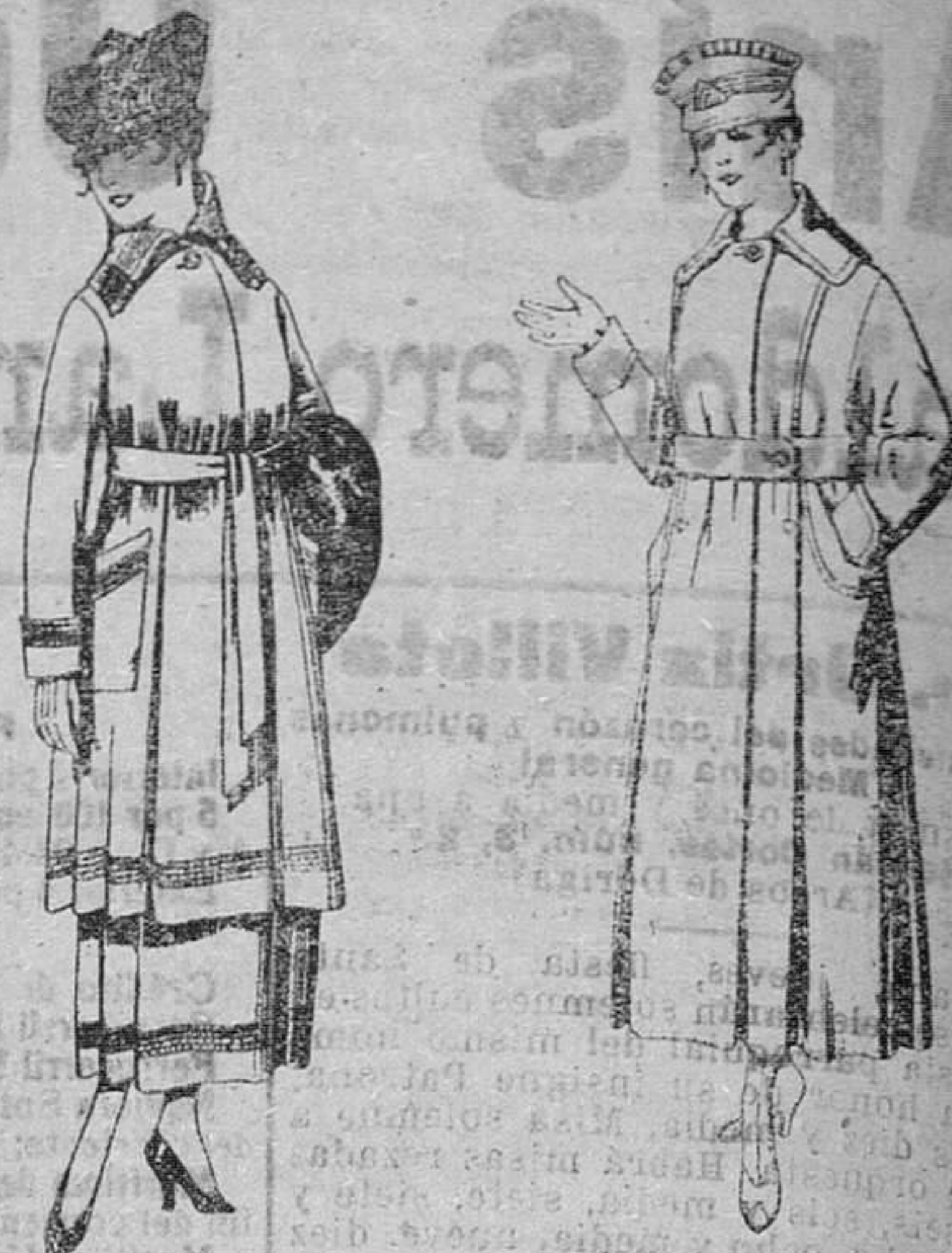
Trejes de sarga inglesa, azul y negro, bordados. de pesetas 85 a 100. Abrigos de cheviot o gamuzo, en azul, negro y color. de pesetas 45 a 55.