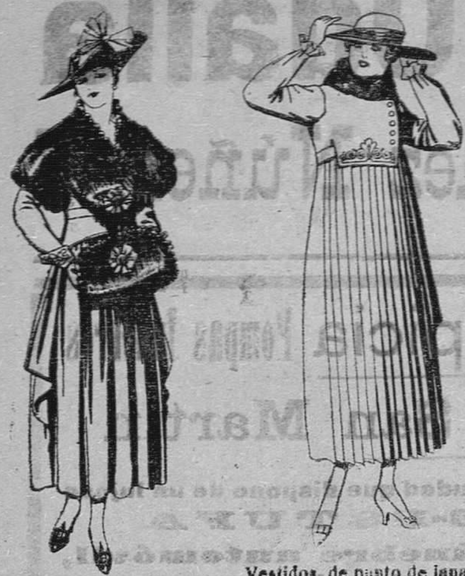
Juegos de pieles, negro, imitación Renard. Gran chita. a pesetas 63. Vestidos de punto de lana, azul y color, bordados, cuello piel. de pesetas 95 a 100.