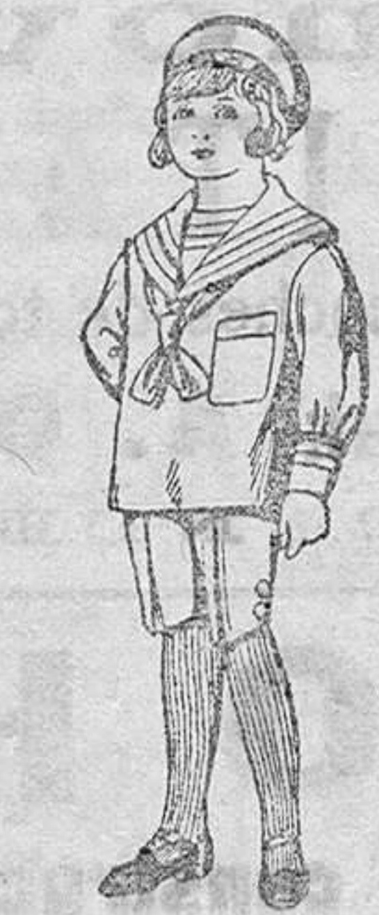
Trajes de jerga azul bordado oro en la manga para niños de 4 a 9 años. De Pts. 20 a 22

SECCIONES: Peletería, Camisería, Géneros de Punto, Corbatería, Guantería, Sombrerería, Zapatería, Paraguas, Bastones y Artículos de Viaje.