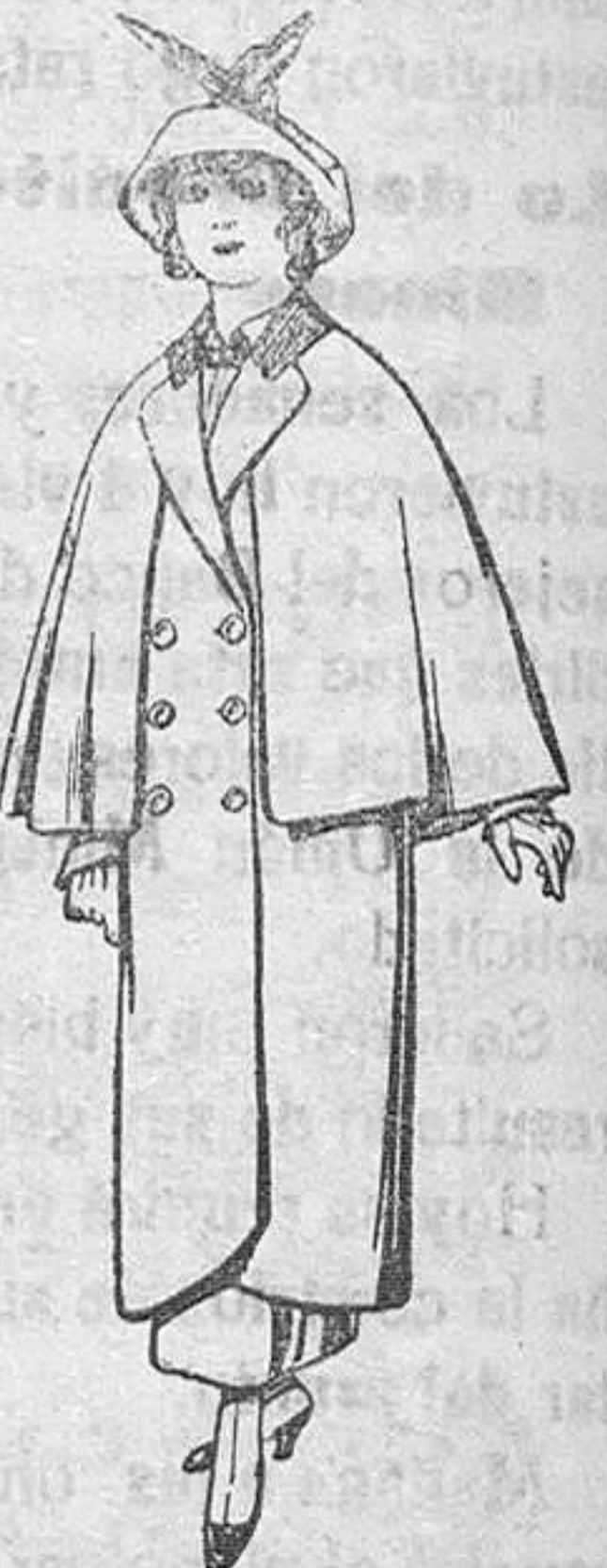
Abrigos de paten colores novedad para jovencitas de 13 a 16 años De Pts. 35 a 40