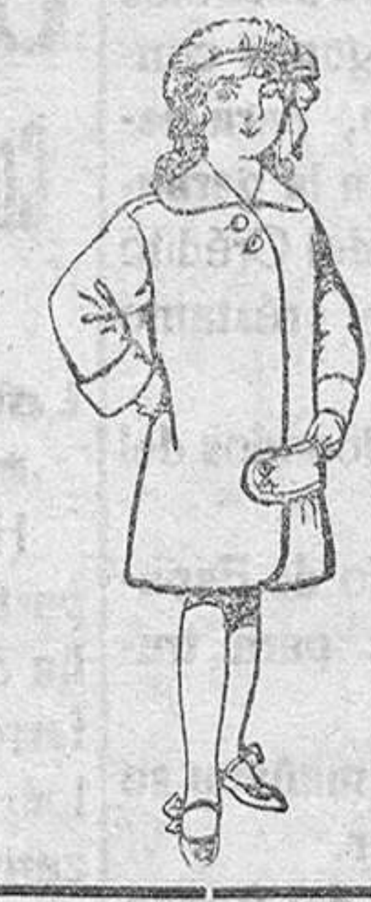
Abrigos de paten para niños de 4 a 9 años De Pts. 20 a 28