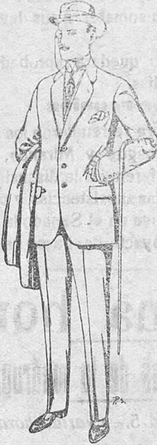
Trajes de paten cheviot, etc. De Pts. 17,50 a 70