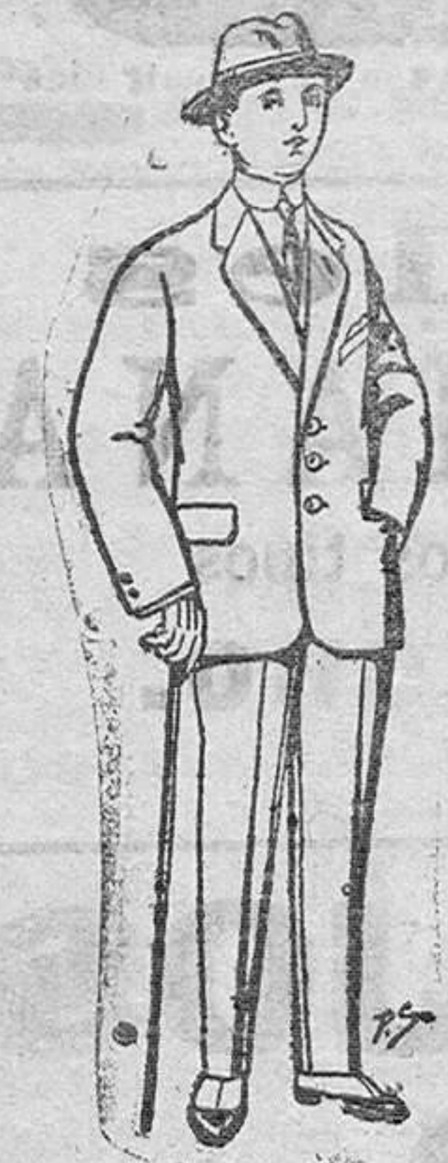
Trajes de paten vicuña ó jerga para niños de 10 a 18 años. De Pts. 13 a 48