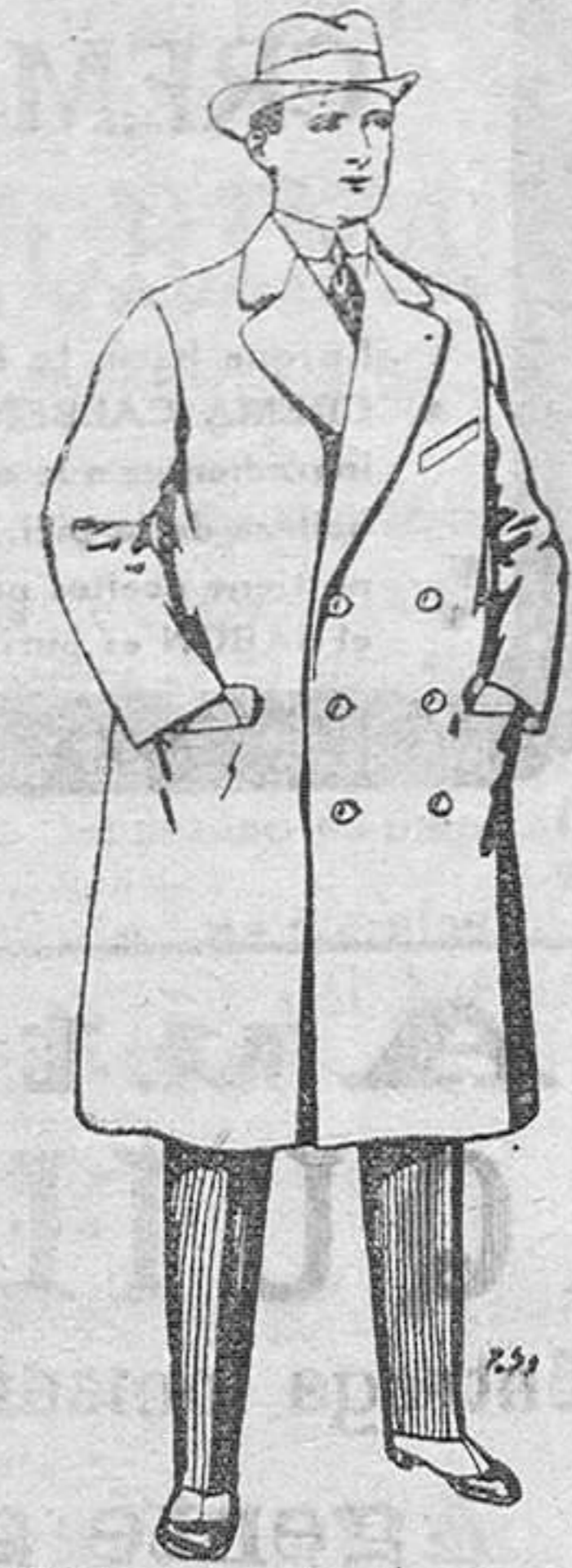
Gabanes de paten y cheviot. De Pts. 55 a 105