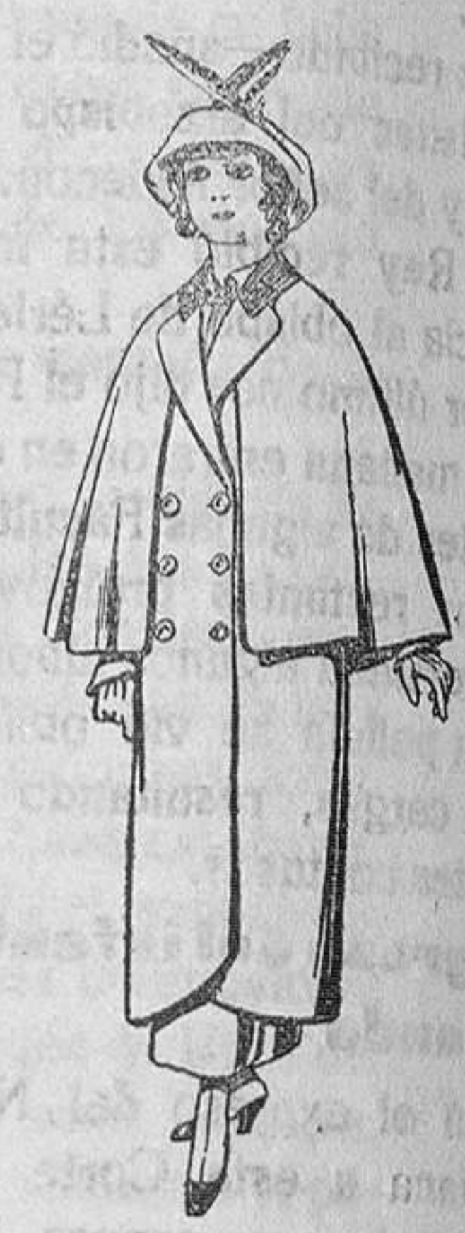
Abrigos de paten colores novedad para jovencitas de 13 a 16 años De Pts. 35 a 40

SECCIONES: Peletería, Camisería, Géneros de Punto, Corbatería, Guantería, Sombrerería, Zapatería, Paraguas, Bastones y Artículos de Viaje.