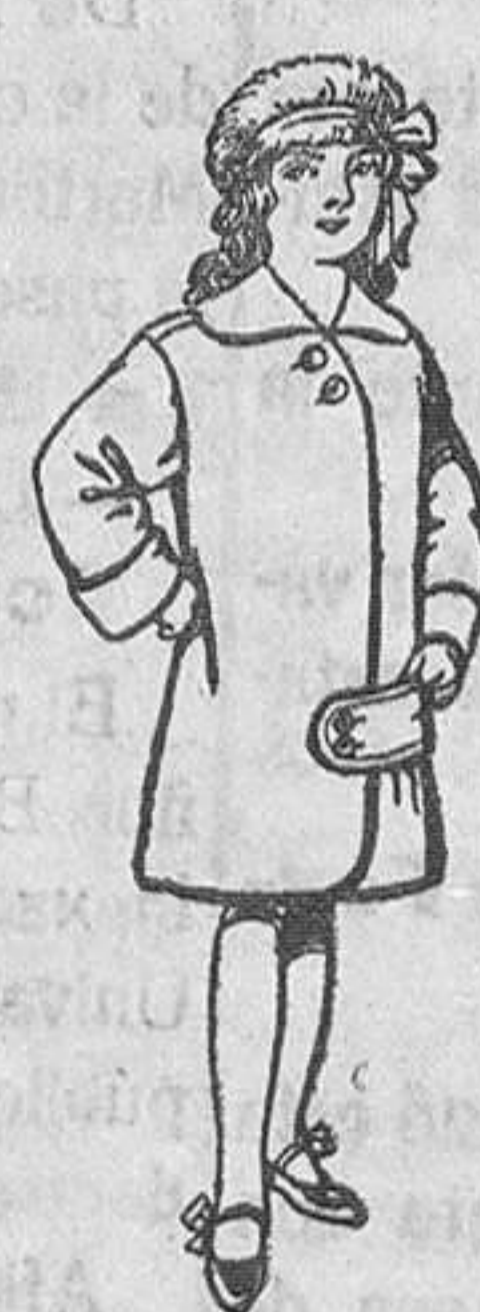
Abrigos de paten para niños de 4 a 9 años De Pts. 20 a 28