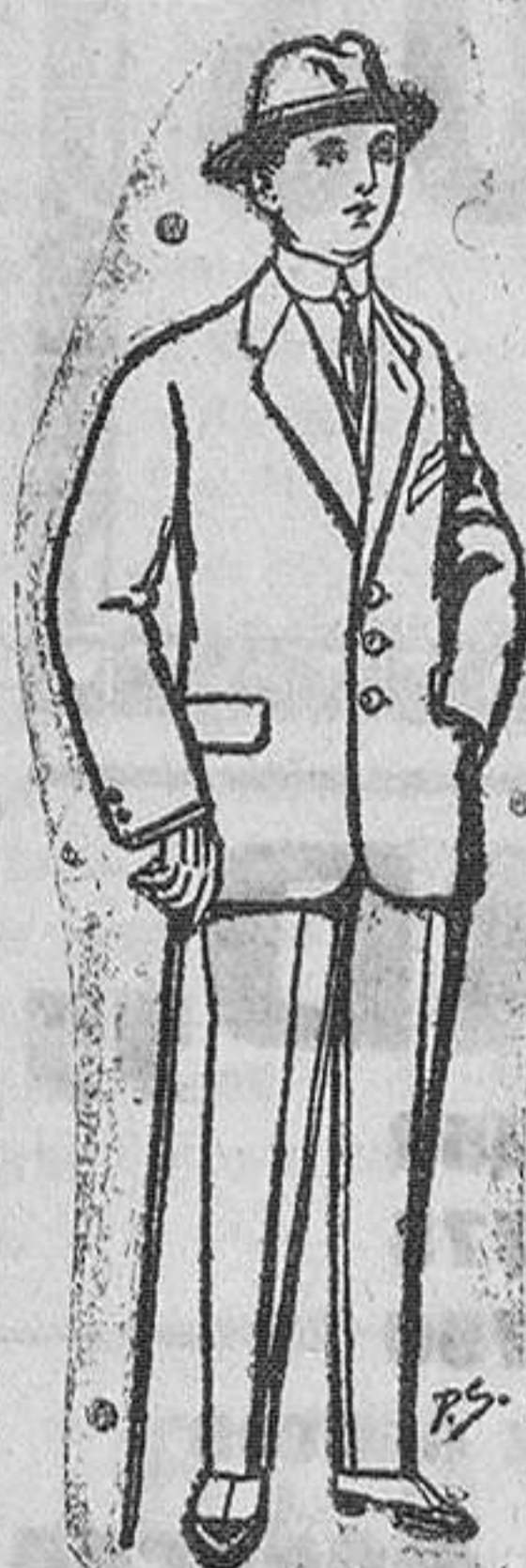
Trajes de paten vicuña ó jerga para niños de 10 a 18 años. De Pts. 13 a 48