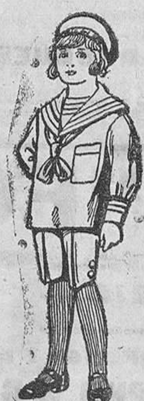
Trajes de jerga azul Bordado ero en la manga para niños de 4 a 9 años. De Pts. 20 a 22