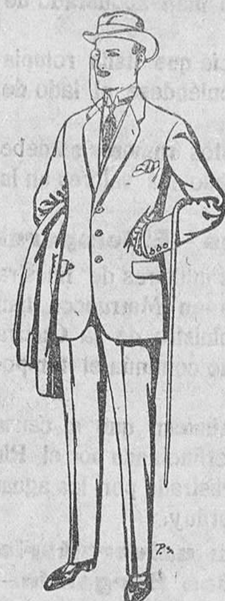
Trajes de paten cheviot, etc. De Pts. 17,50 a 70