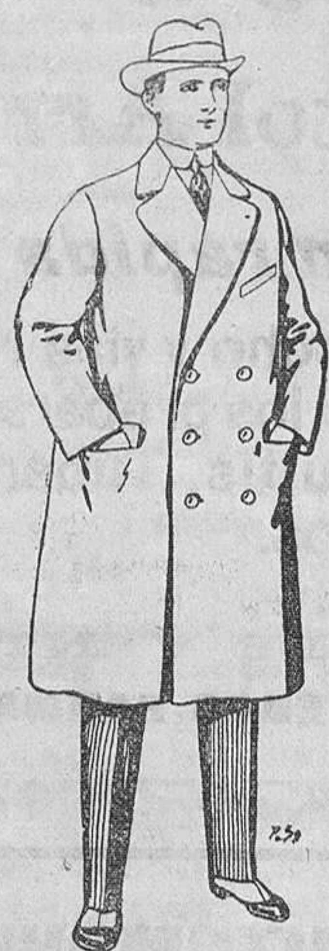
Gabanes de paten y cheviot. De Pts. 55 a 105