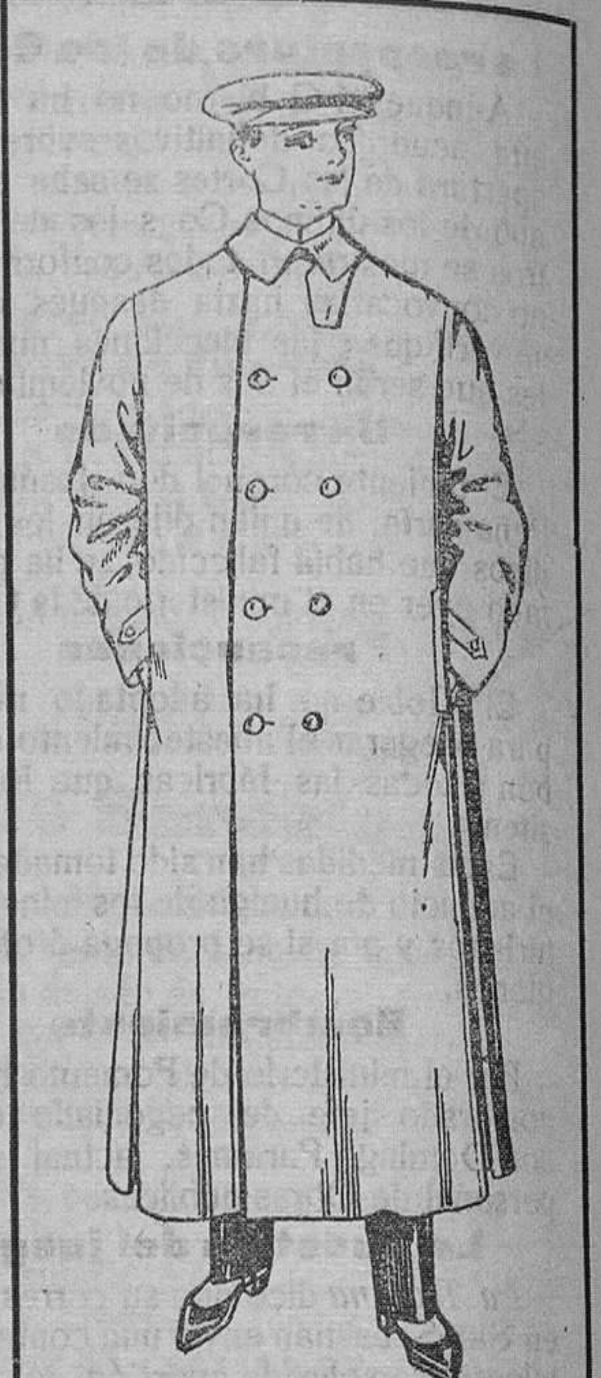
Guarda-polvos de dril DE PTAS. 8 A 25

Secciones de Camisería, Género de punto, Corbatería, Guantería, Sombrerería, Zapatería, Paraguas, Bastones, Sombrillas, Artículos para viaje