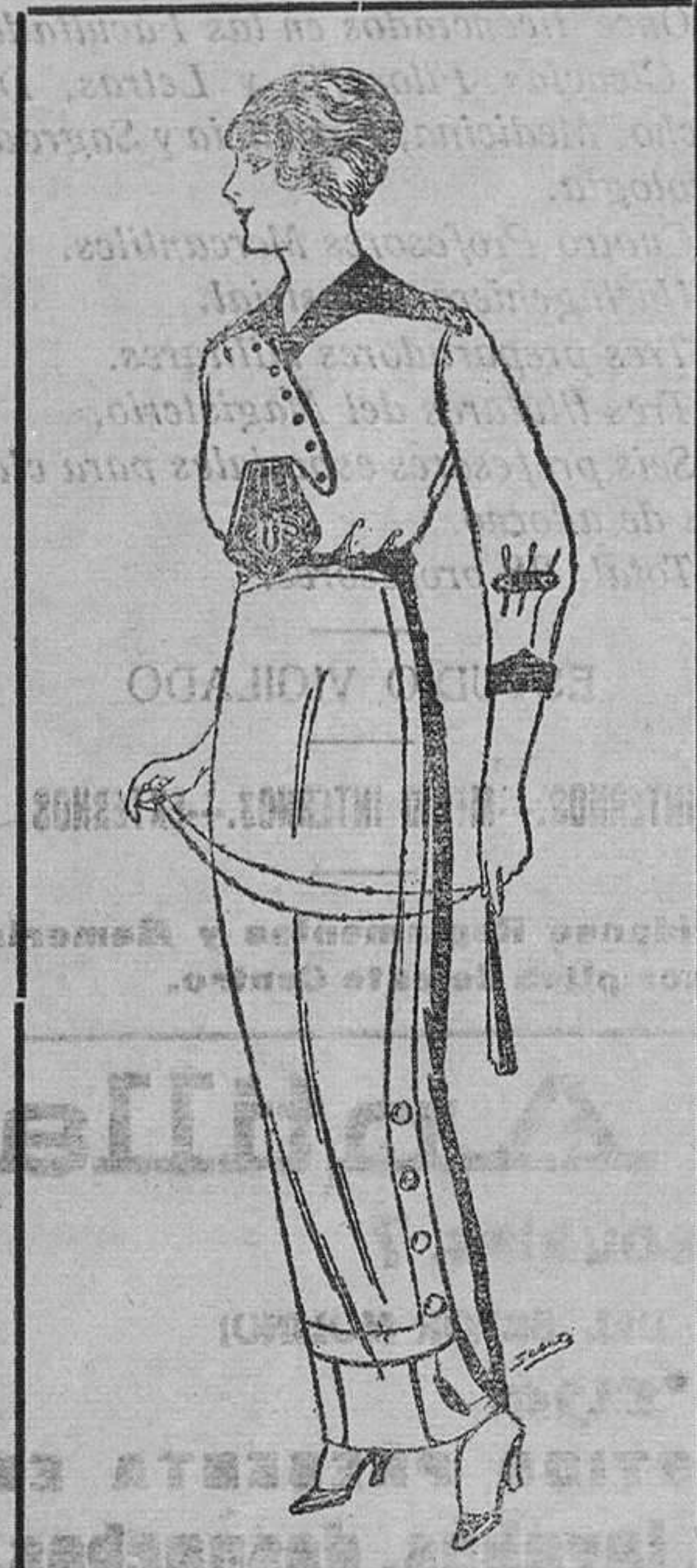
Blusa seda blanca y colores, ADORNOS BORDADOS A PTAS. 25

SUCURSALES: Madrid, Barcelona, Alicante, Almería, Bilbao, Cádiz, Cartagena, Gijón, Granada, Málaga, Palma de Mallorca, Sevilla, Valencia, Valladolid y Zaragoza.