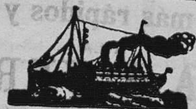
Vapores correos españoles

admitiendo pasajeros de tercera clase (transbordando en Cádiz al Montevideo, de la misma Compañía) para MONTEVIDEO y BUENOS AIRES. Precios desde Santander hasta Montevideo y Buenos Aires, 240 pesetas y cinco de impuestos. Para más informes en Santander, Sres. Hijos de Angel Pérez y Compañía, Muelle, número 38.—Teléfono número 69.