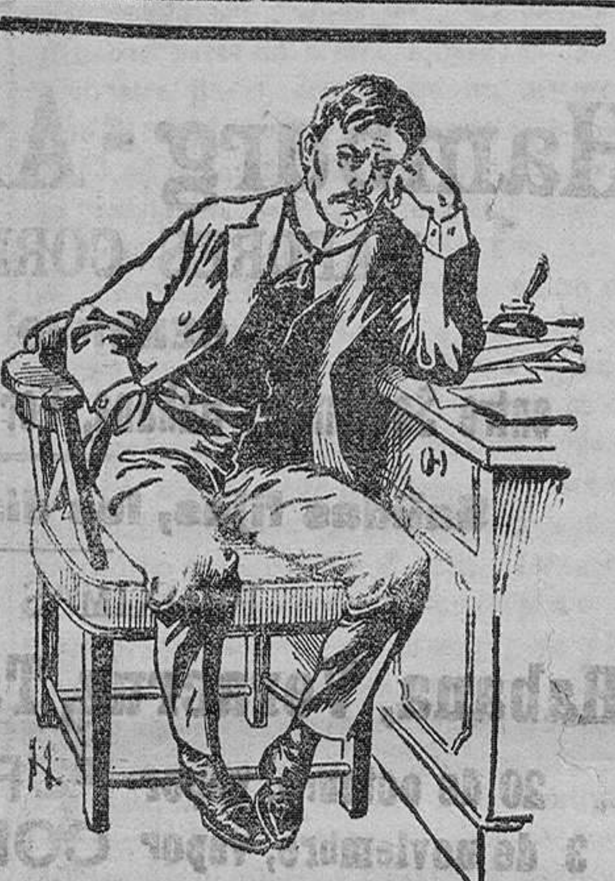
«Cómo podréis prosperar en la vida si no estáis en buena salud?»

Si no tenéis salud perfecta cuantas cualidades poseáis no os servirán para nada, puesto que os hallaréis en la imposibilidad de hacerlas valer.