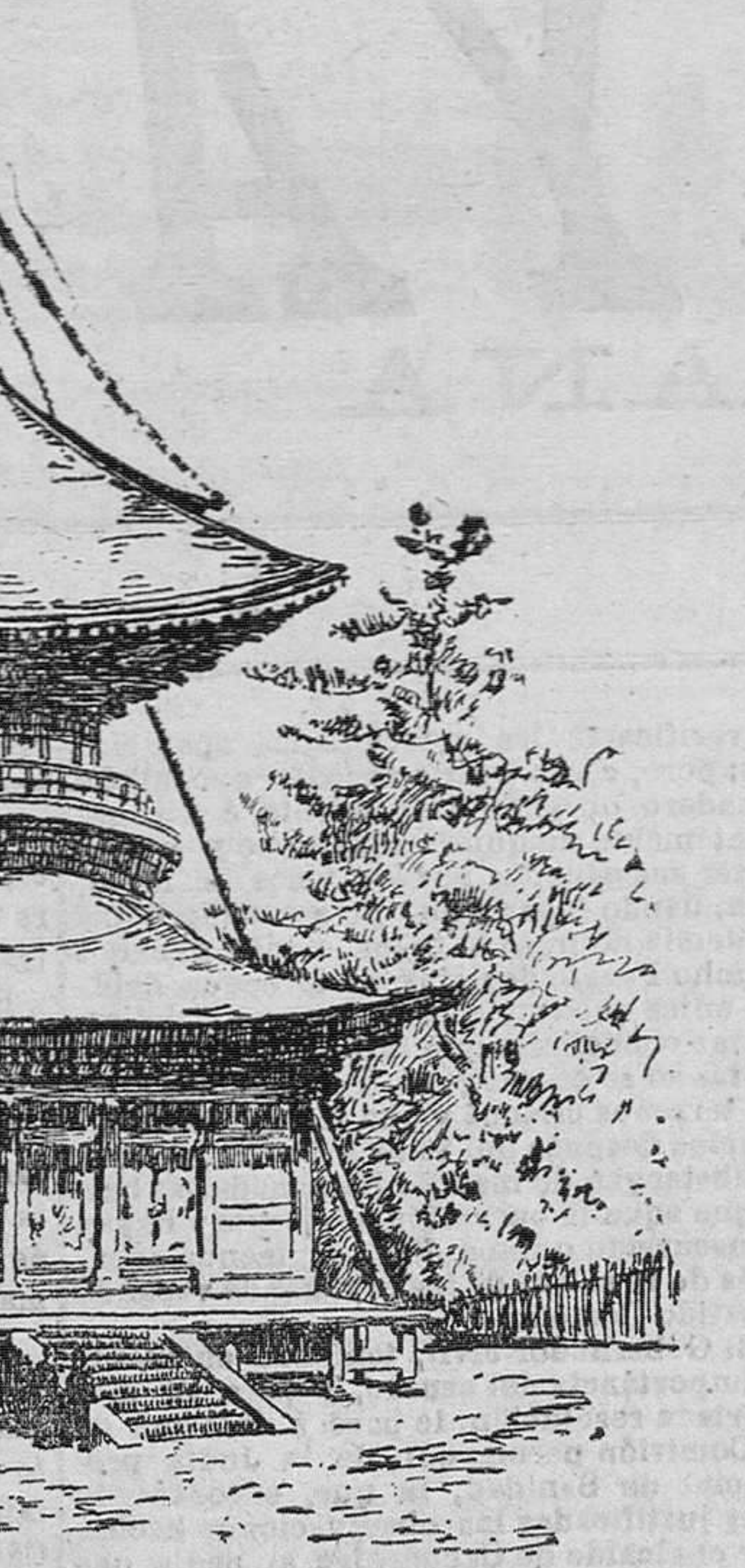
Pagoda china de los alrededores de Karbin

La guardia civil de Cartagena, de Murcia y de Alicante ha prestado un buen servicio auxiliando a los autores de varias cat-