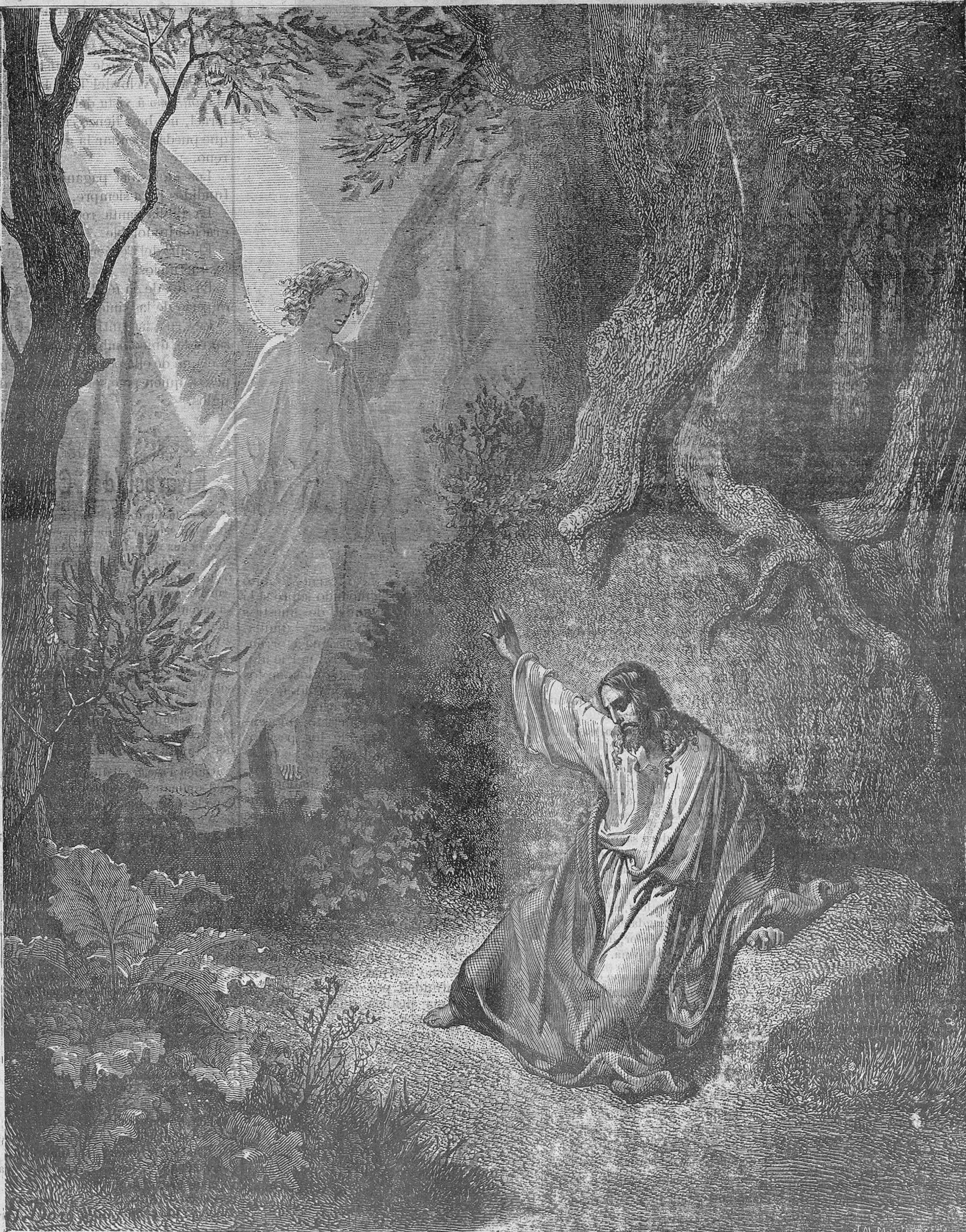
JESÚS ORANDO EN EL HUERTO