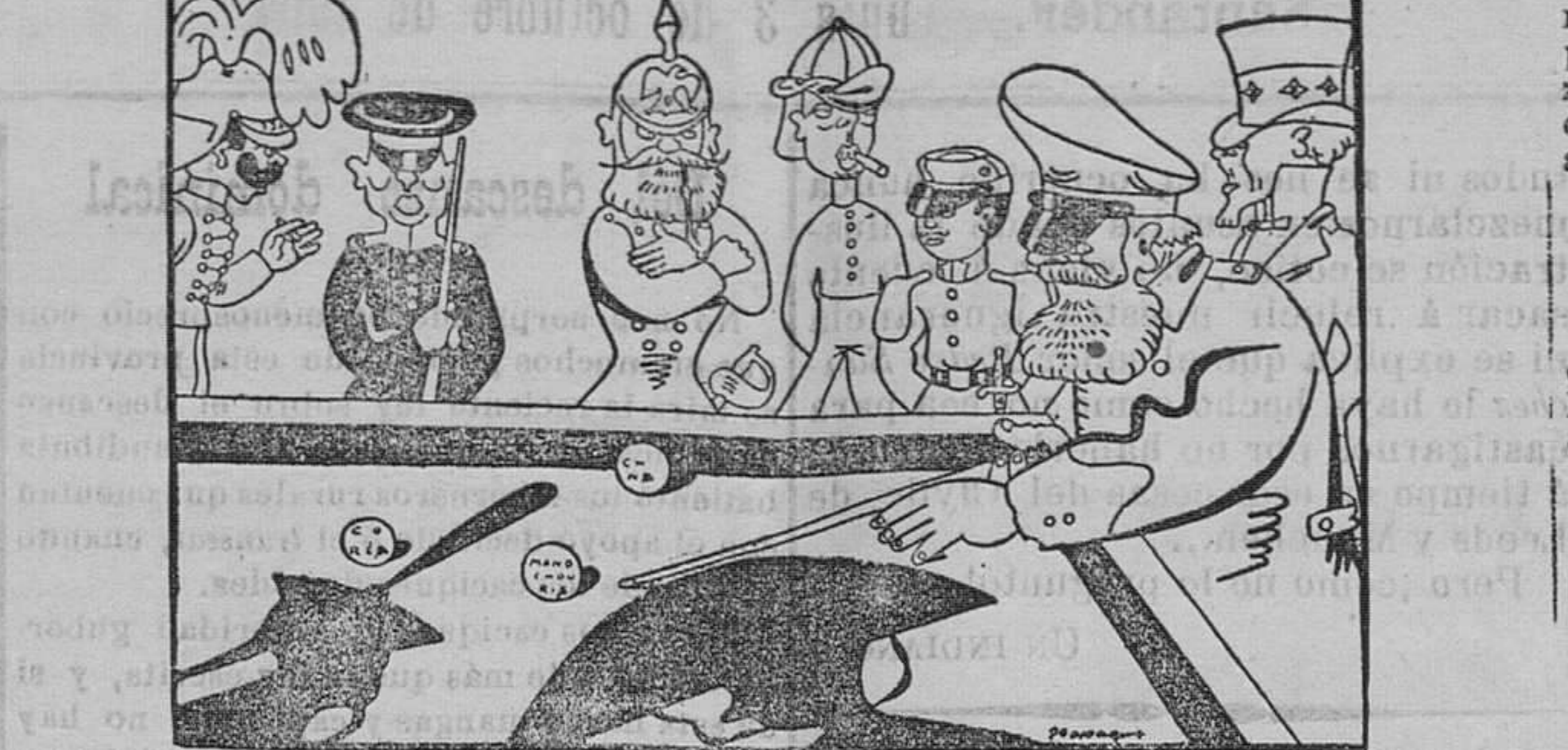
Hoy por hoy, lo difícil del caso es saber cómo ha de hacerse la carambola.