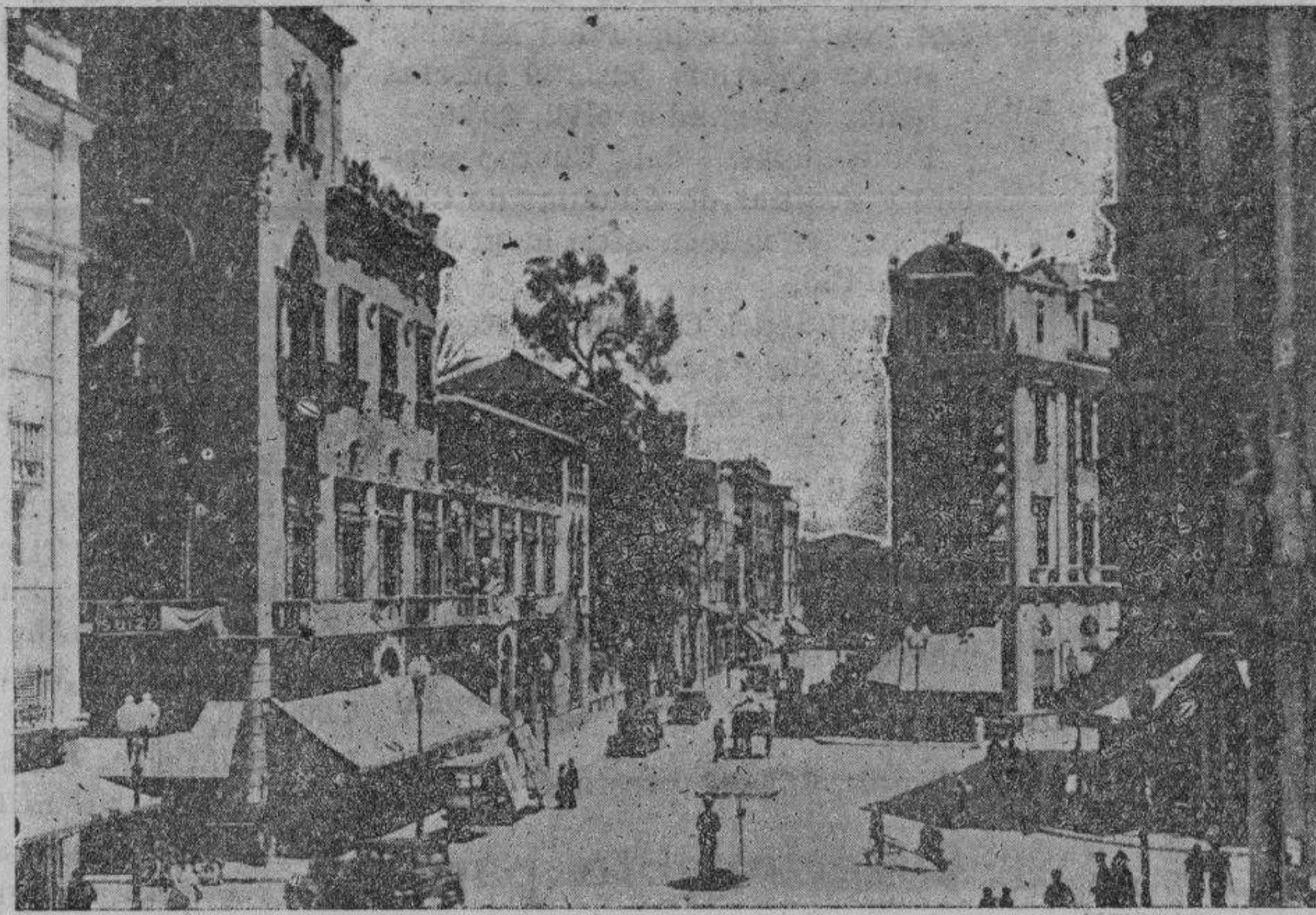
Puerta del Sol y calle de G. sset. Dinamismo, belleza, comercio, sensación de vida próspera y agradable.

El doctor.—Vaya, esto ya tiene mejor aspecto. Parece que ya va recordando el conocimiento. ¿Verdad que ya me reconoce, don Pablo? El enfermo.—¡Ya lo creo! Usted es el señor Obispo.