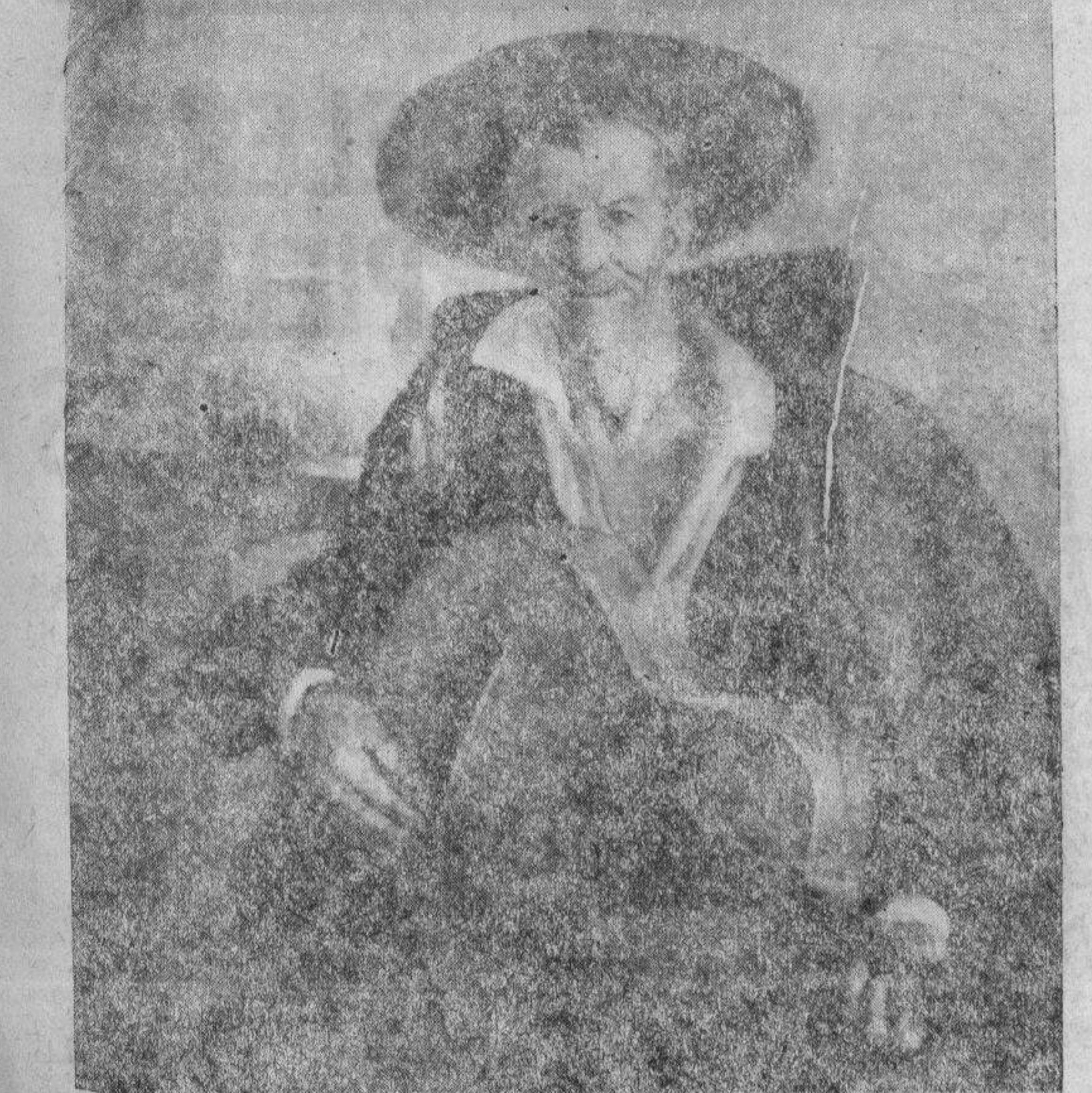
La vida a tragos, por Cristóbal Bou