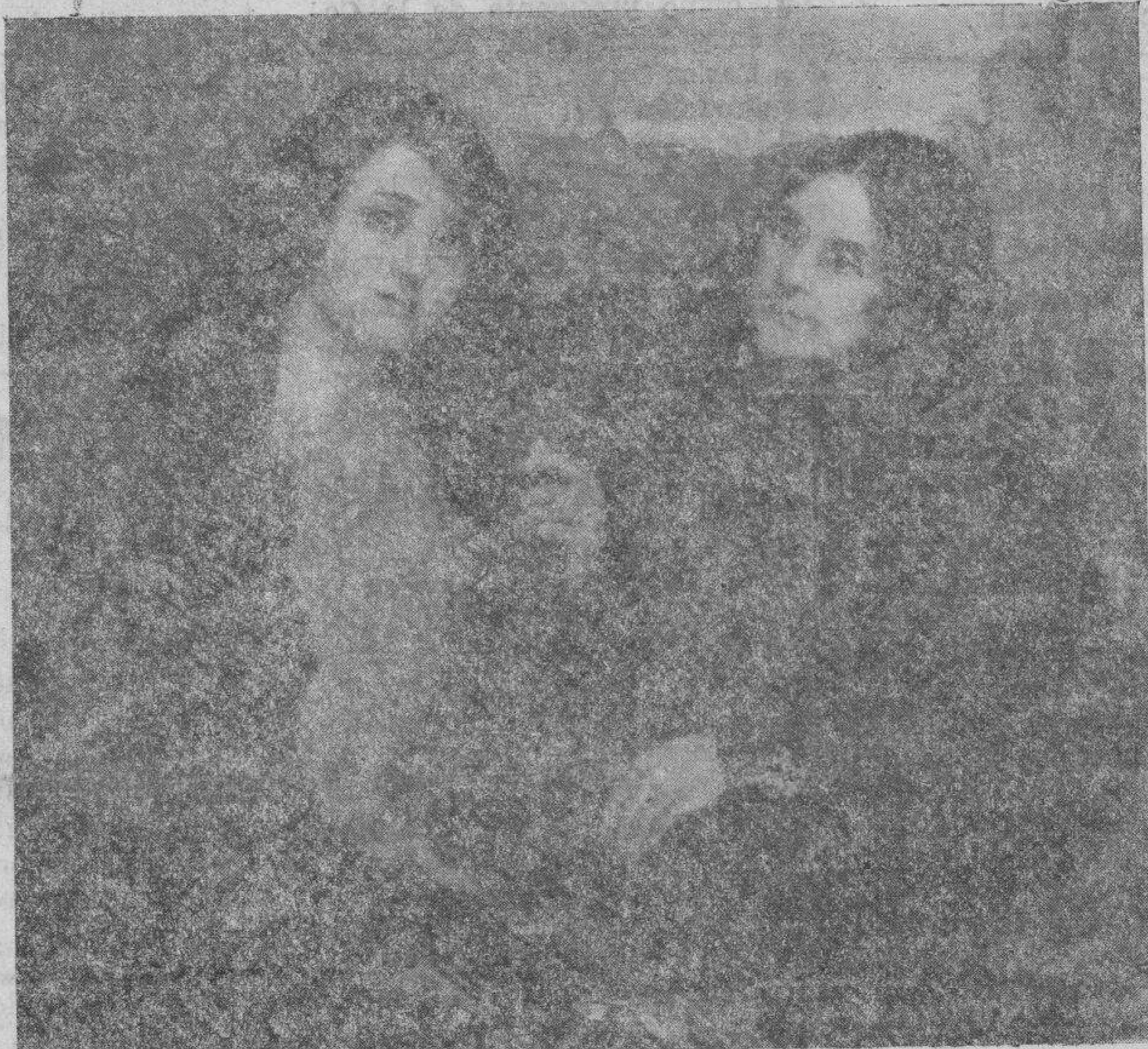
Buenos consejos, por Cristóbal Bou