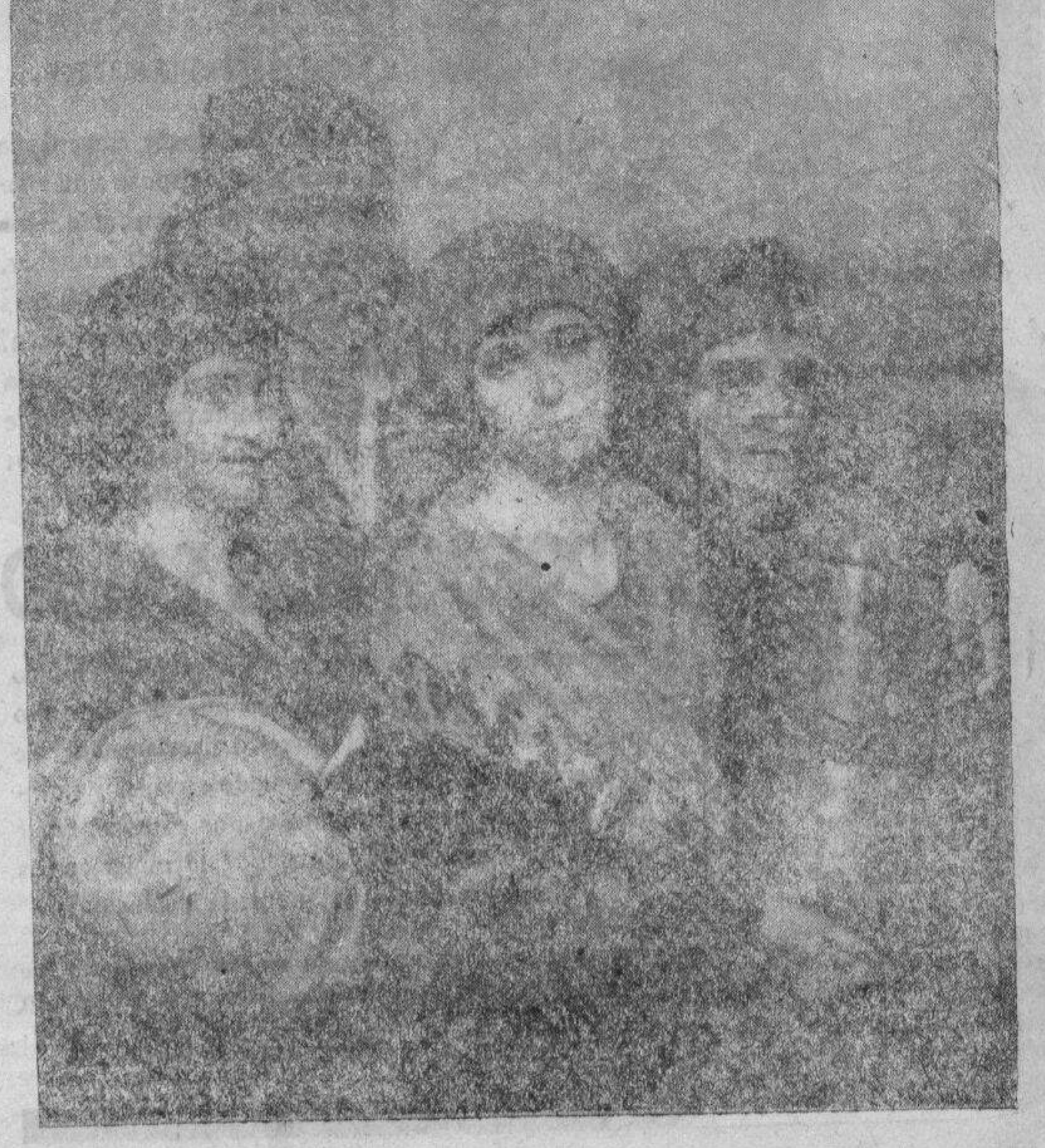
Camino de la aldea, por Cristóbal Bou