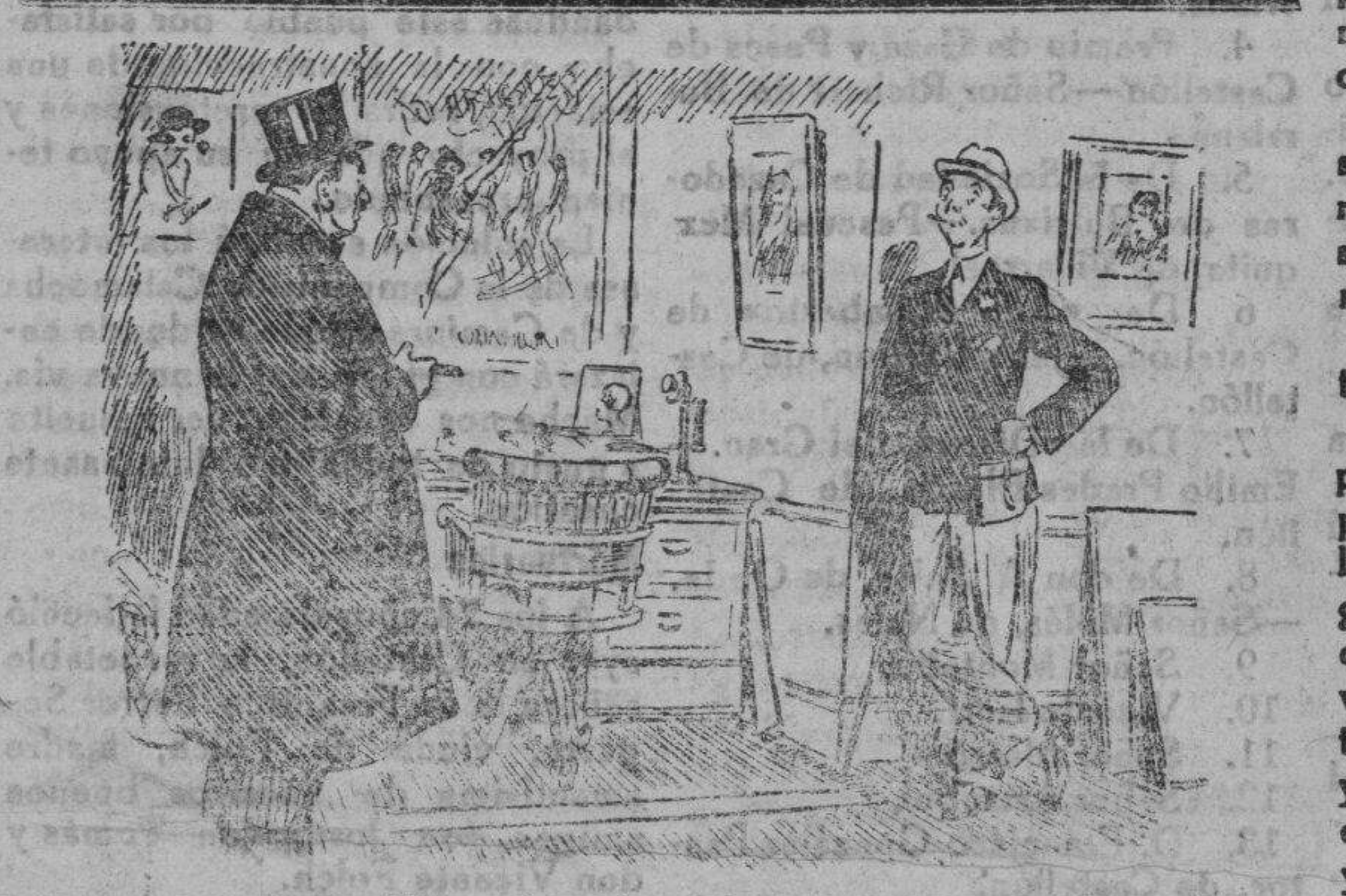
El amigo de cinco años

El Ayuntamiento de esta ciudad saca a concurso el suministro de energía eléctrica para el accionamiento de su instalación de elevación de aguas potables.