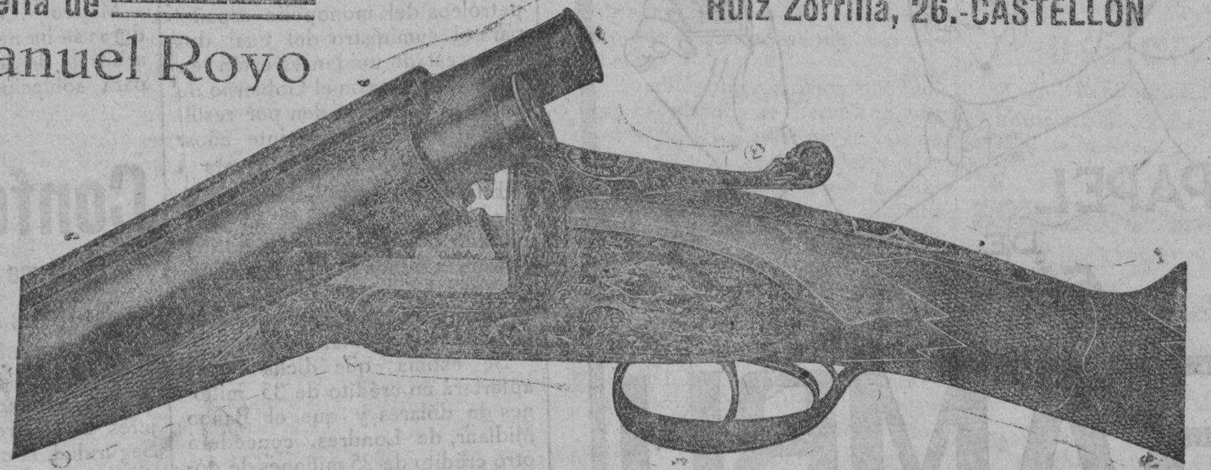
Escopetas de todas clases baratísimas, garantizadas y a prueba. Escopetas especiales, marca «Héroe». Municiones y arreos de caza (completos). Explosivos para canchales y minas. Armas y distintivos especiales para Somatén. Compostura de toda clase de armas.