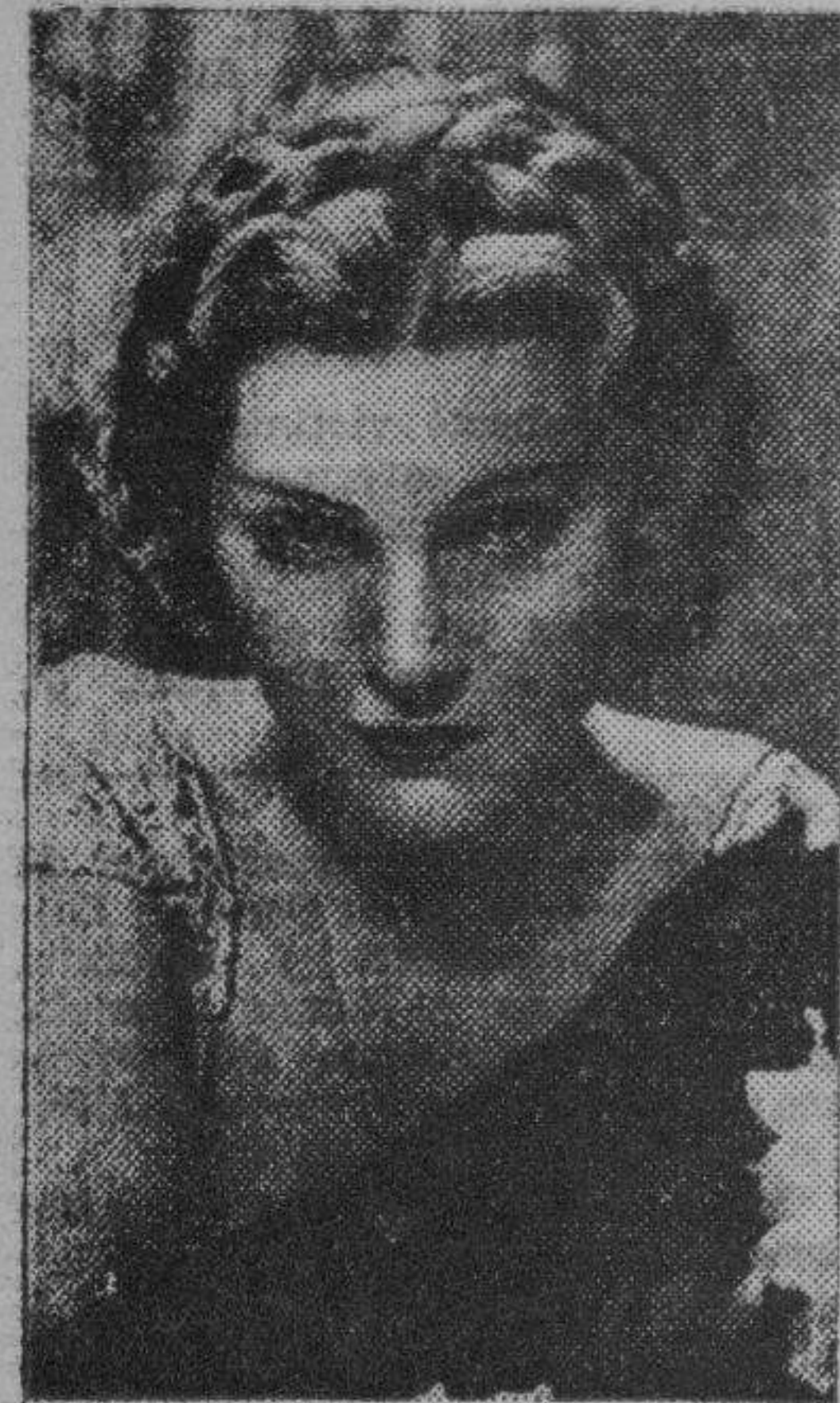
Anna Sten en "We Live Again"