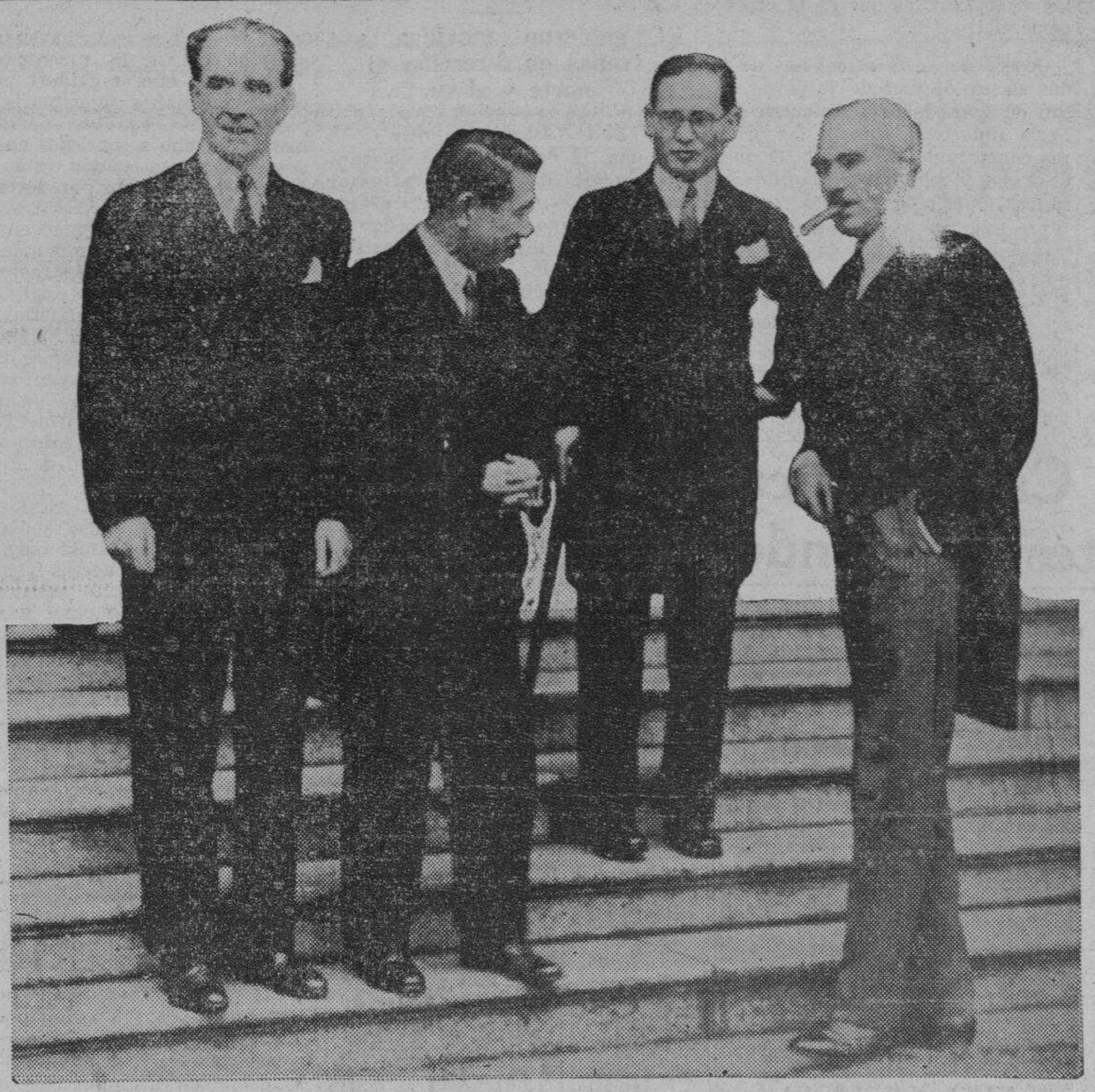
Fotografía tomada después del "luncheon" que el Ministro del Exterior del Japon Koki Hirota dió en honor del Gobernador Frank Murphy en Tokio cuando estuvo de paso allí para Estados Unidos. De izquierda a derecha, están el Gobernador Murphy, el Ministro Hirota, el Vice-Ministro del Exterior Mamoru Shigemitsu y el Embajador Americano James Clark Grew.