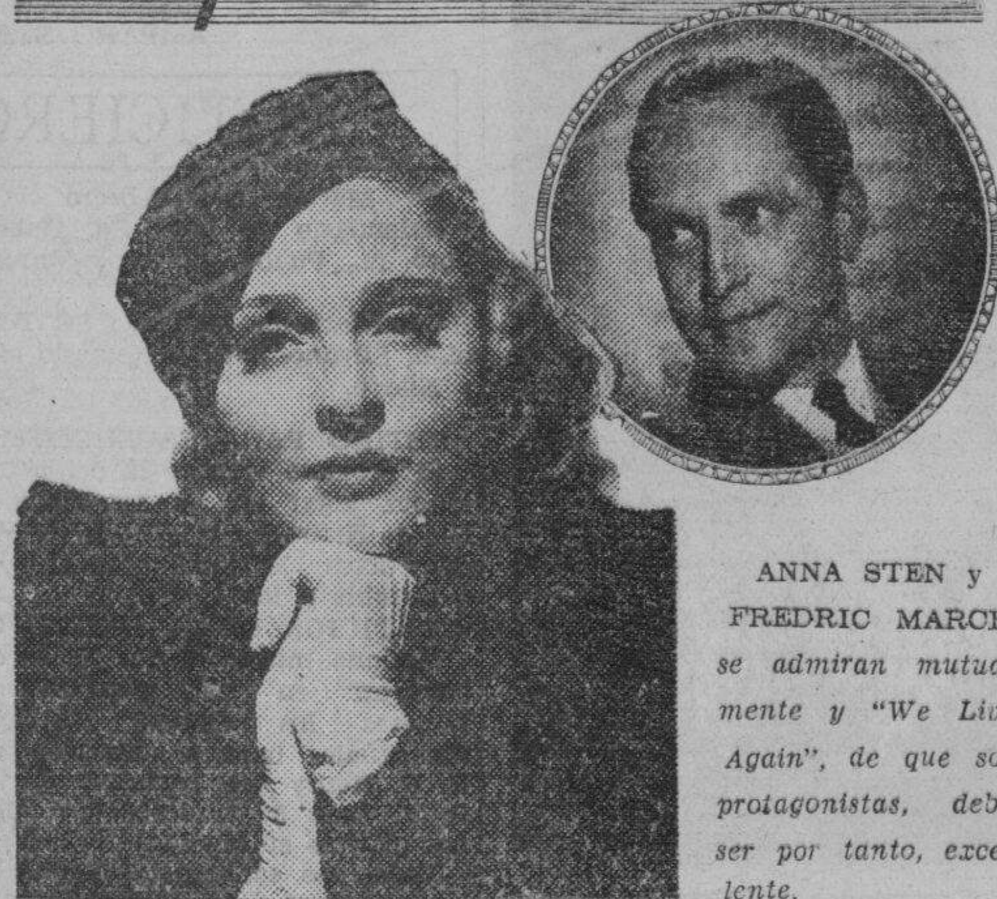
ANNA STEN y FREDERIC MARCH se admiran mutuamente y "We Live Again", de que son protagonistas, debe ser por tanto, excelente.

gura acumulada en su corazón se desborda y le cuenta toda su miserable historia y le suplica que la deje en paz. Dmitri la implora que se case con él pero ella se ríe amargamente ante la proposición.