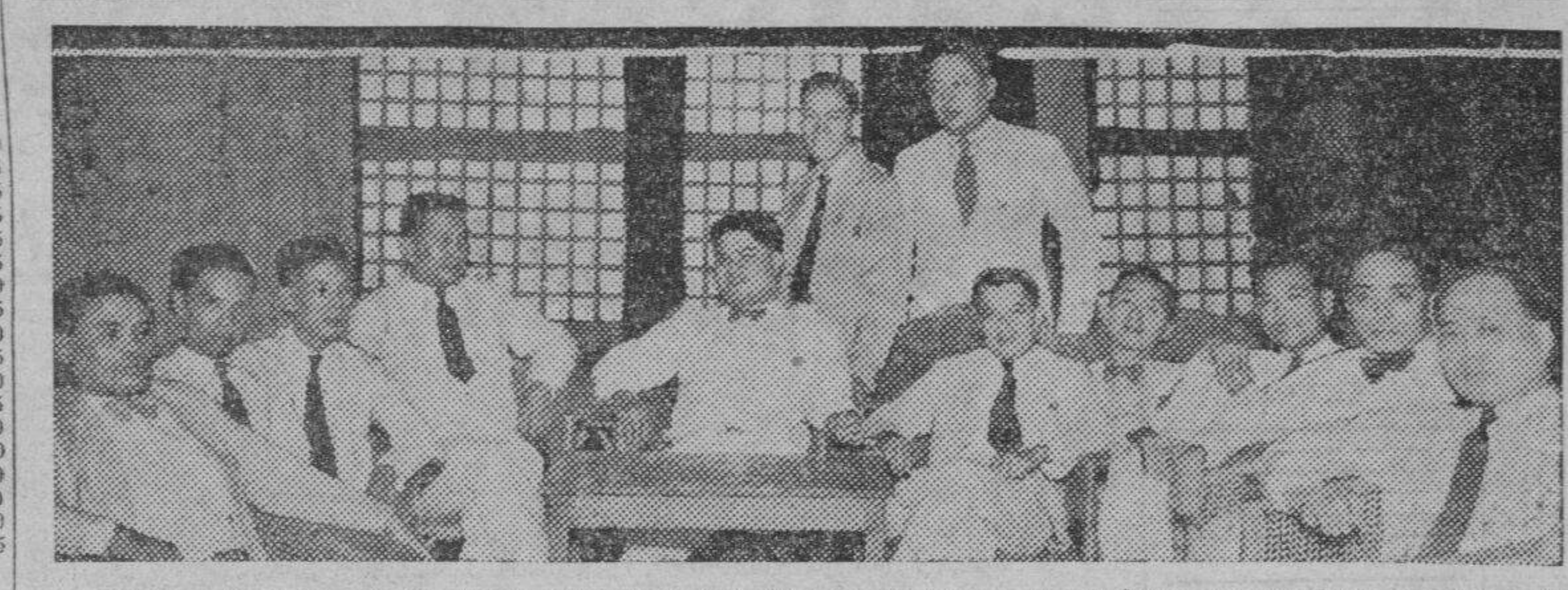
Agentes de venta de la Manila Trading and Supply Company que el lunes se reunieron en un agaspe...