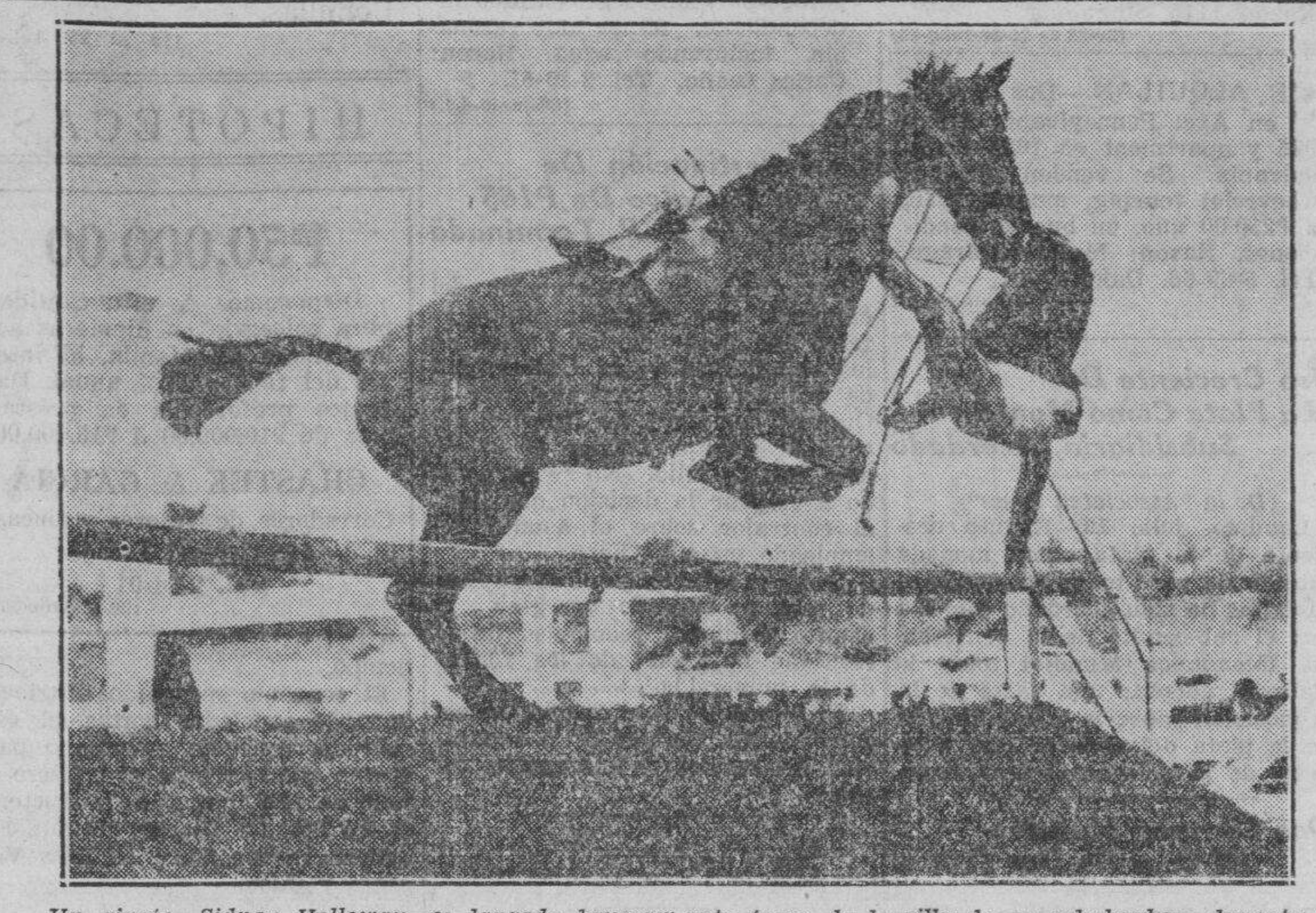
Un ginete—Sidney Holloway—es lanzado bruscamente fuera de la silla de su cabalgadura durante una carrera anual de obstaculos celebrada recientemente en Devon, Pa.