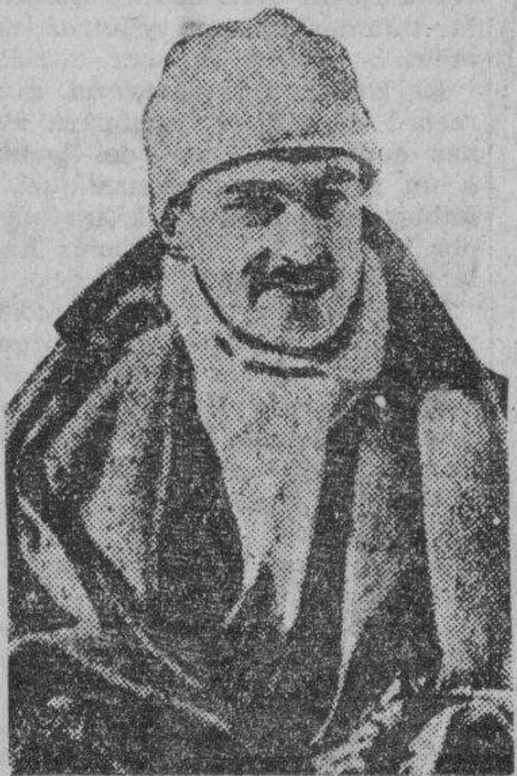
Capitan CHRISTIAN GROSS

El accidente se registró cuando el auto que iban patinando y voló el día del Fuerte Lauderdale, mientras iba a gran velocidad. Gross, soldado y autor, era una figura llamativa del servicio diplomático americano.