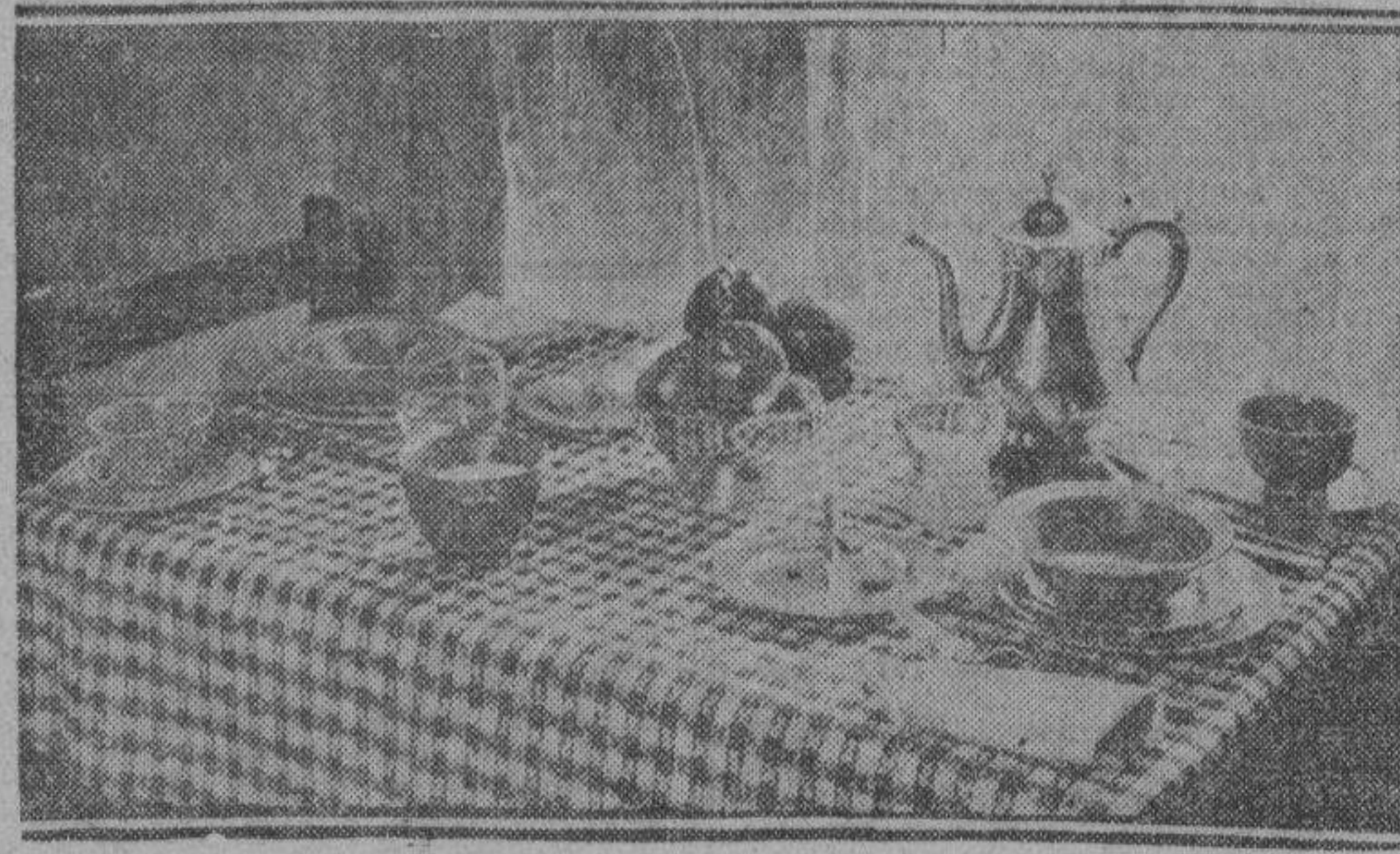
Para una familia reducida, una mesa grande para desayunar no es apropiada; la que presenta el grabado es la mas apropiada, una mesa instalada cerca de la ventana donde caen juguetones los rayos matutinos del sol. Un mantel rayado y una vajilla de color, contribuyen a aumentar la felicidad de los que se sientan en esta mesa, alumbrada totalmente por los rayos del sol.