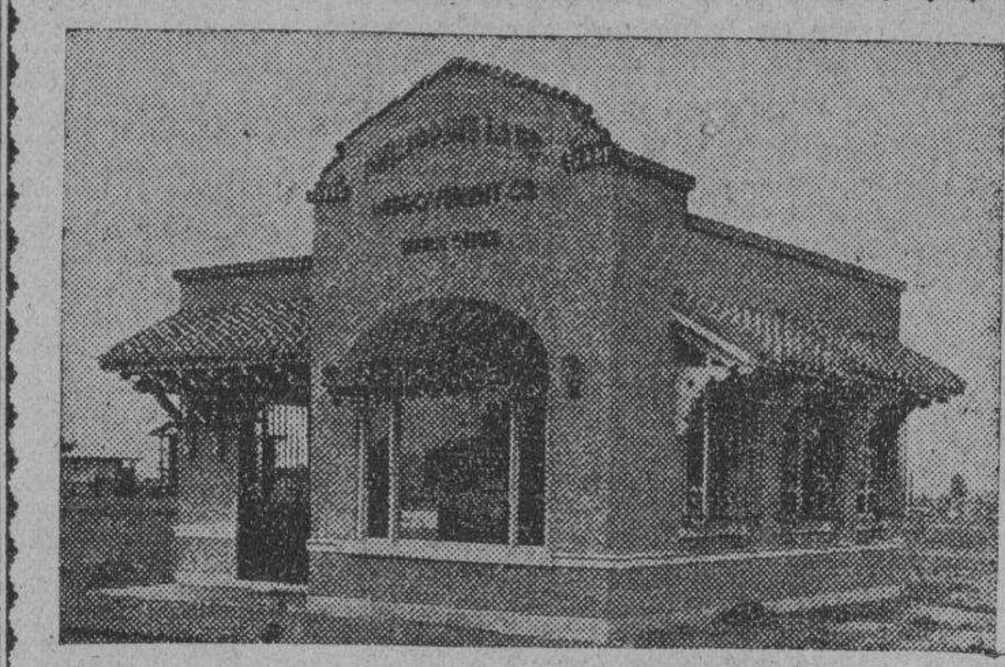
(Esta es nuestra Sucursal en la RIZAL AVE. HILLS)

Los hombres cambian de esposas, oficios y vecindades, esperando un vasto aumento en su felicidad. A veces consiguen lo que esperan; ordinariamente, no. La capacidad de muchos de nosotros para la alegría o la pena es limitada. Si nos es difícil vivir con gentes en los pequeños pueblos, seremos tan incapaces de vivir en las grandes ciudades. Si la gotera de los tubos nos irrita en casa, quedaremos más irritados por la carestía total de tubos en otras partes. Pocos de nosotros aceptarán semejante consejo como válido hasta después de que lo hayamos investigado. El viaje, por tanto, es un medio poco costoso de confirmar las máximas en el libro.