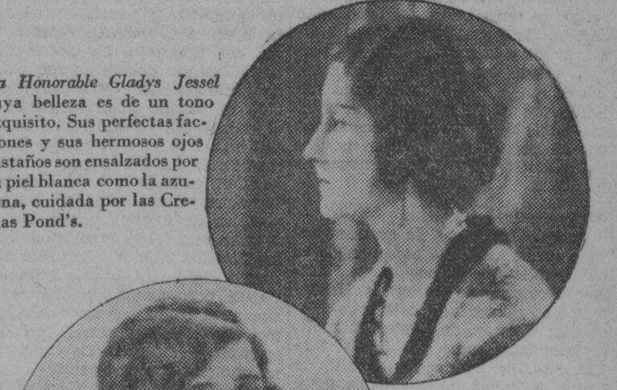
La Honorable Gladys Jessel cuya belleza es de un tono exquisito. Sus perfectas facciones y sus hermosos ojos castaños son enalzaos por su piel blanca, cuidada por las Cremas Pond's.

y el método favorito de cuidar sus Bellezas