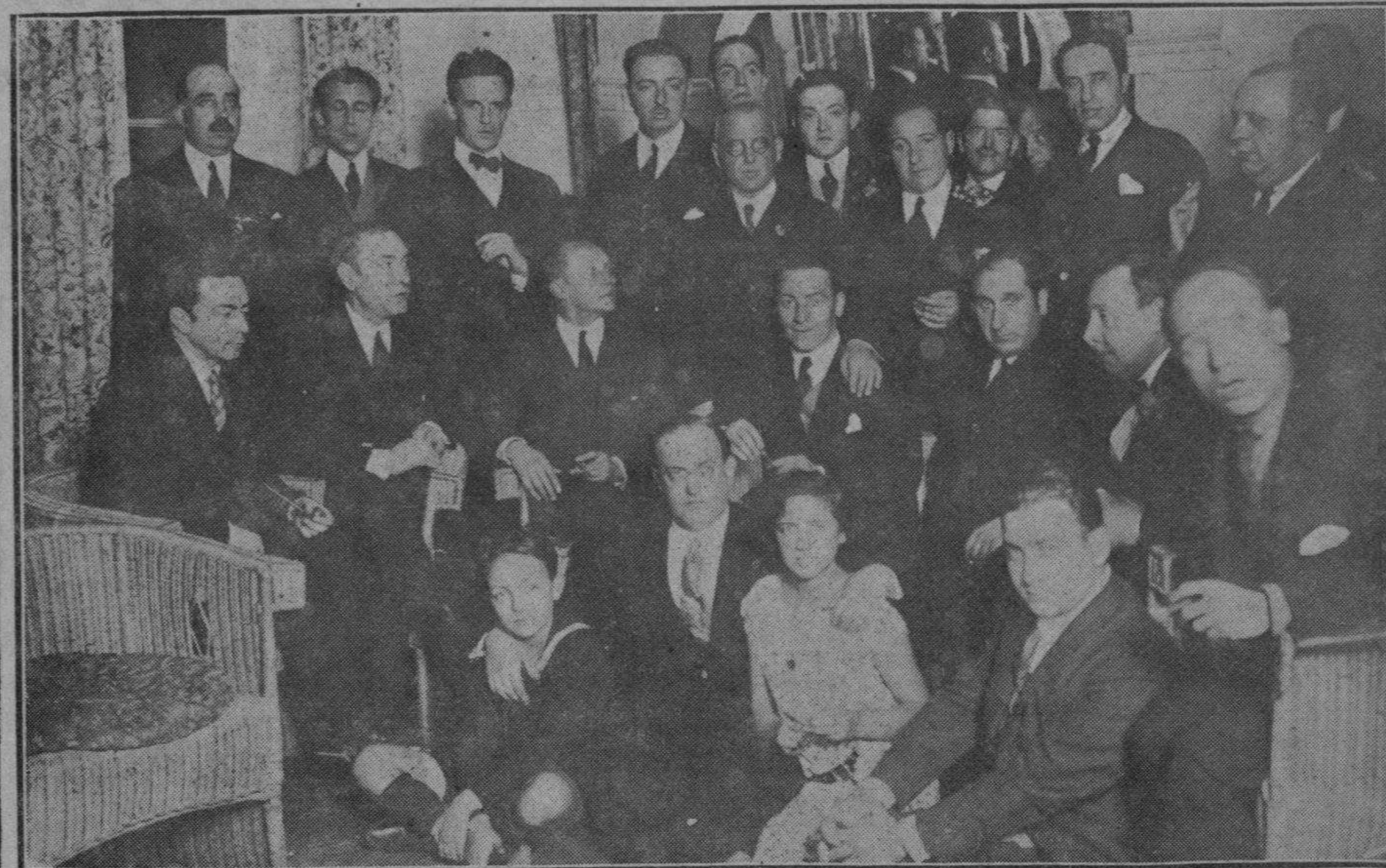
UN GRUPO DURANTE LA SOBREMESA