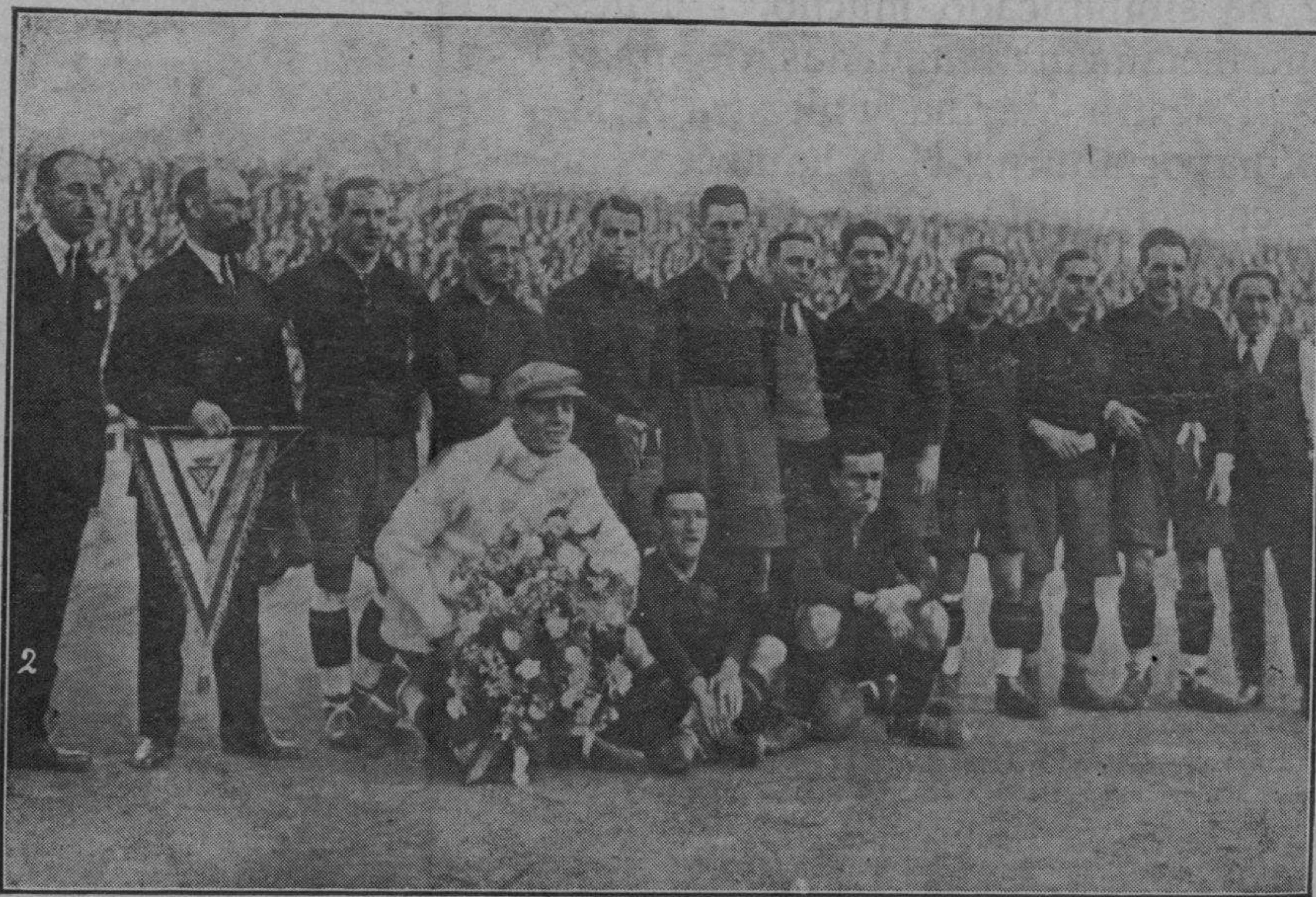
El equipo representativo de España, que anteaer ganó en Barcelona, por 2 a 1, al once nacional austriaco.