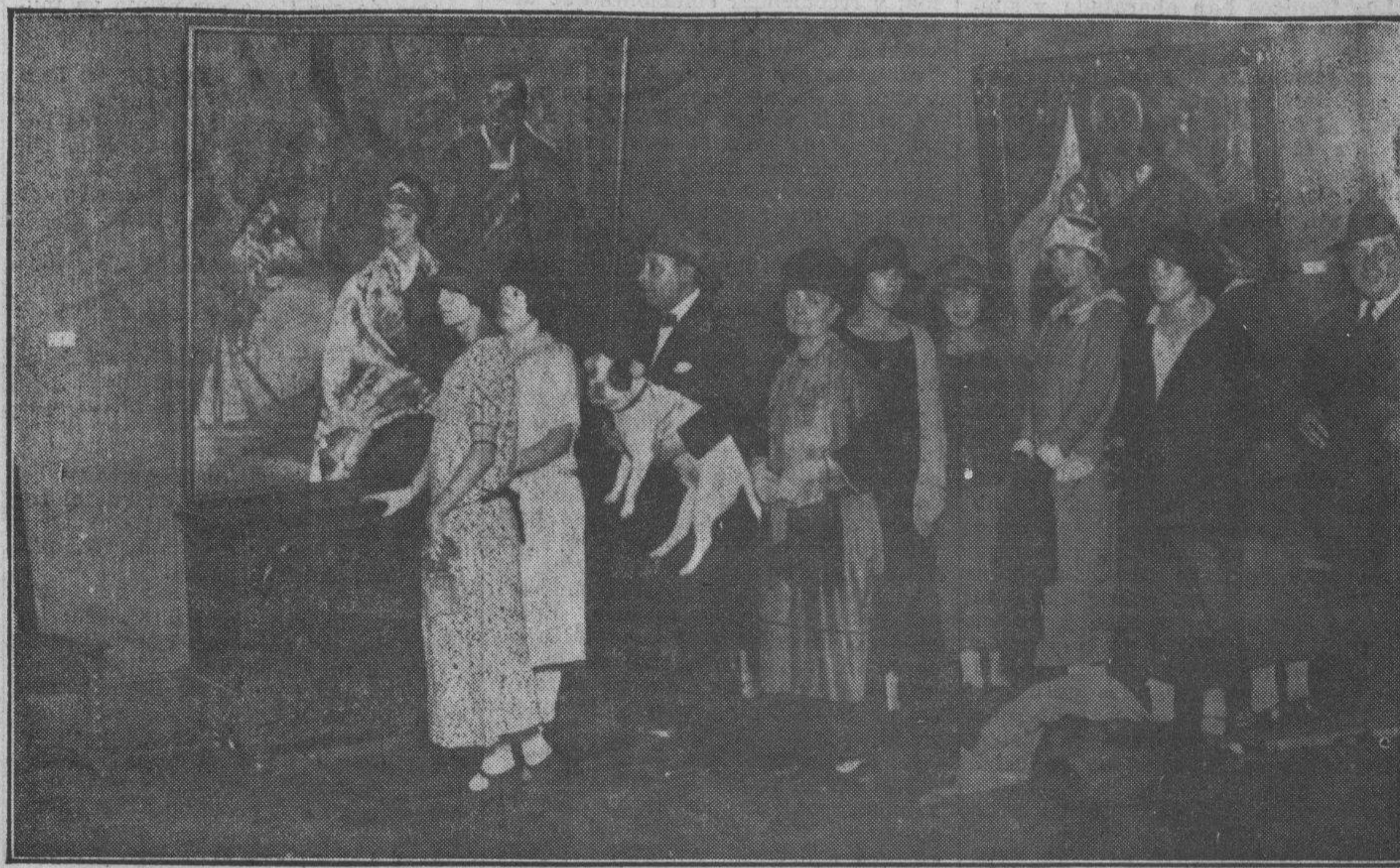
Hace unos días inauguraron una interesantísima exposición de pintura Gustavo de Maeztu y su inseparable perro. Nuestro fotógrafo ha sorprendido el glorioso momento en que ambos reciben el homenaje de varias distinguidas admiradoras.