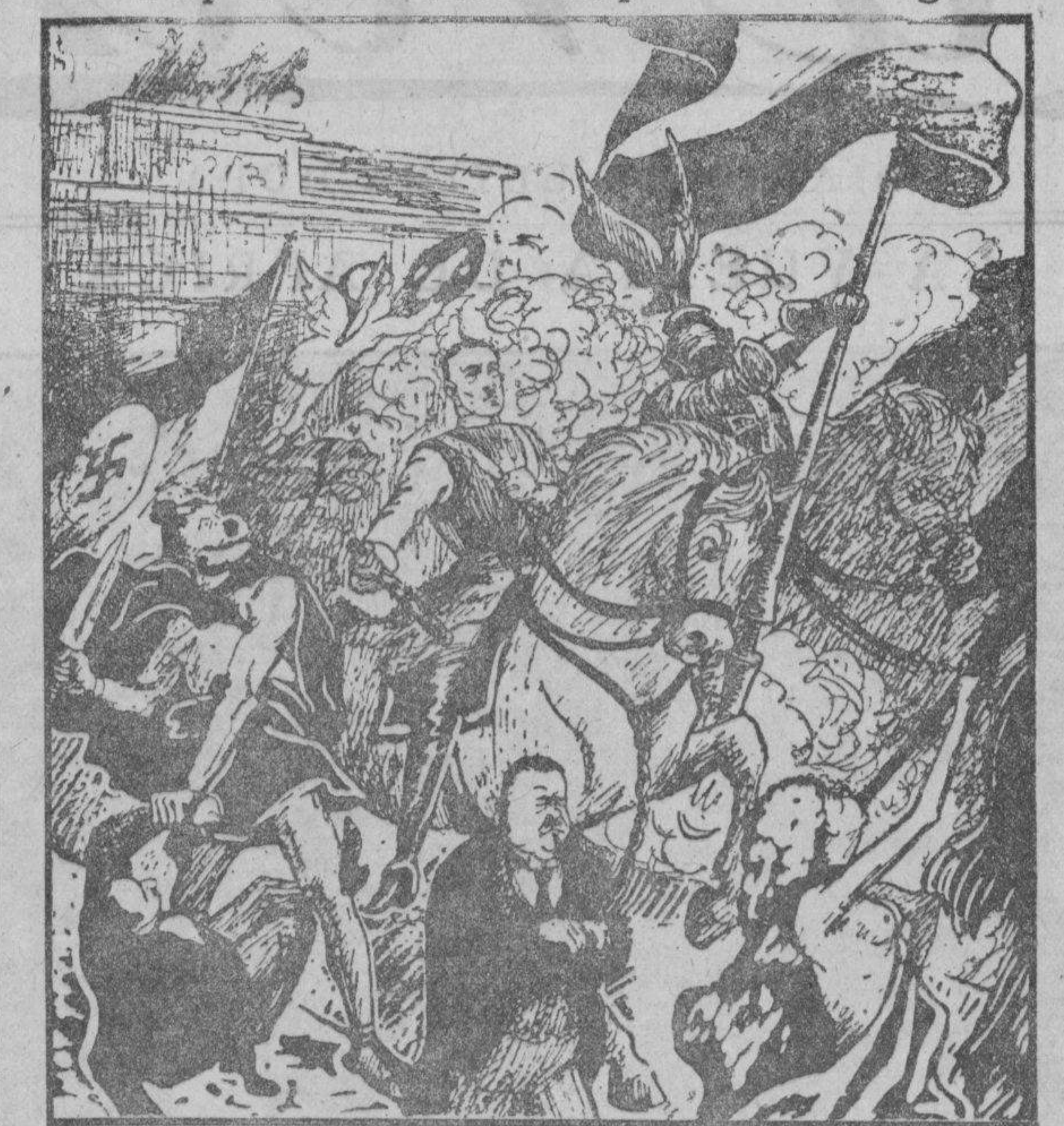
Von Hitler y los nacionalistas alemanes hacen su entrada solemne en Berlín. Ante ellos marcha, cargado de cadenas, el presidente, Ebert. (De «Simplicissimus», de Munich)

Después de las elecciones para el Reichstag