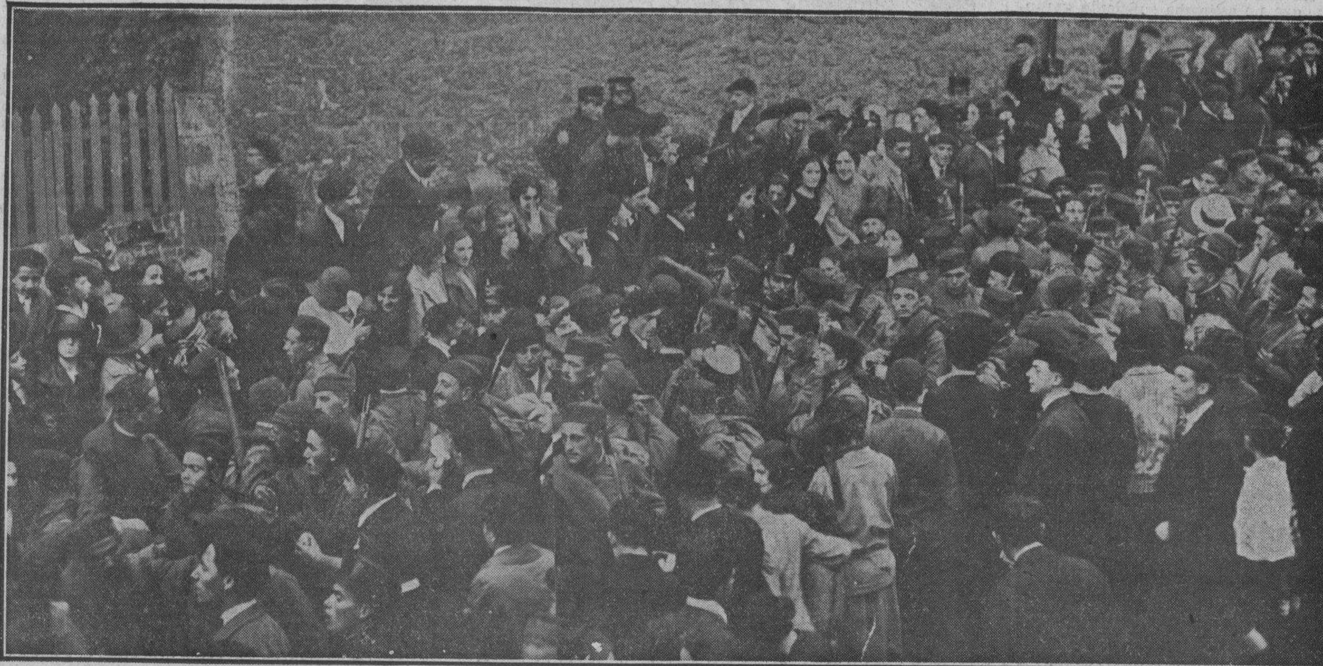
Recibimiento cordialísimo a los soldados de nuestro regimiento que han servido en Africa.

de lecturas recreativas. Acusa una dirección inteligente, una sucesión de bibliotecarios encarrinados con la librería y un público de lectores asiduos. El lector es también un conservador y un fomentador de las Bibliotecas. Los lectores hacen las Bibliotecas tanto como los bibliotecarios.