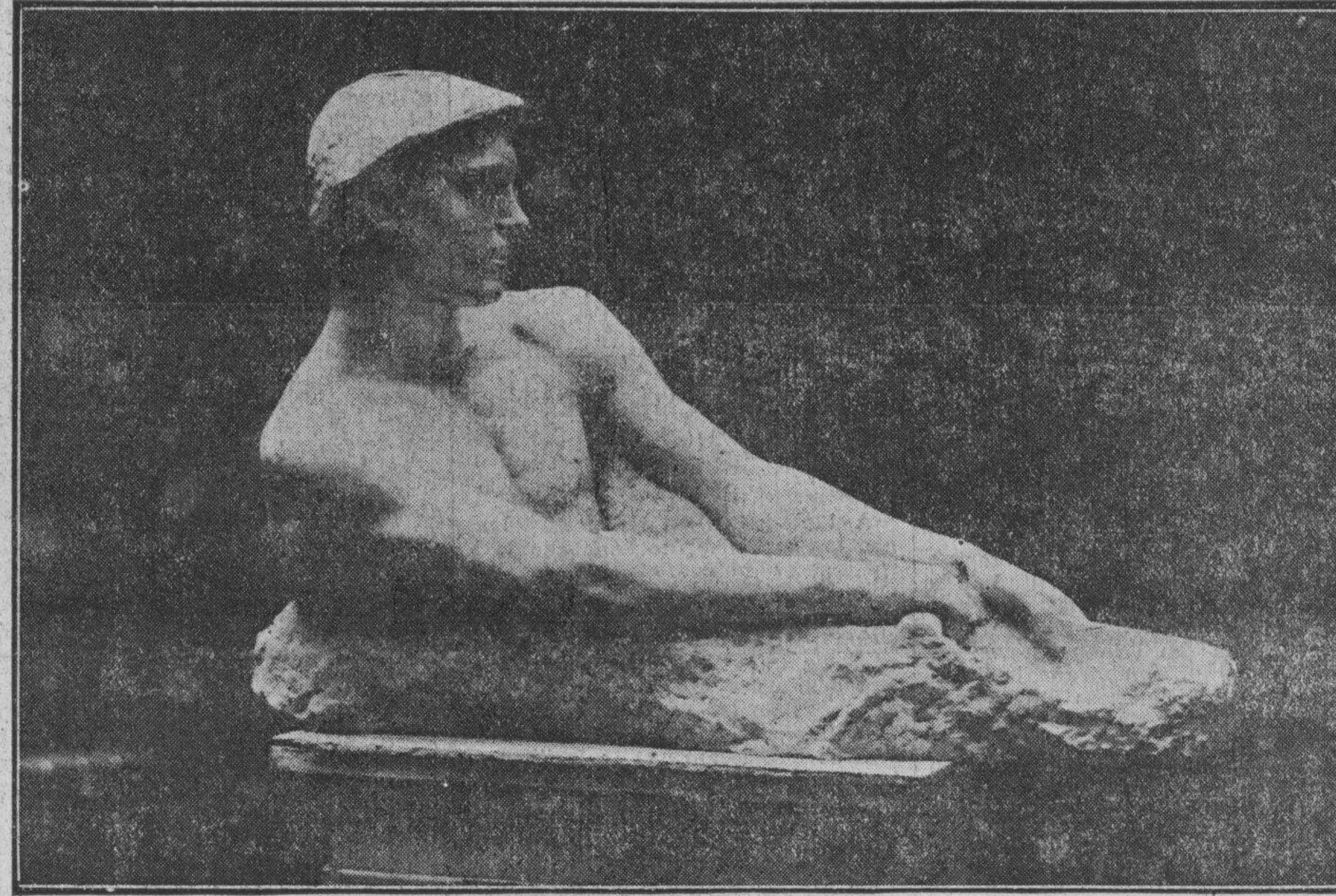
«JOVEN», ESCULTURA DE QUINTIN DE TORRE QUE FIGURA EN LA EXPOSICION DE LA ASOCIACION DE ARTISTAS VASCOS