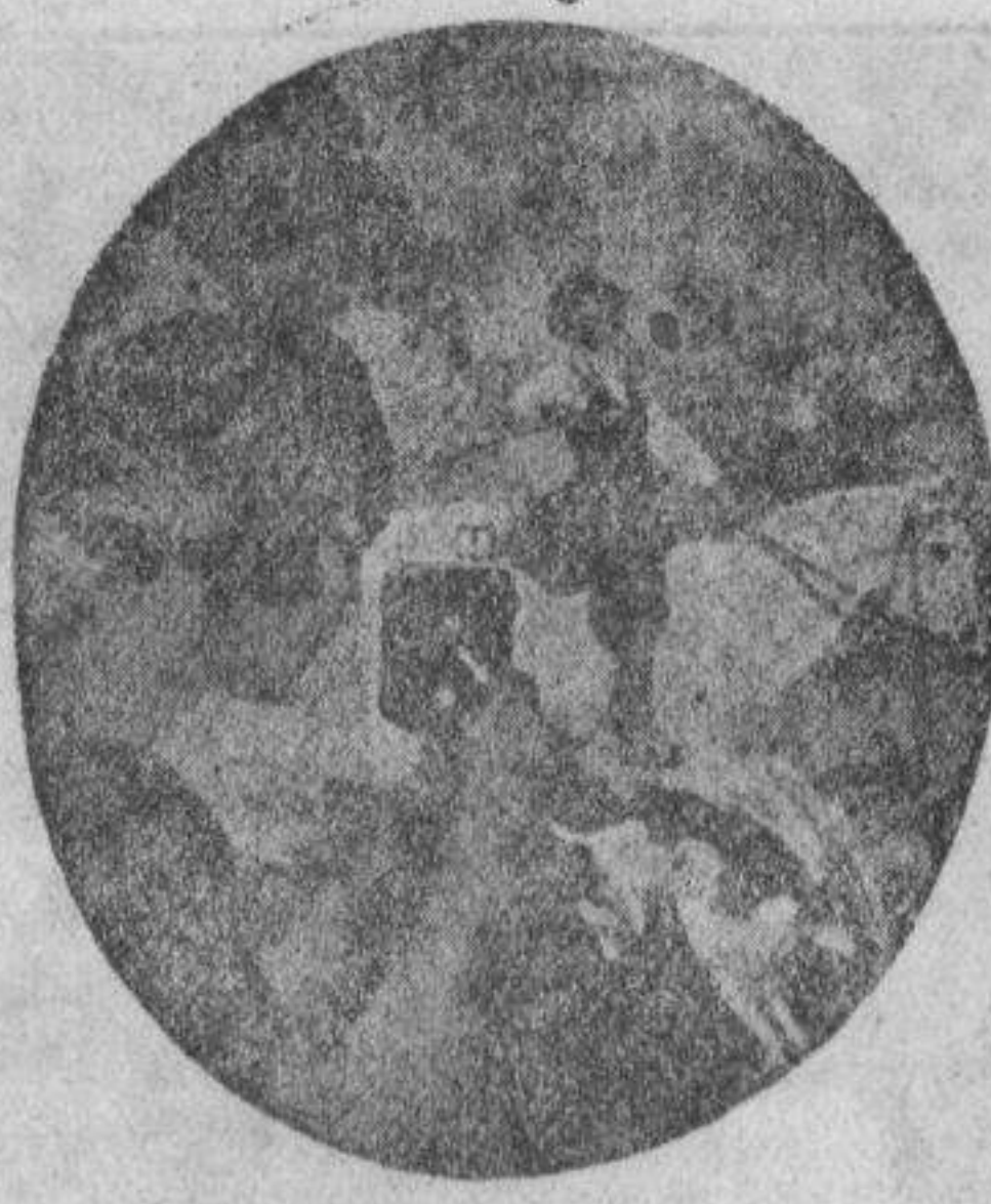
GRAN VIA. 6.

Moreno : BONITOS REGALOS PARA PEPITAS Y JOSÉS : CORREO, 15, bis