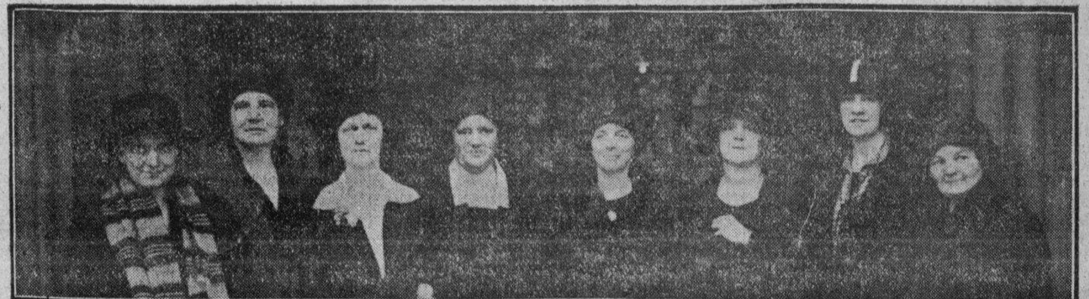
Las ocho parlamentarias inglesas, que han dirigido un llamamiento a las mujeres de Inglaterra, en favor de la paz del mundo.

Numerosas cuadrillas de merodeadores se dedican al pillaje, habiendo salido fuerzas de la guardia colonial para impedirlo. Se cree hay muchas víctimas.