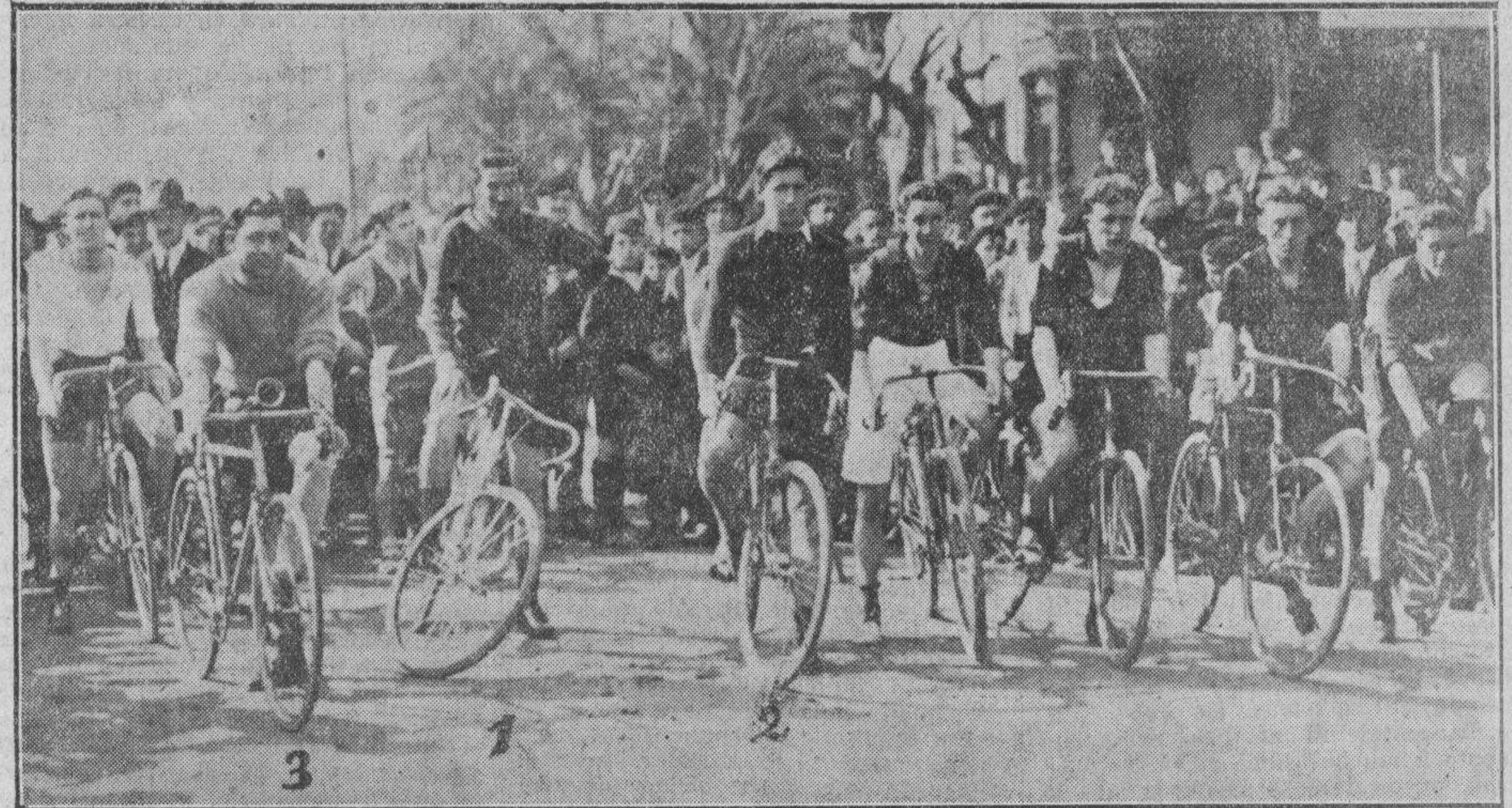
1. EL VENCEDOR LARRANAGA.—2. CHURRUCA, SEGUNDO.—3. LIBANO, PRIMERO EN UMBE.