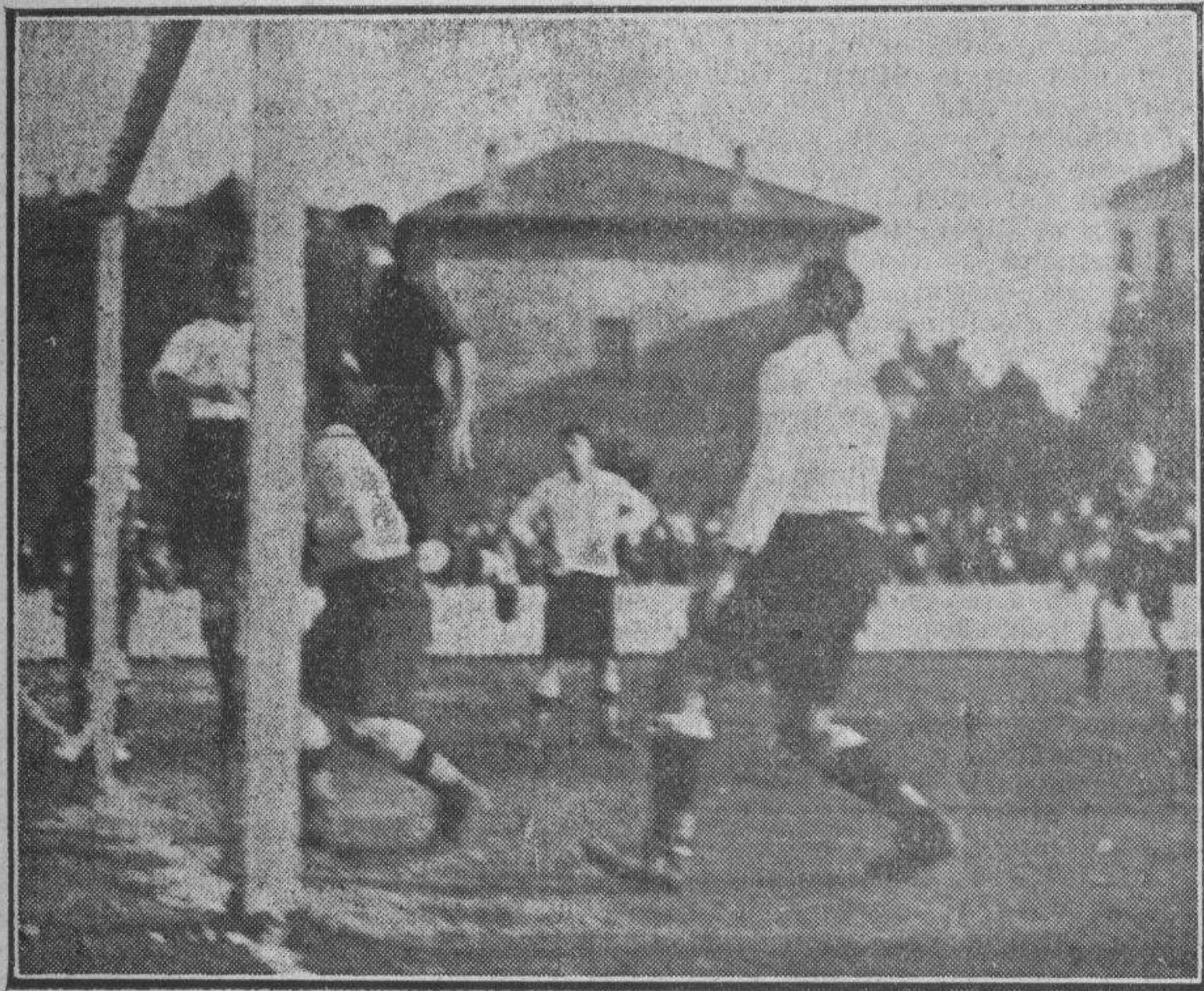
ARRUZA ATACANDO A LA META IRUNESA

trada. No acudió el público que era de esperar, tanto por la calidad de los equipos como por el fin benéfico del encuentro.