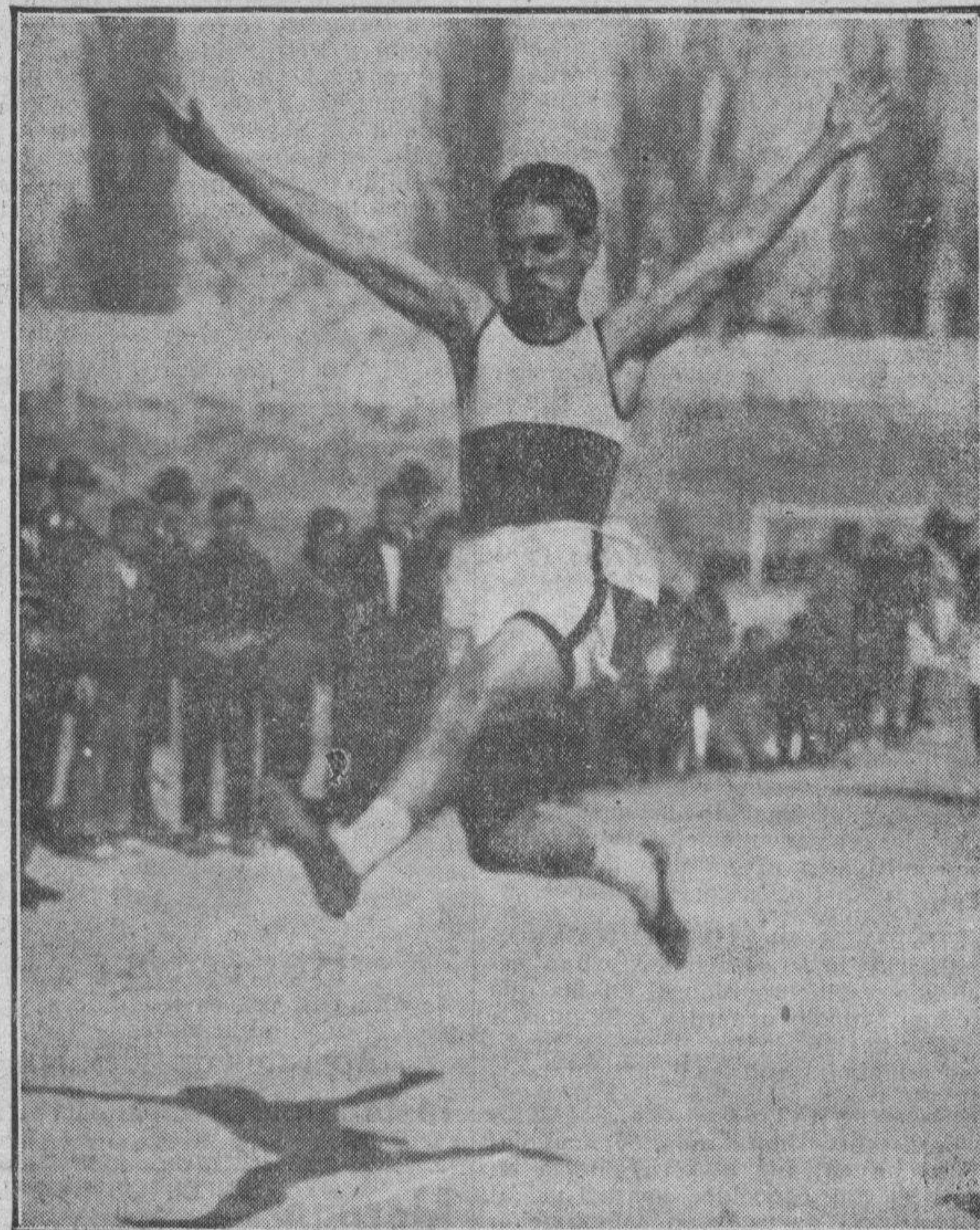
EN LOS 100 METROS DEL CONCURSO DE LA GIMNASTICA LOS CUATRO ROBLES EN 11 SEGUNDOS 4/5

Hemos sacado de él la impresión de que es un bonito equipo que en su clase puede hacer muy buenas actuaciones.