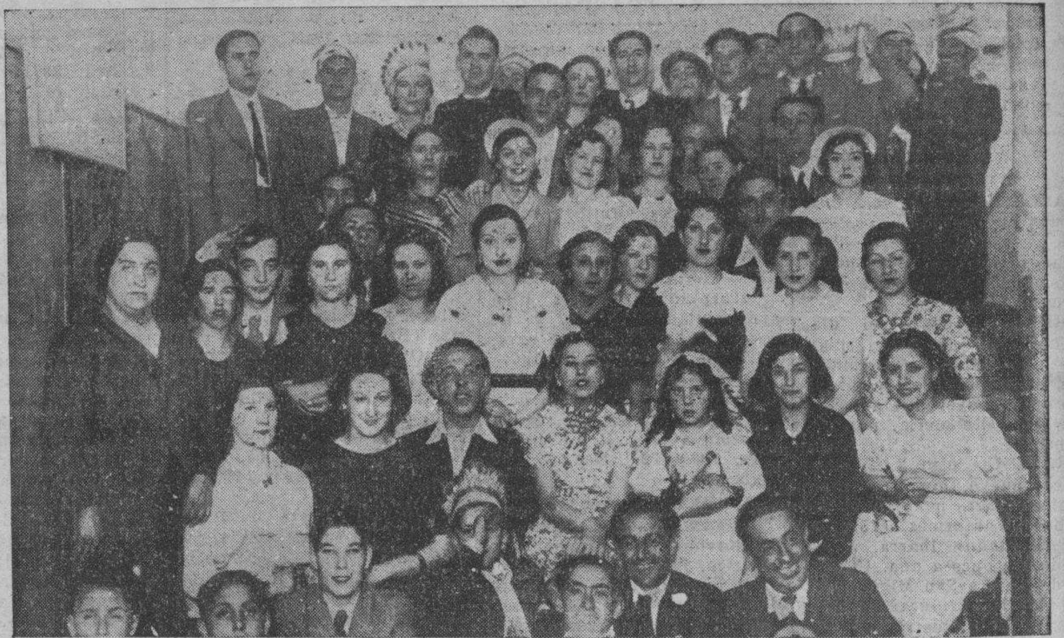
En el Centro Instructivo Ferroviario del Norte abundaron las mujeres hermosísimas, el buen gusto en los disfraces y la alegría más noble. De ahí el éxito de las fiestas de Carnaval en dicho organismo.