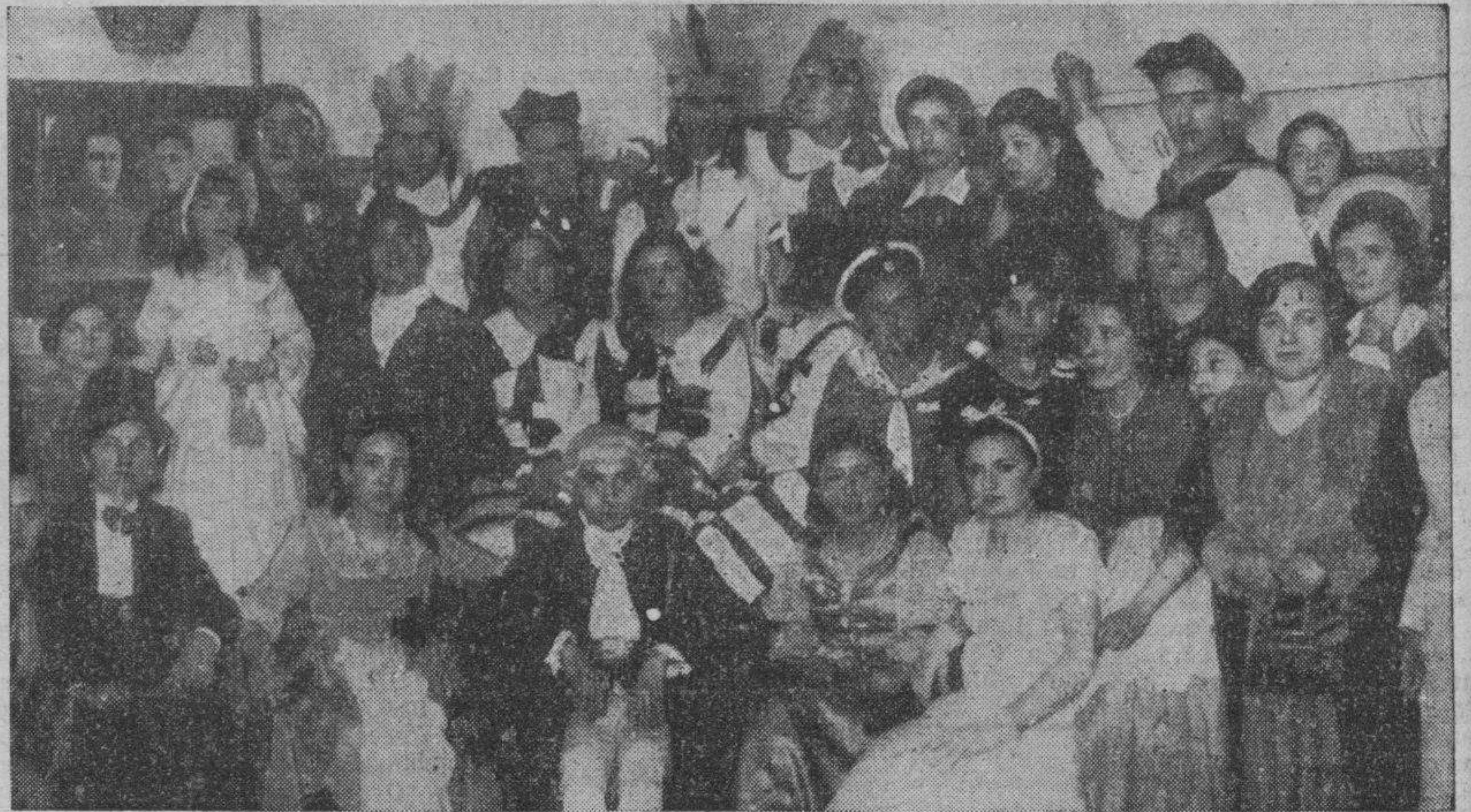
Los mismos elogios que para los demás Centros, tenemos para el admirable de Alianza Republicana de las Delicias. En sus fiestas carnavalescas hubo muchas mujeres bellas y el más excelente humor.