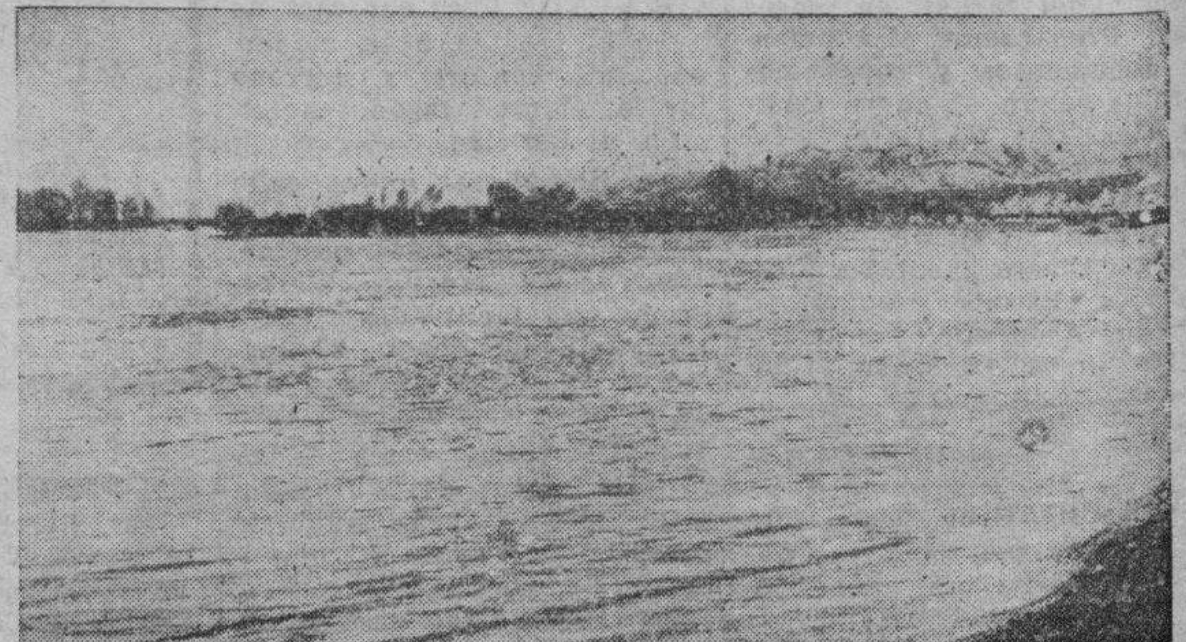
Las aguas del Ebro, desbordadas en Osera, forman inmensos lagos. Bajo aquéllas quedan destruídas las cosechas. La miseria está próxima. No lo olviden los gobernantes.