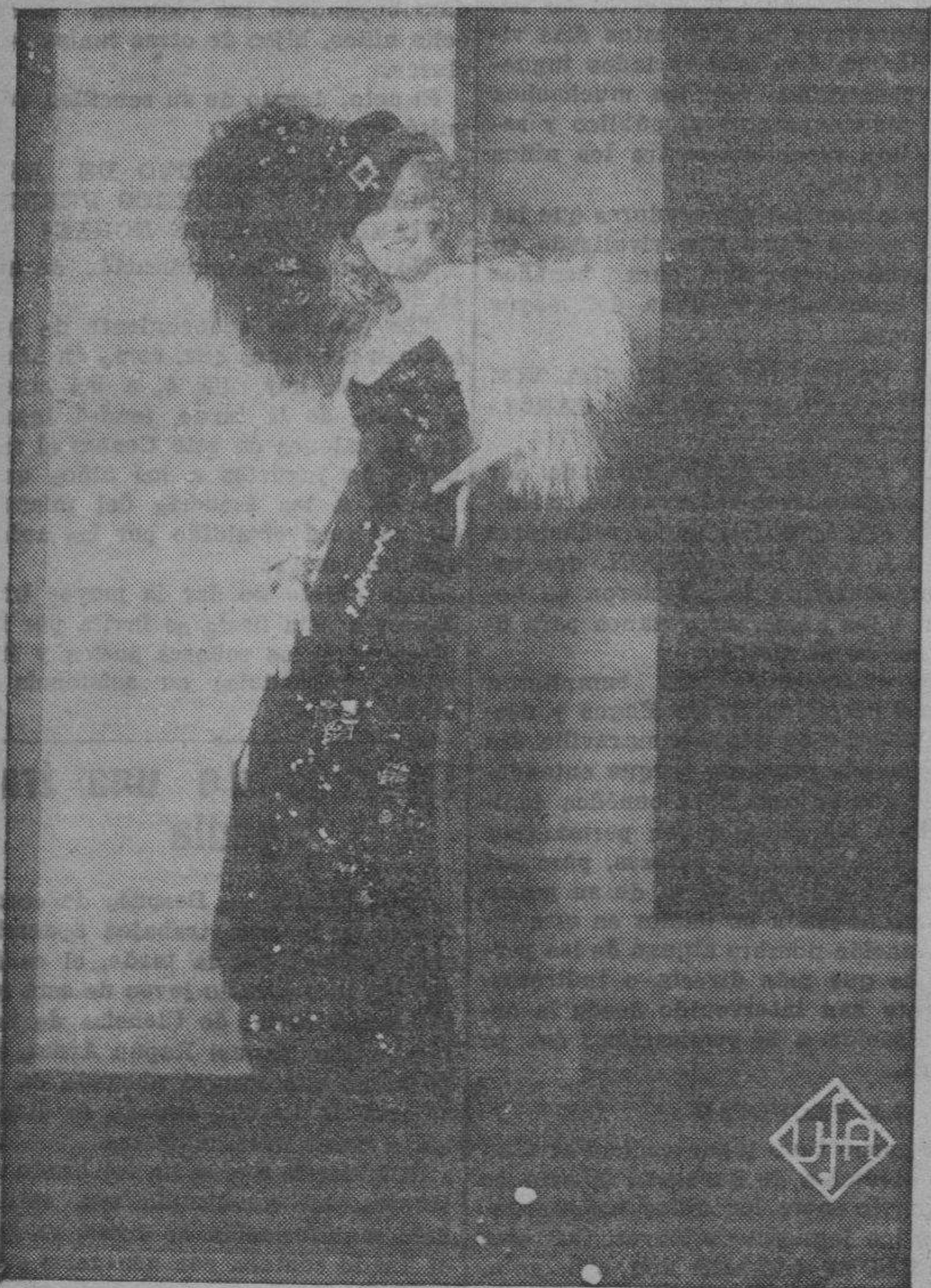
Marta Eggerth, la máxima "estrella" europea, obtiene su mayor triunfo en la superopereta Ufa "La princesa de la Zarda"

Giménez Arnau salió al escenario en compañía de los artistas al final de los tres actos para agradecer los cariñosos aplausos que se le tributa-