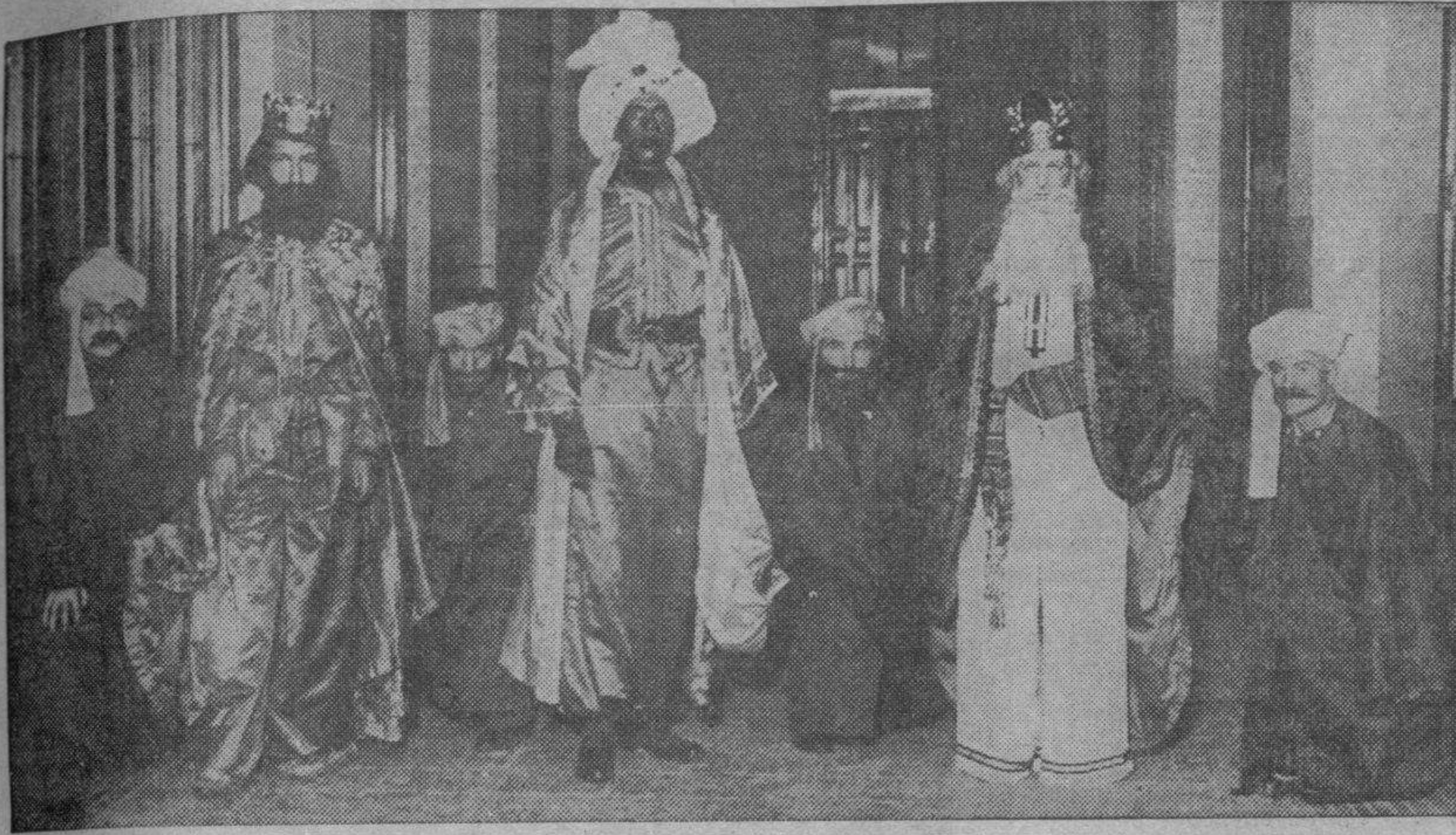
Los Reyes Magos y sus cuatro más fieles servidores