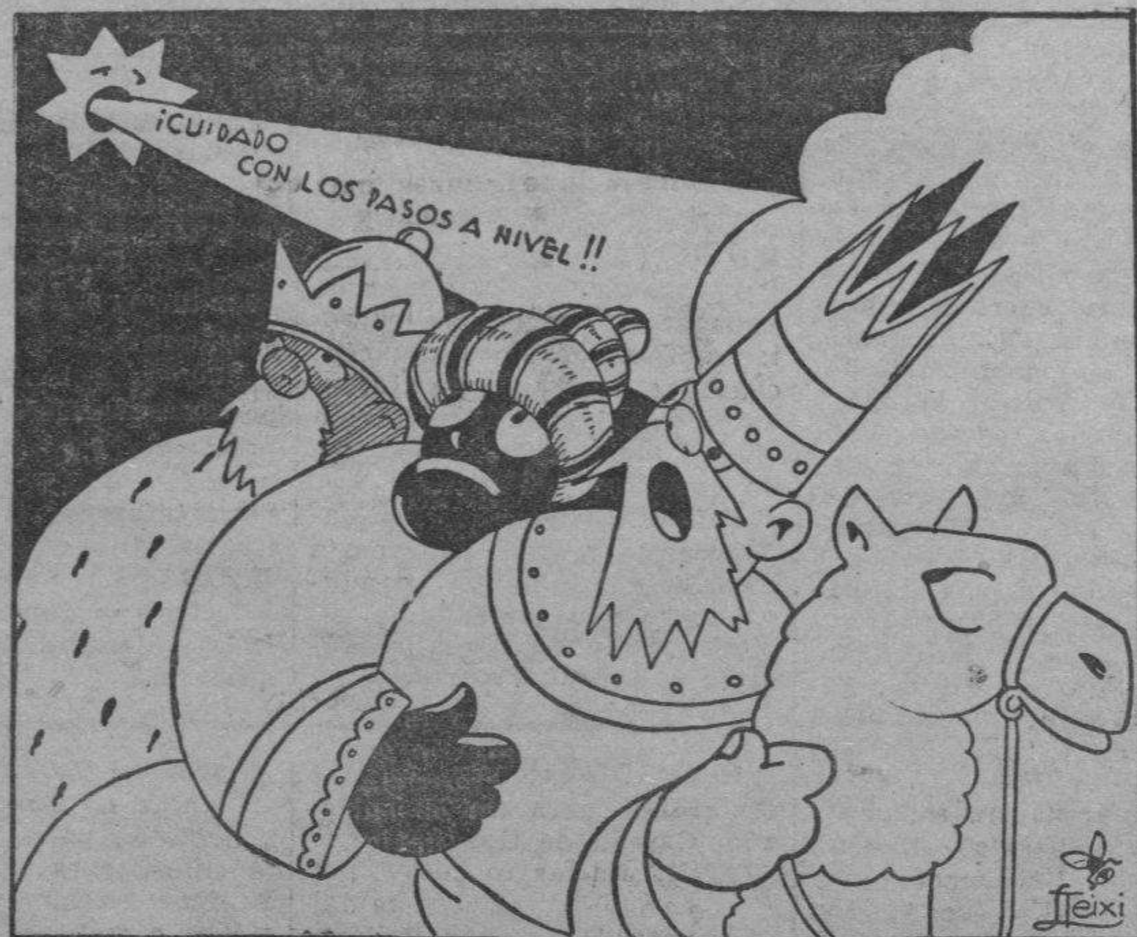
Camino de Zaragoza.