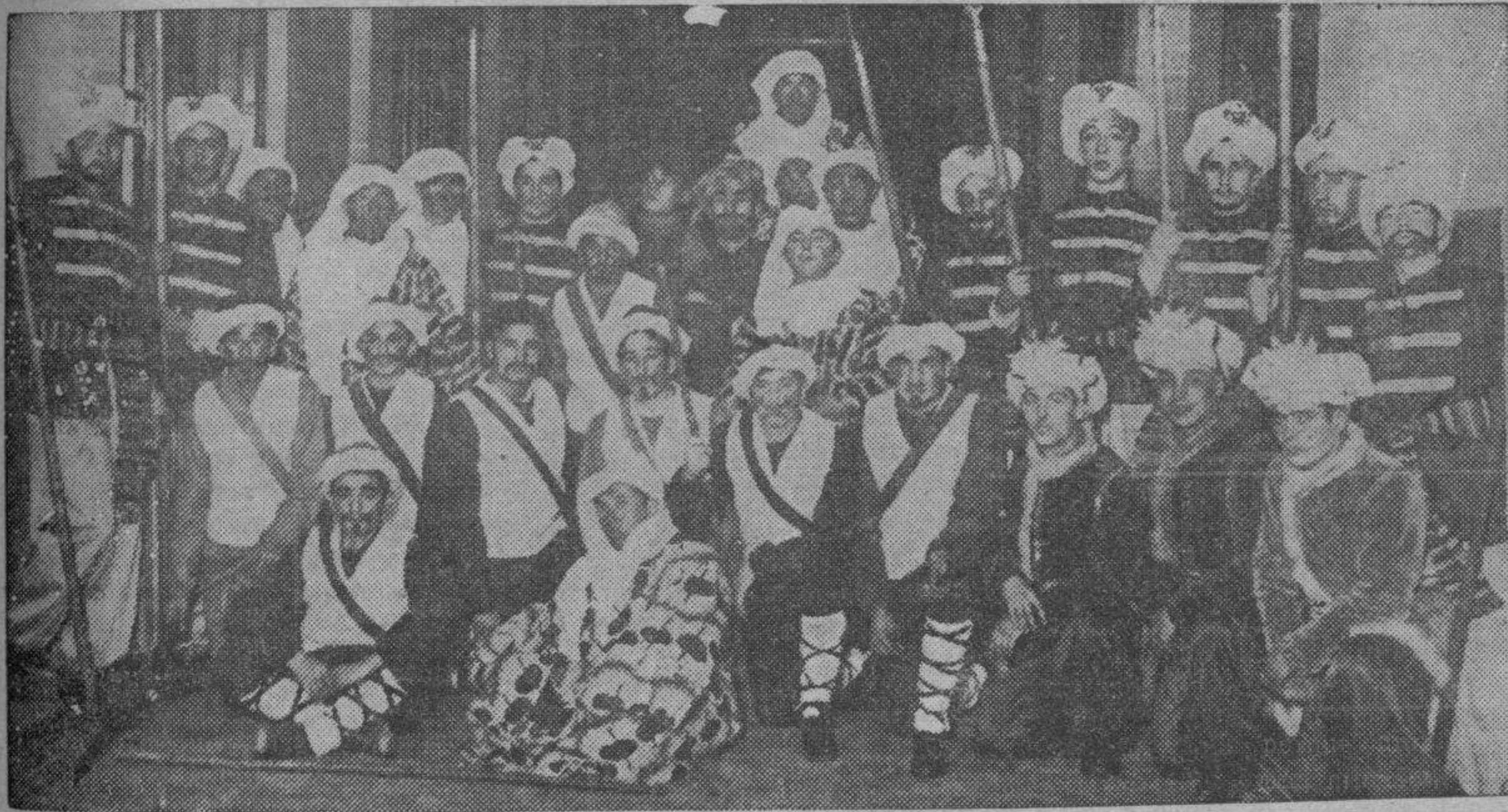
Pastores, persas, guerreros, etc., que formaron en el cortejo de los Reyes Magos.