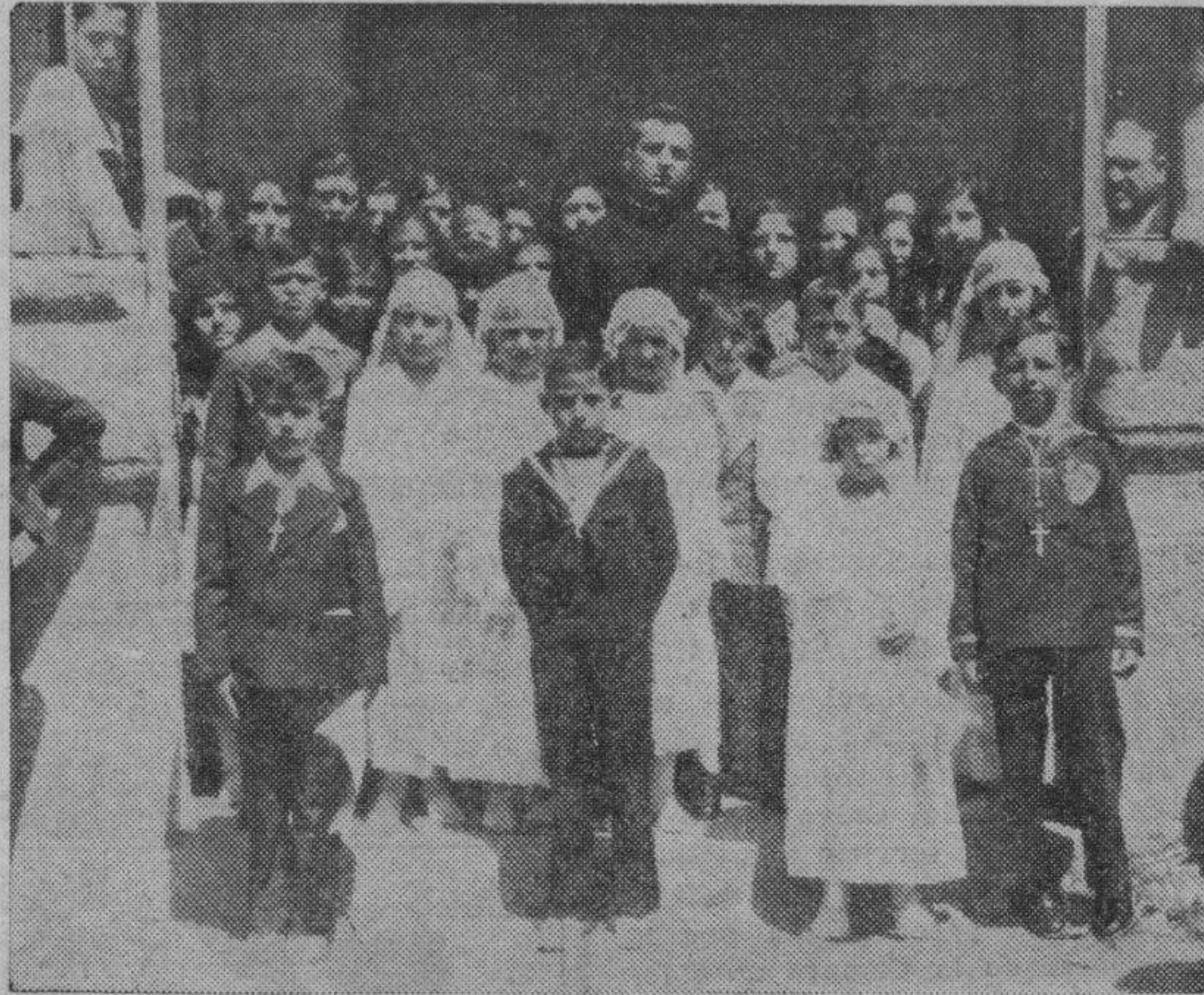
FARASDUES. — Niños de esta localidad que han tomado la primera co-munión.

"Por la presente nota se cita a los componentes de la Junta de esta biblioteca a una reunión que tendrá lugar el próximo domingo, día 27, a las once de la mañana, en el grupo escolar Gimeno Rodrigo".