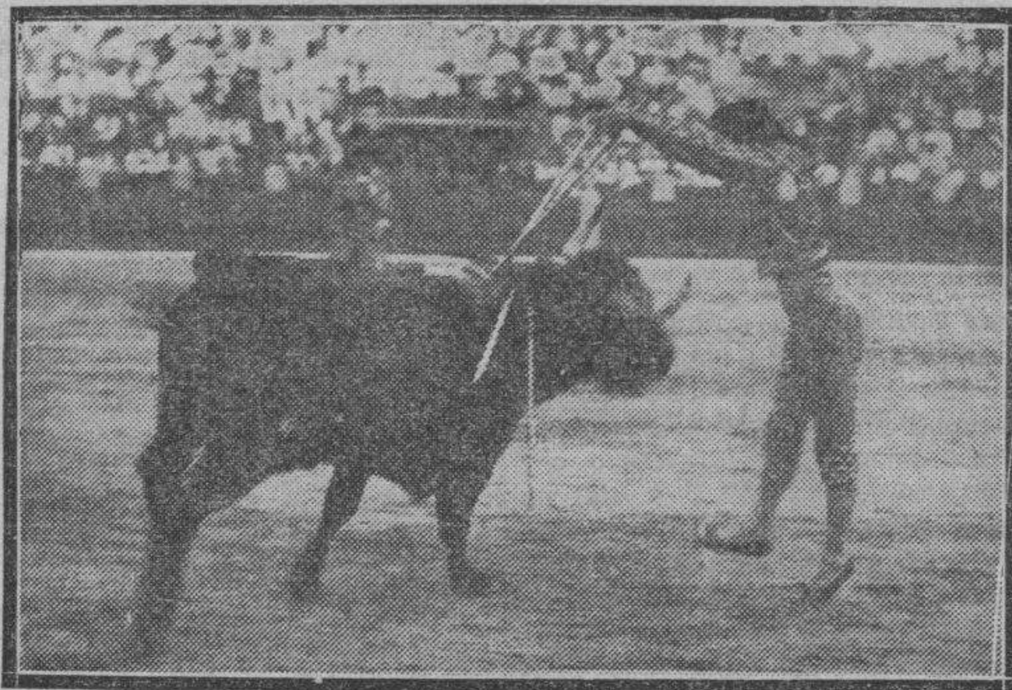
Torres en una de sus pocas intervenciones lucidas.