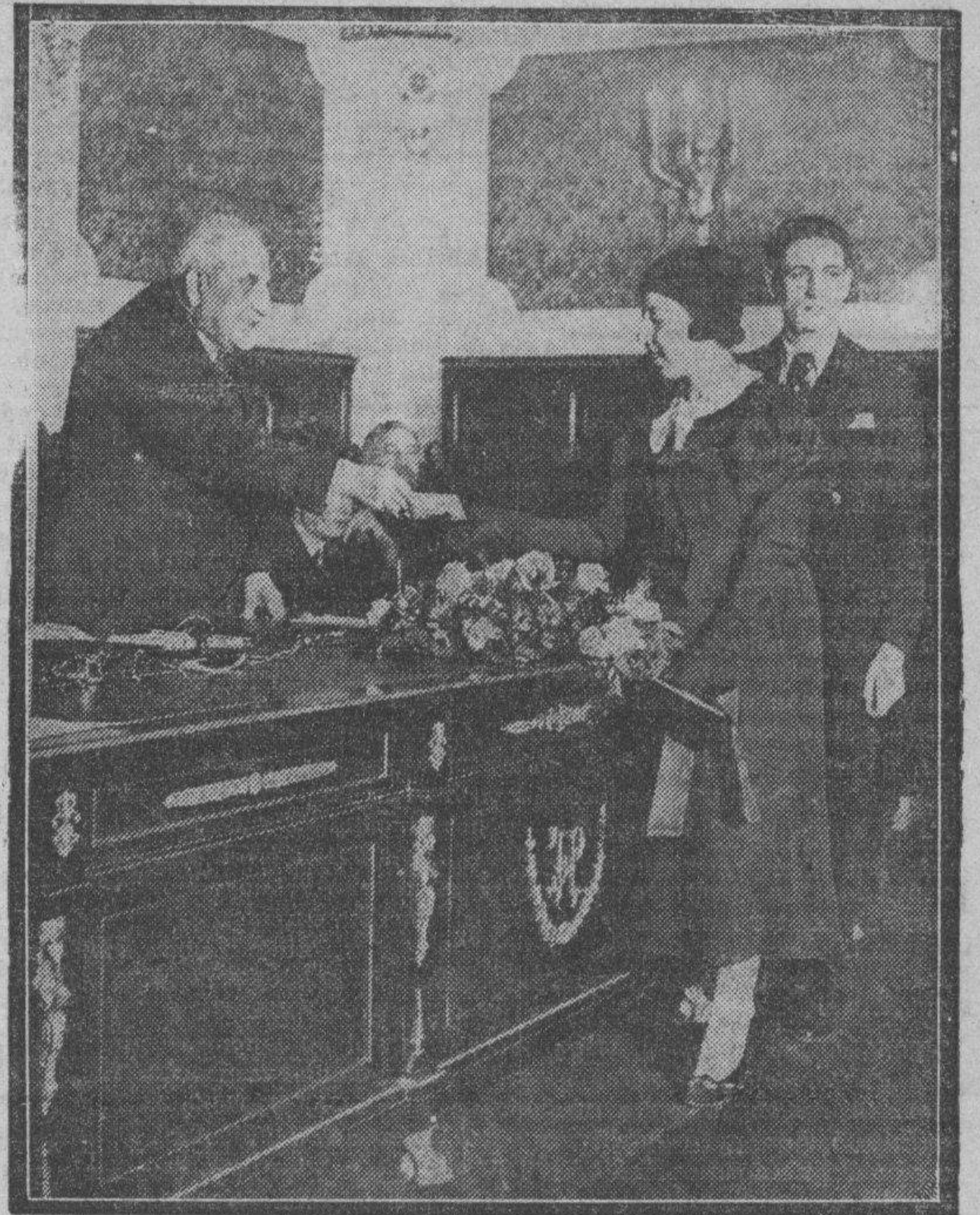
El general Marvá entrega el premio que lleva su nombre, acto verificado en el Instituto Nacional de Previsión.