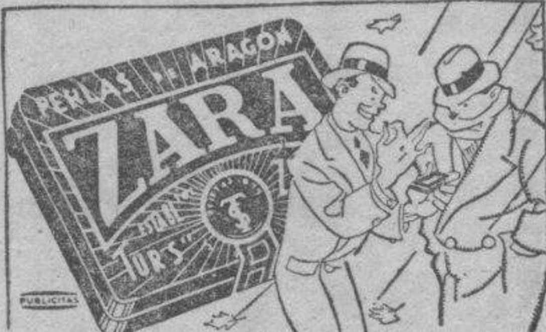
Esto le quitará la tos y no le ensuciará el estómago

El primero está condenado a veinte años de prisión y los demás a ocho.