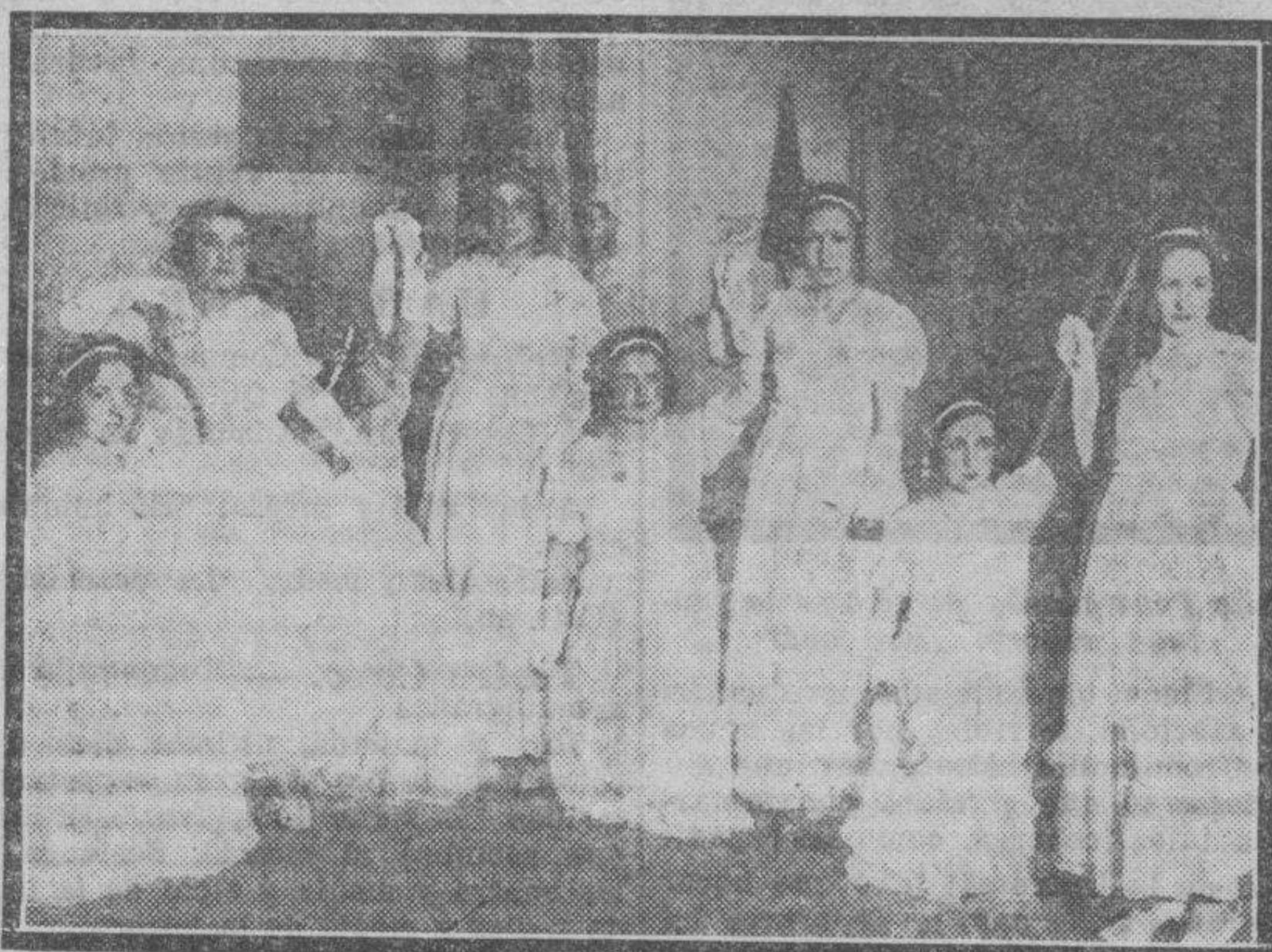
Grupo de bellísimas modistas que intervino en la fiesta que ayer tarde se verificó en el teatro Parisiana, organizada por la Sociedad Santa Lucía, con el mayor éxito.

A las cuatro de la tarde dió comienzo en Parisiana la fiesta de las modistas, organizada por la Sociedad de Santa Lucía.