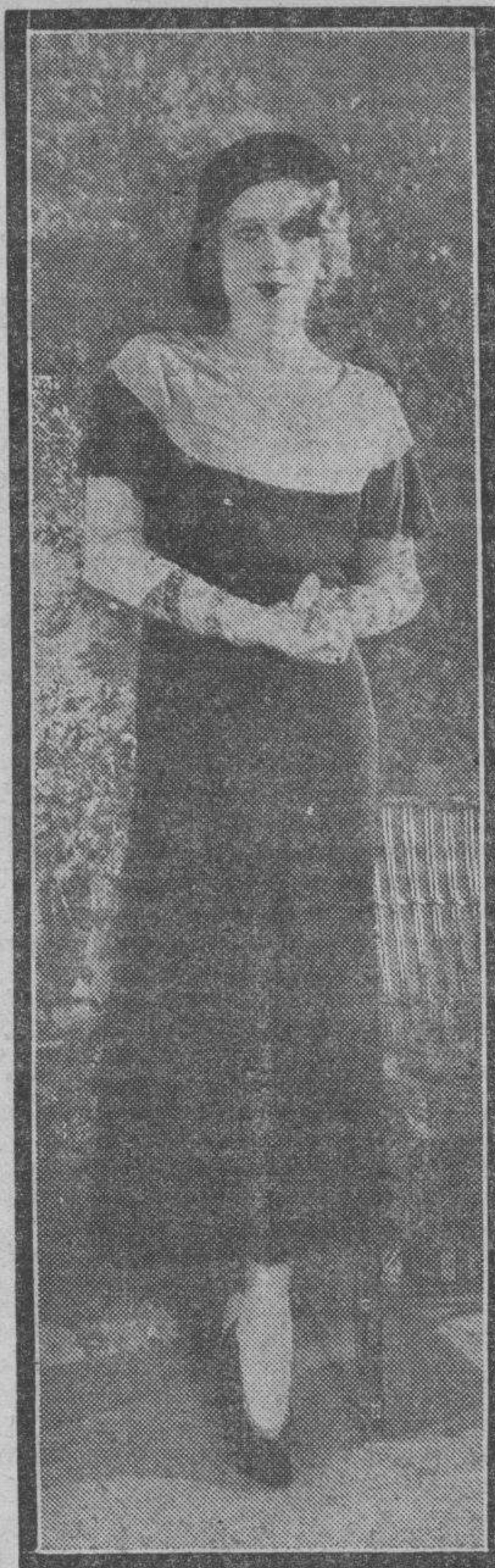
Anita Page guarda silencio en la pantalla sonora. ¿Por qué?

Dice Sepp Rist que desde el primer día que pisaron tierra groenlandesa estaban con el constante temor de ser enterrados por imponentes icebergs que pasaban a lo largo de la costa y aun se lanzaban contra la tierra formando verdaderas montañas de hielo infranqueable. Udet tuvo, por tanto, que buscar días y días con su aeroplano "Motte" un resguardo apropiado para acampar sin tales temores. El mar, en tales ocasiones, parece hervir —dice Rist—, formando gigantescos remolinos y espuma que sube a cientos de metros a causa de los quebrados monstruos