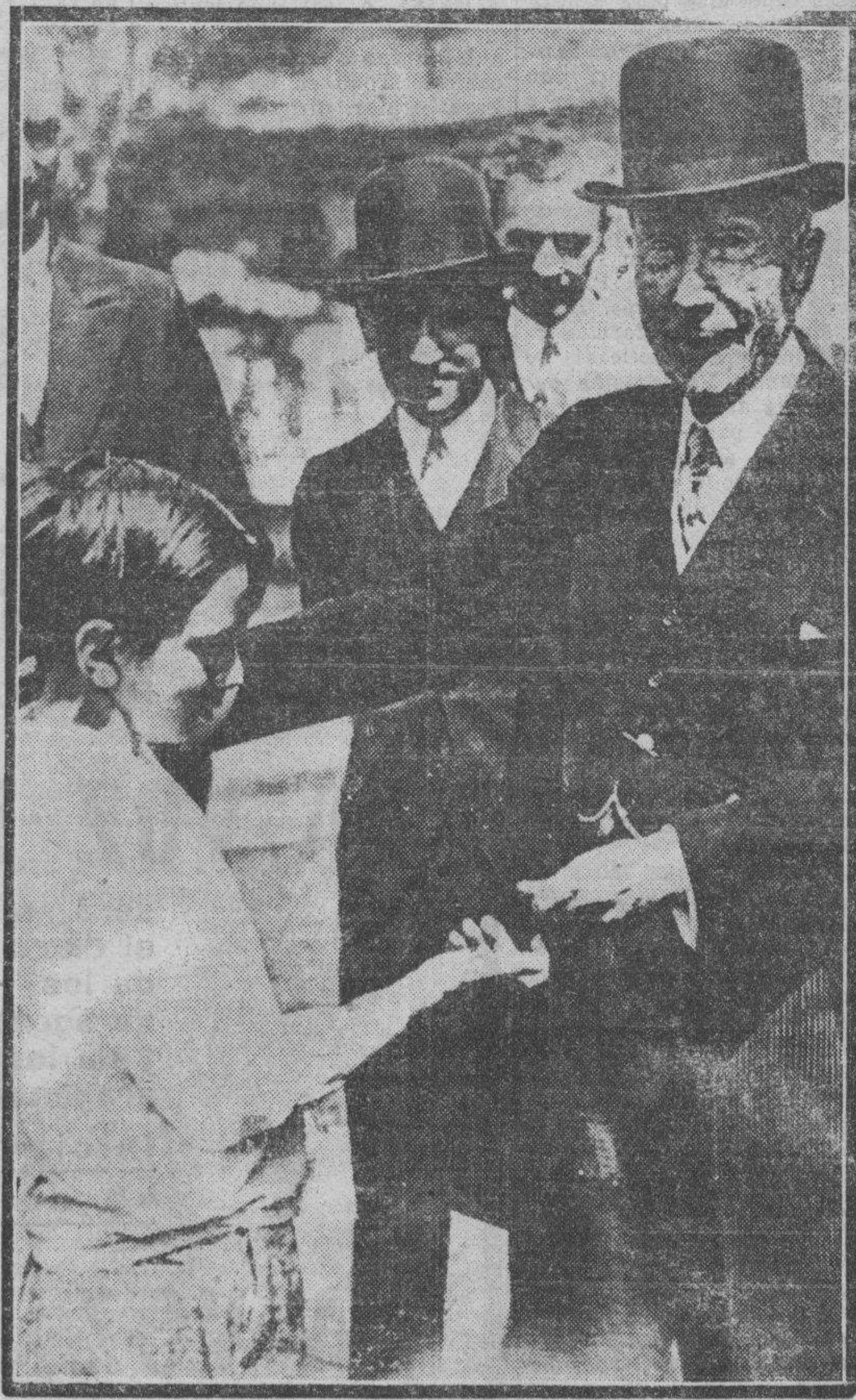
El hombre más rico del mundo, el multimillonario norteamericano John D. Rockefeller, de 94 años, que se halla convaleciente de un ataque gripal, y cuyo estado de salud tiene preocupada a la ciencia médica. En la foto aparece el millonario filántropo repartiendo limosnas entre los niños.