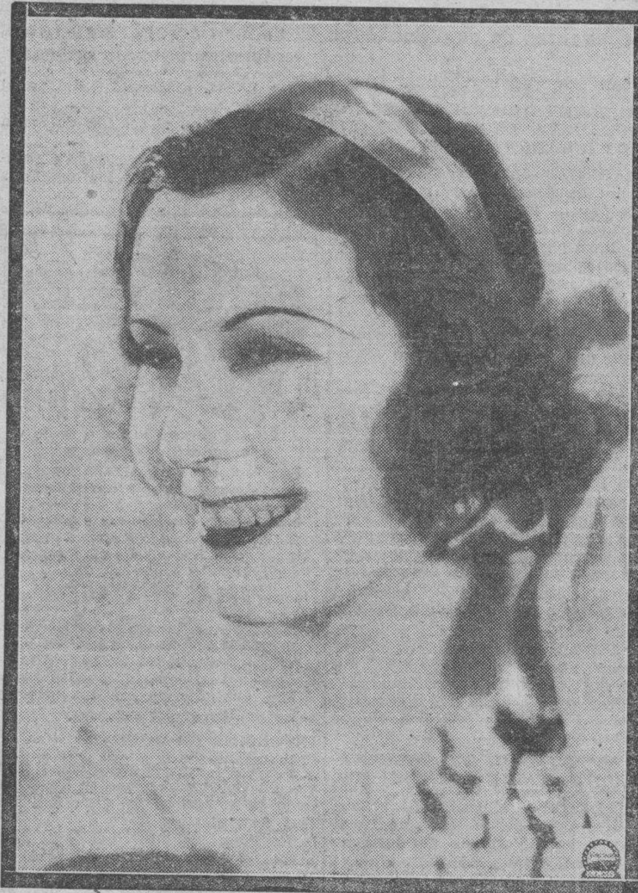
La bellísima artista del cinema hispano parlante, figura destacada que tantos y tantos éxitos ha logrado en su breve pero intenso historial cinematográfico. Recientes algunas de las películas en las que Rosita Díaz Gimeno logra una lucida actuación interpretativa, los elogios que de esta bella muchacha pudiéramos hacer, como artista, quedan supeditados al entusiasmo con que el público saborea las películas protagonizadas por la artista de ojos apicarados.