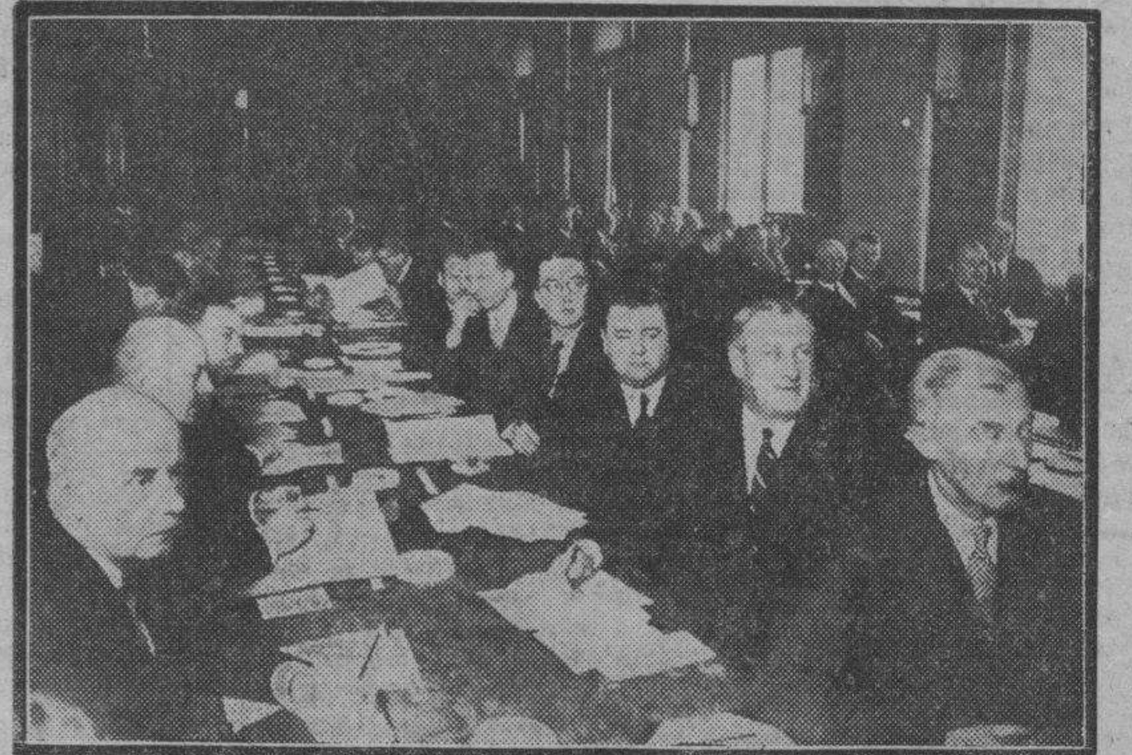
En Madrid se ha reunido la Conferencia Internacional de Prensa convocada por el Gobierno español como consecuencia del acuerdo adoptado en Copenhague. En la fotografía aparecen los asambleístas extranjeros durante sus tareas.