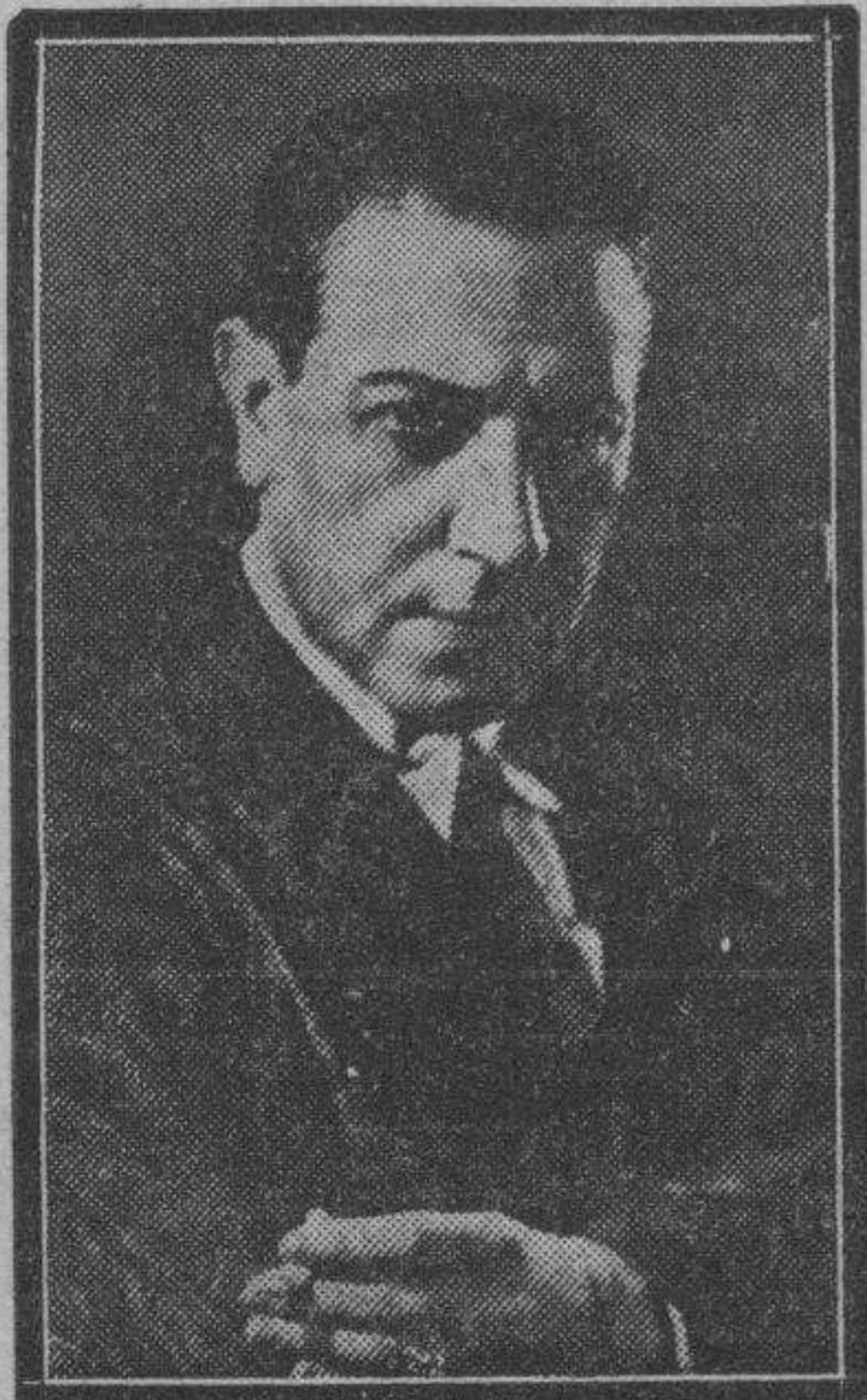
Rambal, el actor de los grandes espectáculos, vuelve a nuestra ciudad, donde tantas y tan fervorosas simpatías tiene, para debutar esta noche al frente de un numeroso y selecto elenco artístico.

Nosotros nos permitimos hablar de ello a las autoridades. Lo hacemos con desesperanza. Creemos que de nuevo habremos de dirigirnos a ellas. Es que hablamos y hemos de hablar en nombre de los habitantes de una ciudad que se siente desamparada en su derecho a disfrutar de lo que legal y moralmente le pertenece.