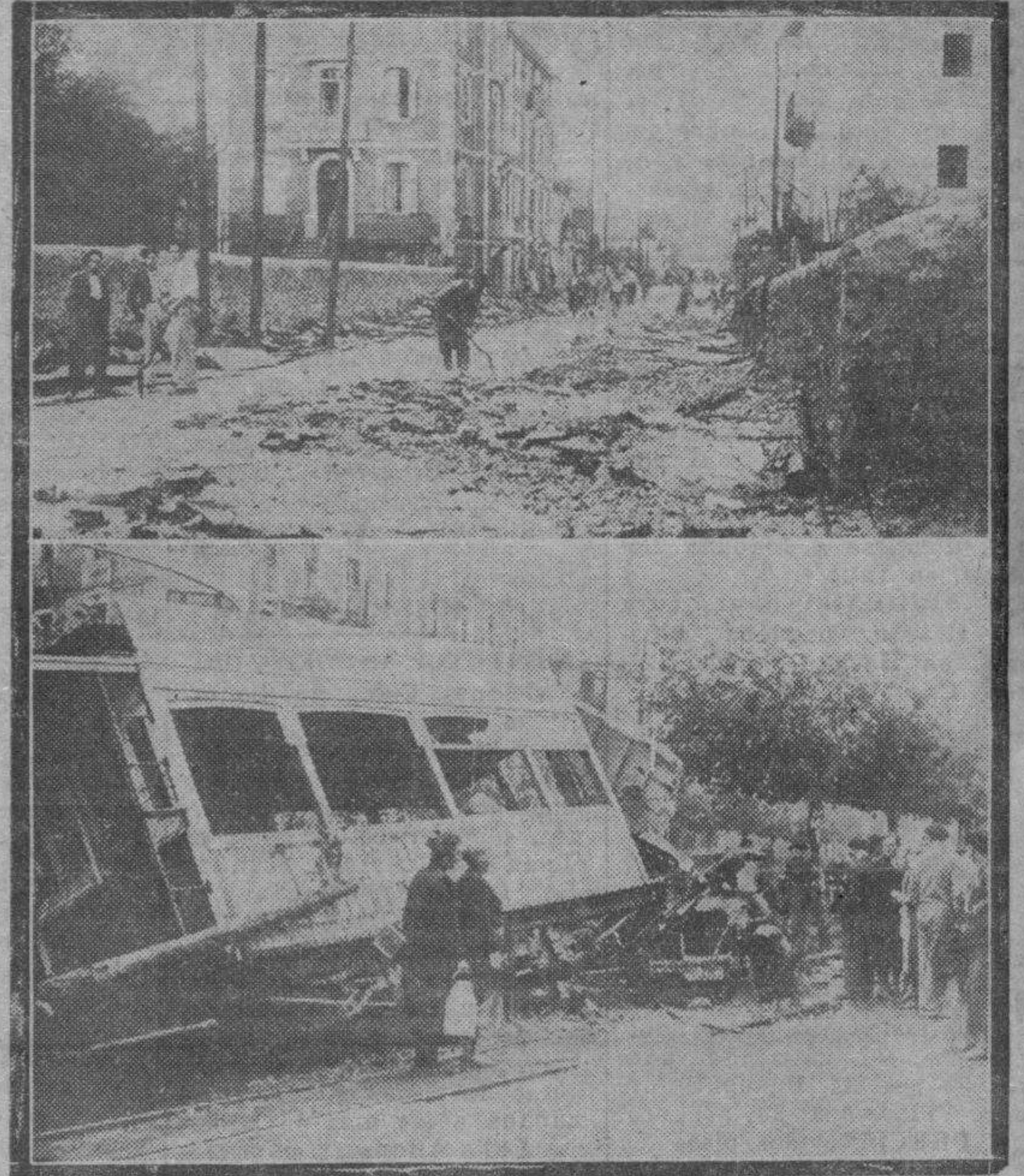
SAN SEBASTIAN. — La carretera de Irún a Rentería destruida por las aguas. Para dar idea de la violencia del temporal basta contemplar esta fotografía, hecha en Rentería al día siguiente de la catástrofe.