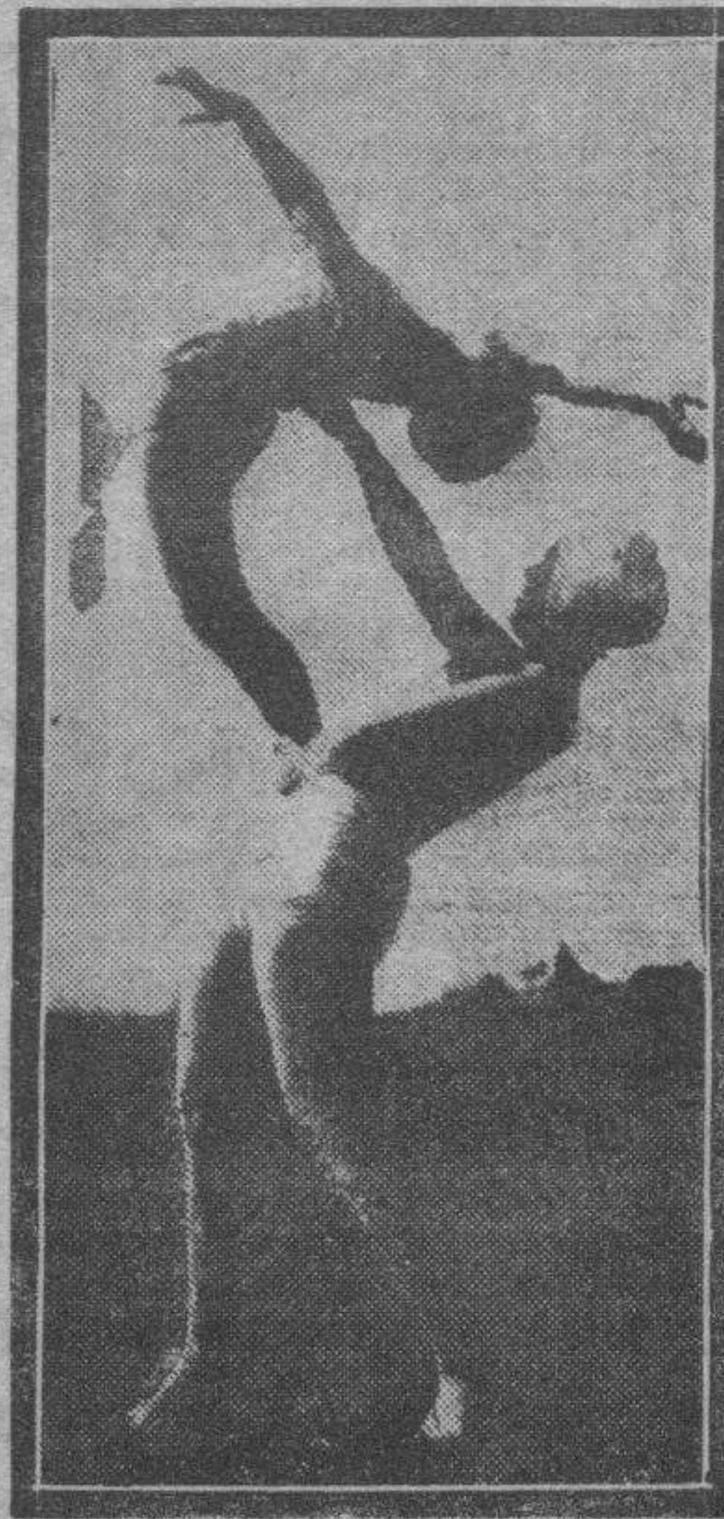
La espectacular armonía de las "girls" que danzan en el tablado carece, para el vulgo, de importancia. Nadie, o casi nadie, sabe cuánto sacrificio lleva implícita cada contorsión, cada salto, cada flexión de piernas. Ved a estas muchachas, en la niñez todavía, practicando los más violentos ejercicios para llegar, en un día lejano, a dominar esa espectacular gimnasia que tanto nos entretiene. Compadezcámostas.

"Hay dos maneras de mentir: la primera consiste en mentir normal-