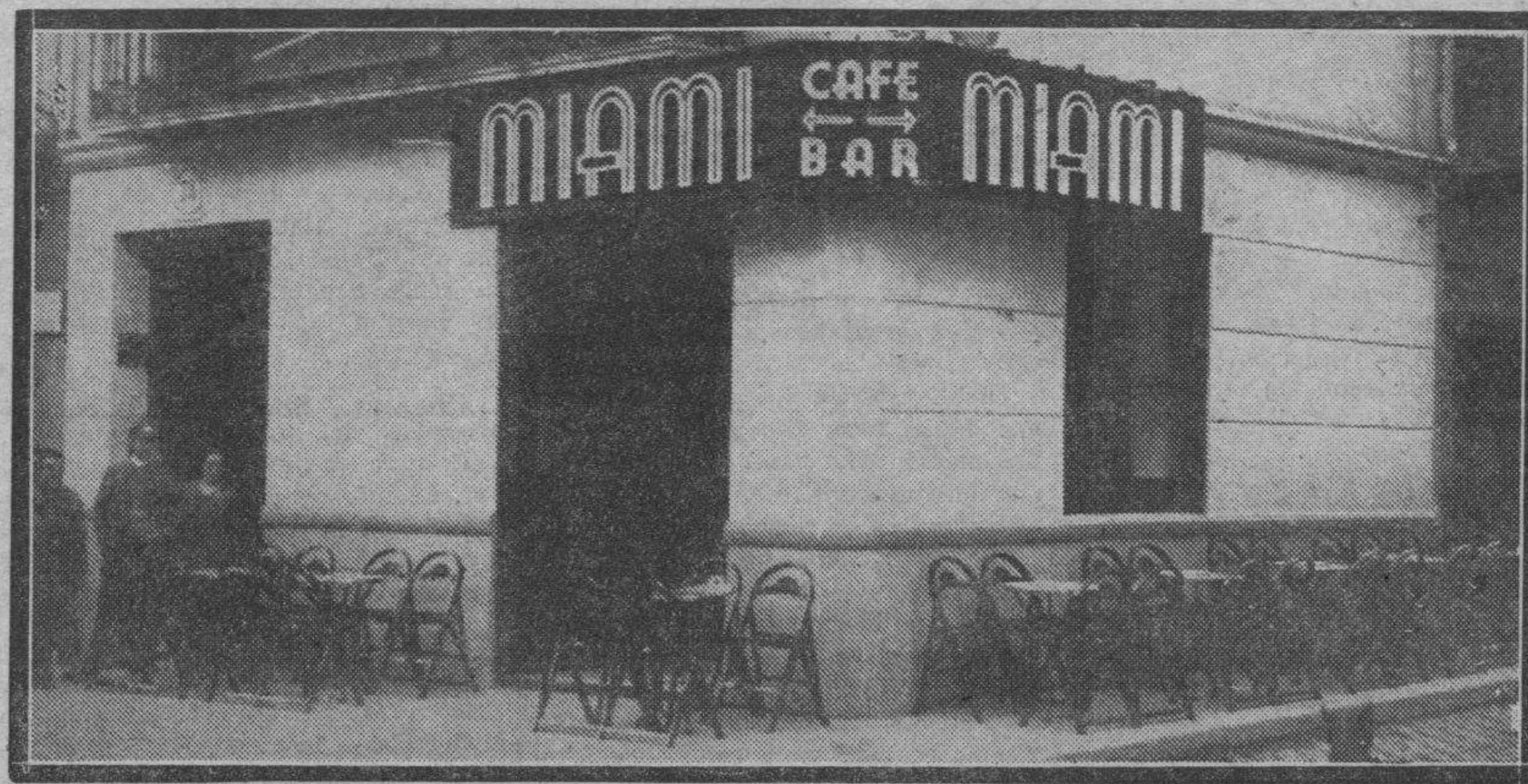
Un aspecto de la artística portada del nuevo café-bar Miami, que ayer se inauguró.