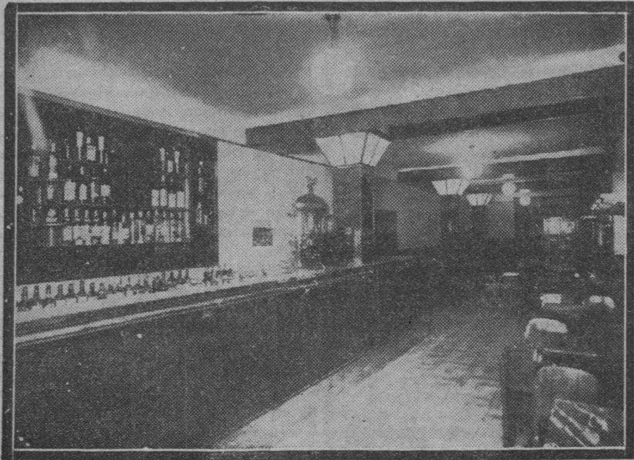
En sus salones resaltan las instalaciones, destacando el bar con su moderno mostrador.