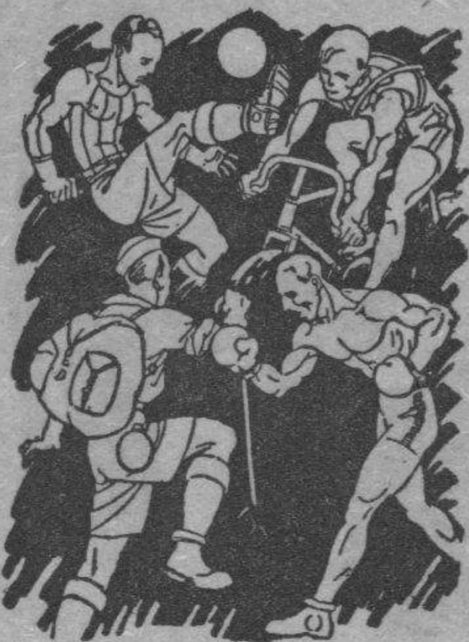
Indispensable para toda clase de sports. No ocupa sitio ni es frágil