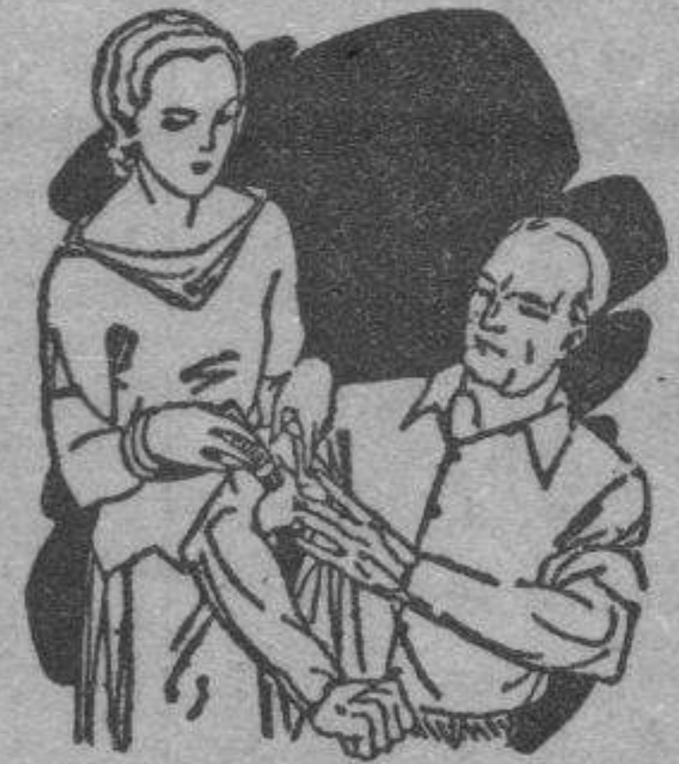
Dolor en las articulaciones Calambres

No ocupa sitio Descongestiona sin irritar No ensucia No tiene mal olor