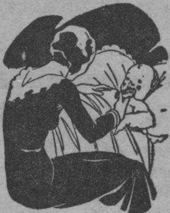
Tos - Catarros - Bronquitis Congestiones