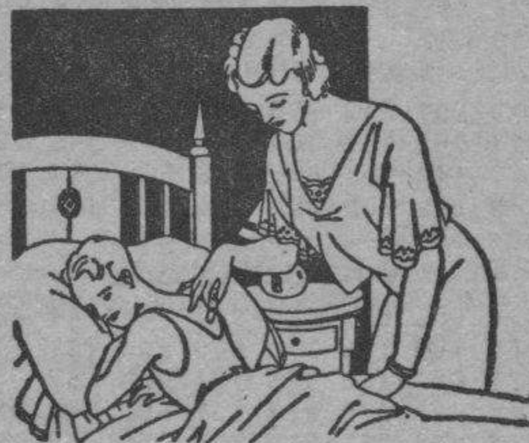
Resfriados - Asma - Pleuresias Congestión pulmonar