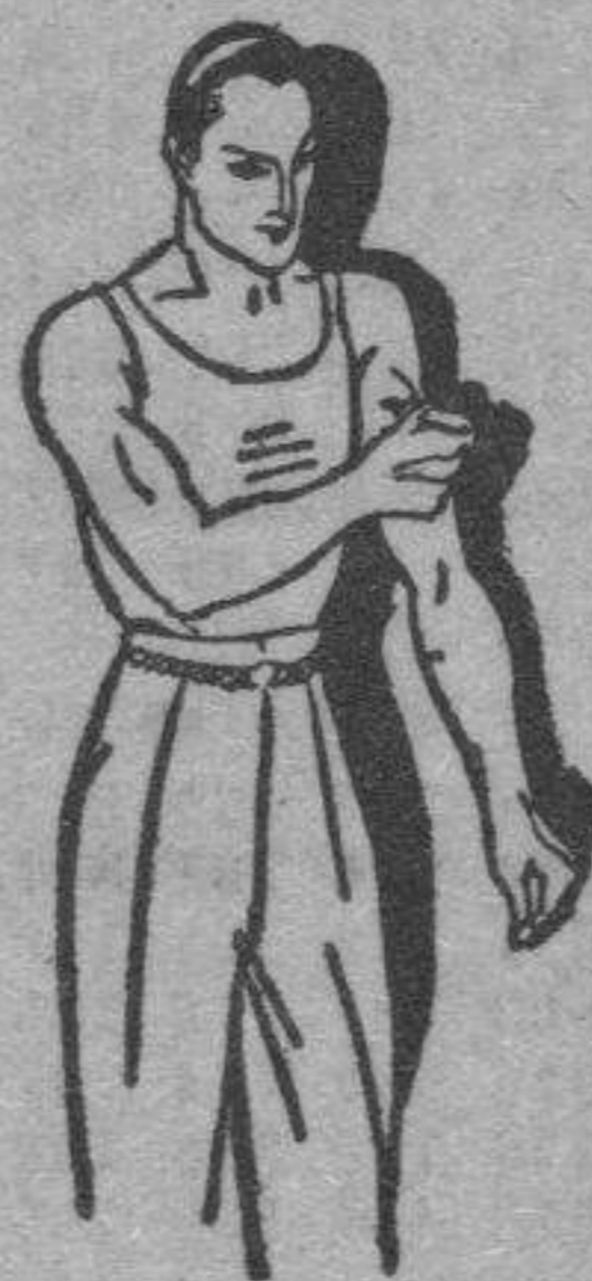
Fatiga muscular Golpes-Torceduras