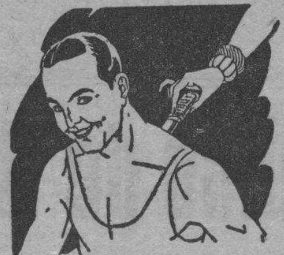
Rigidez del cuello Torticollis