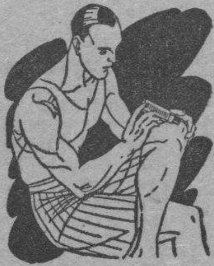
Reuma - Clática Golpes

Preparado en forma de una barrita de facilísimo empleo. Se aplica rápidamente tal como se presenta y sin tener que ensuciar-se las manos.