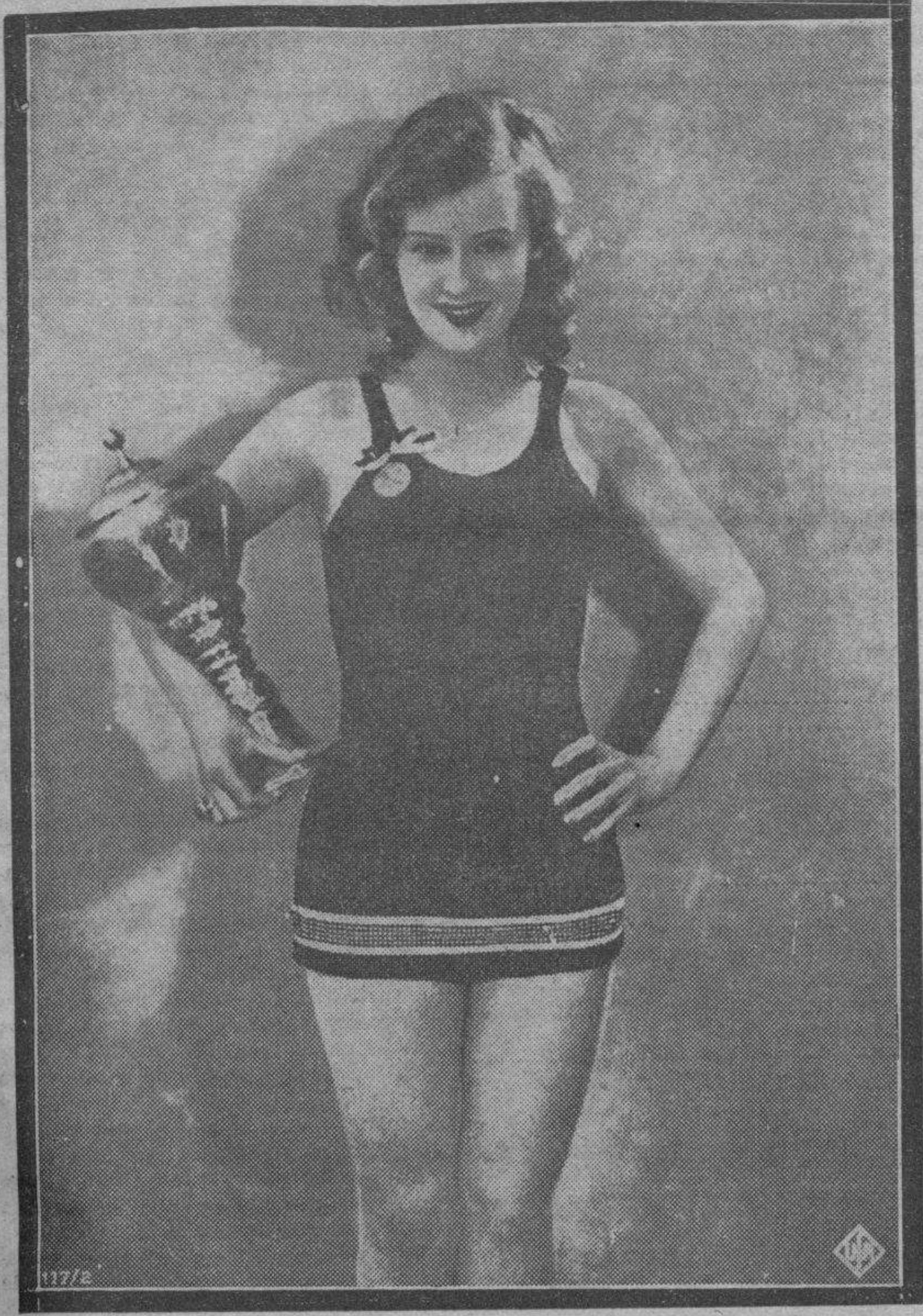
Es para no creerlo. Este verano va a dejarnos un sudoroso y angustiado recuerdo. Dicen los meteorólogos que se va, y su docta afirmación araña nuestra duda de forma alarmante, pero por si aciertan disponámonos a decirle adiós a la estampa estival reencarnada—estupendamente, ¿no?—en la dinámica Lilian Harvey. "La fuga del verano". ¡Bah! Hace bien. Nosotros haríamos lo mismo.