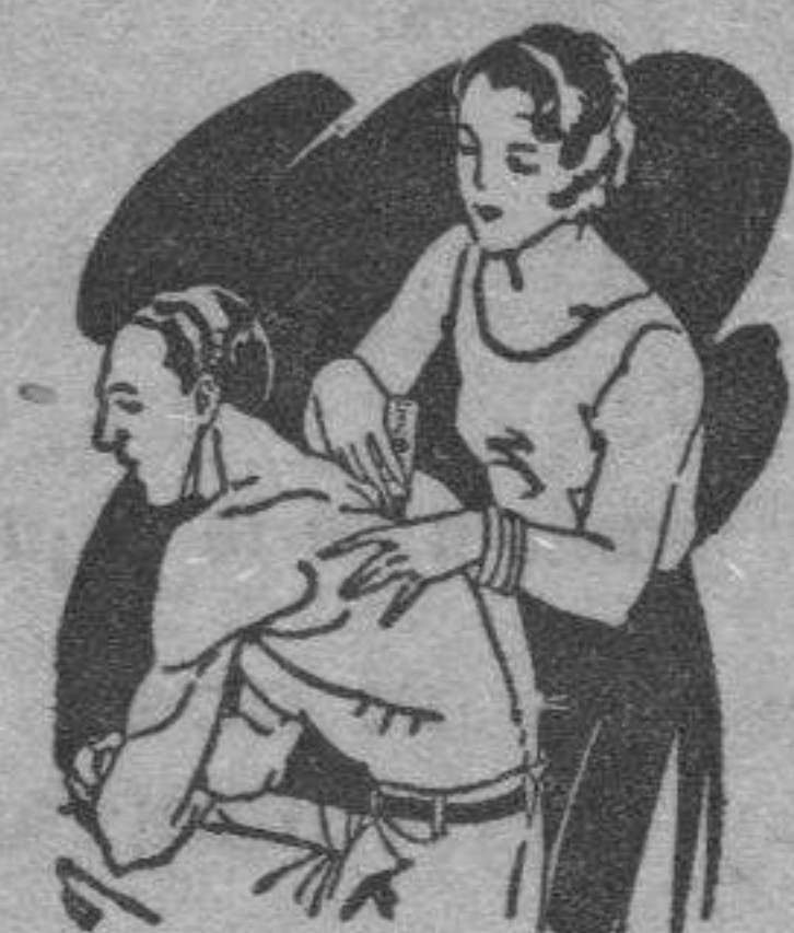
Artrítismo Dolores de muñeca y brazos Dolores de espalda y riñones

El LAPIZ TERMOSAN se vende en todas las Farmacias y Centros de Específicos a 4'45 pts. el tubo grande, y a 3 pts. el tubo pequeño (Timbres incluidos)