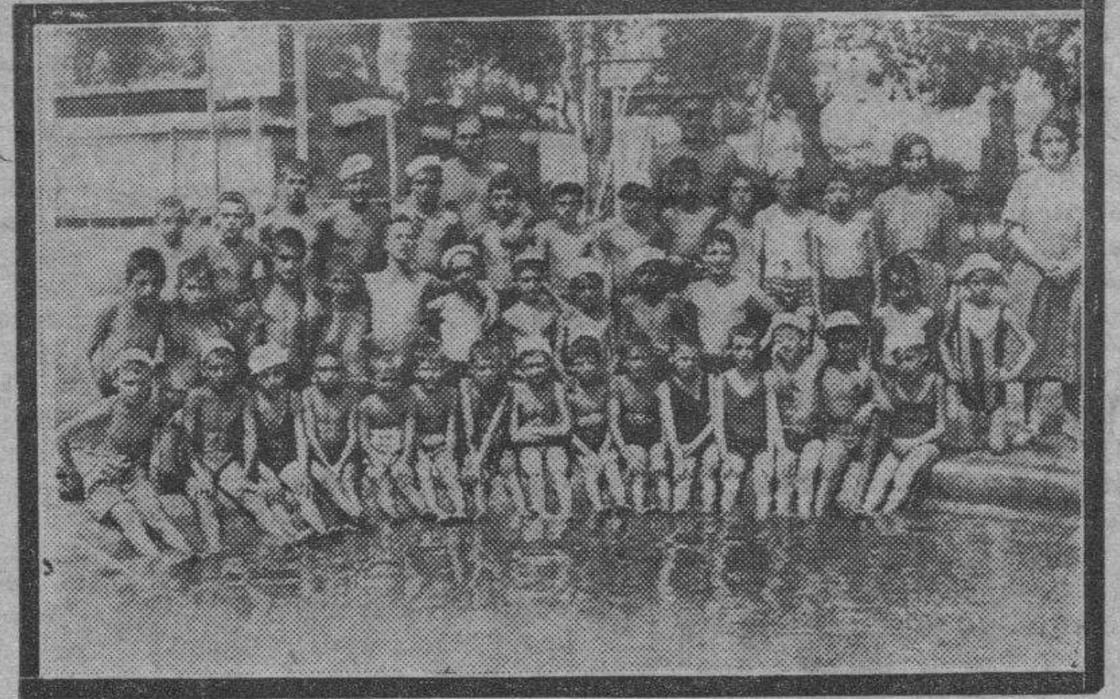
La colonia infantil que mitiga los rigores de la cantícula en “Helios” posa alrededor de la piscina.