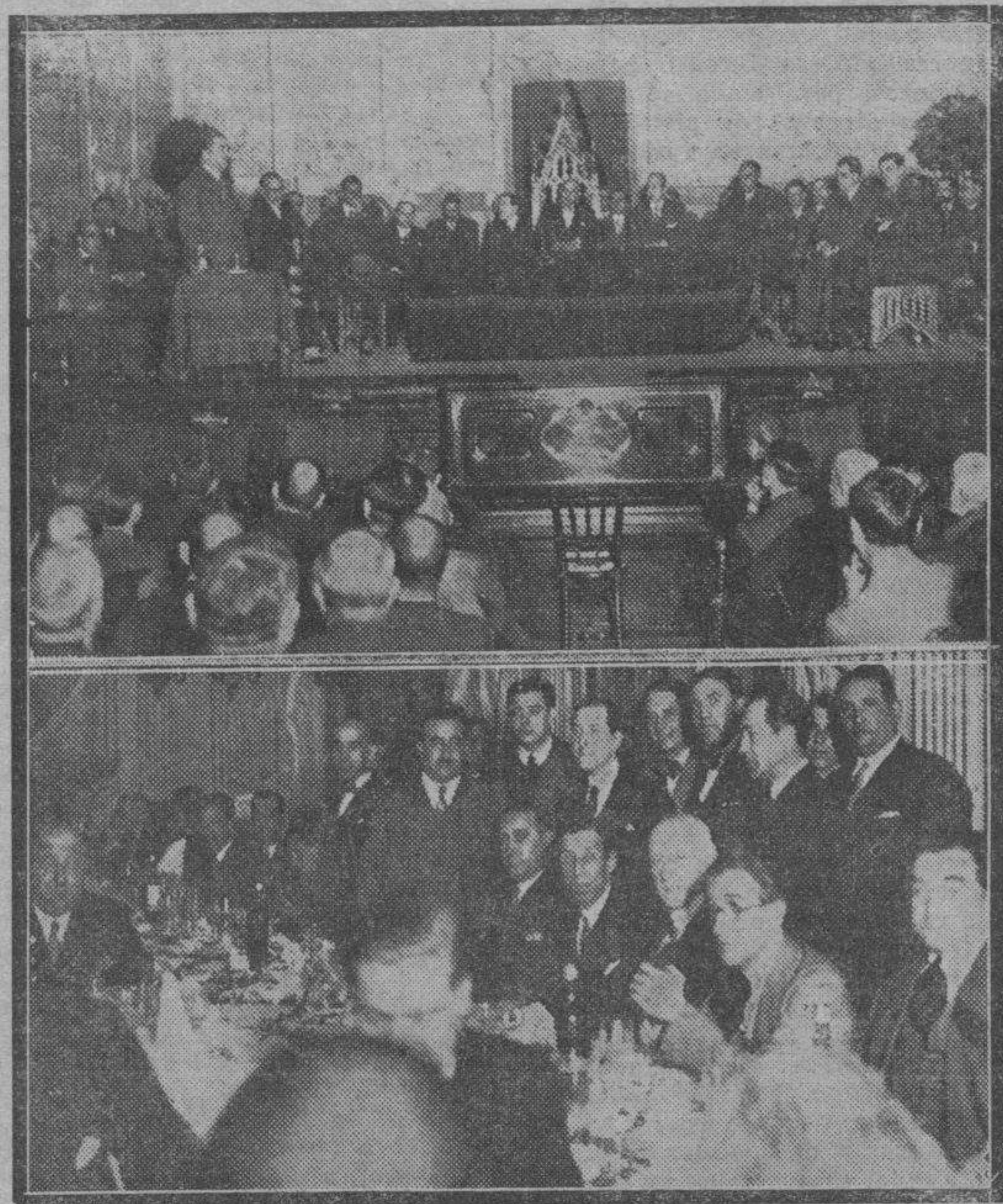
Arriba: La presidencia del acto organizado en el teatro Principal por las Asociaciones de Funcionarios de Administración local y el conferenciante, señor Salazar Alonso, en el uso de la palabra. Abajo: Presidencia del banquete con que se obsequió al señor Salazar en el Centro Mercantil. En la fotografía, el nuevo gobernador de Madrid, don Mariano Joven, que hizo acto de presencia en el banquete.

Refiriéndose al problema del secretariado, dice que en los Congresos y Asambleas a que ha asistido en los últimos años se ha propugnado por que el arranque de mejoras solicitadas fuera a base de la exigencia y reconocimiento de tres factores: capacitación, permanencia o seguridad