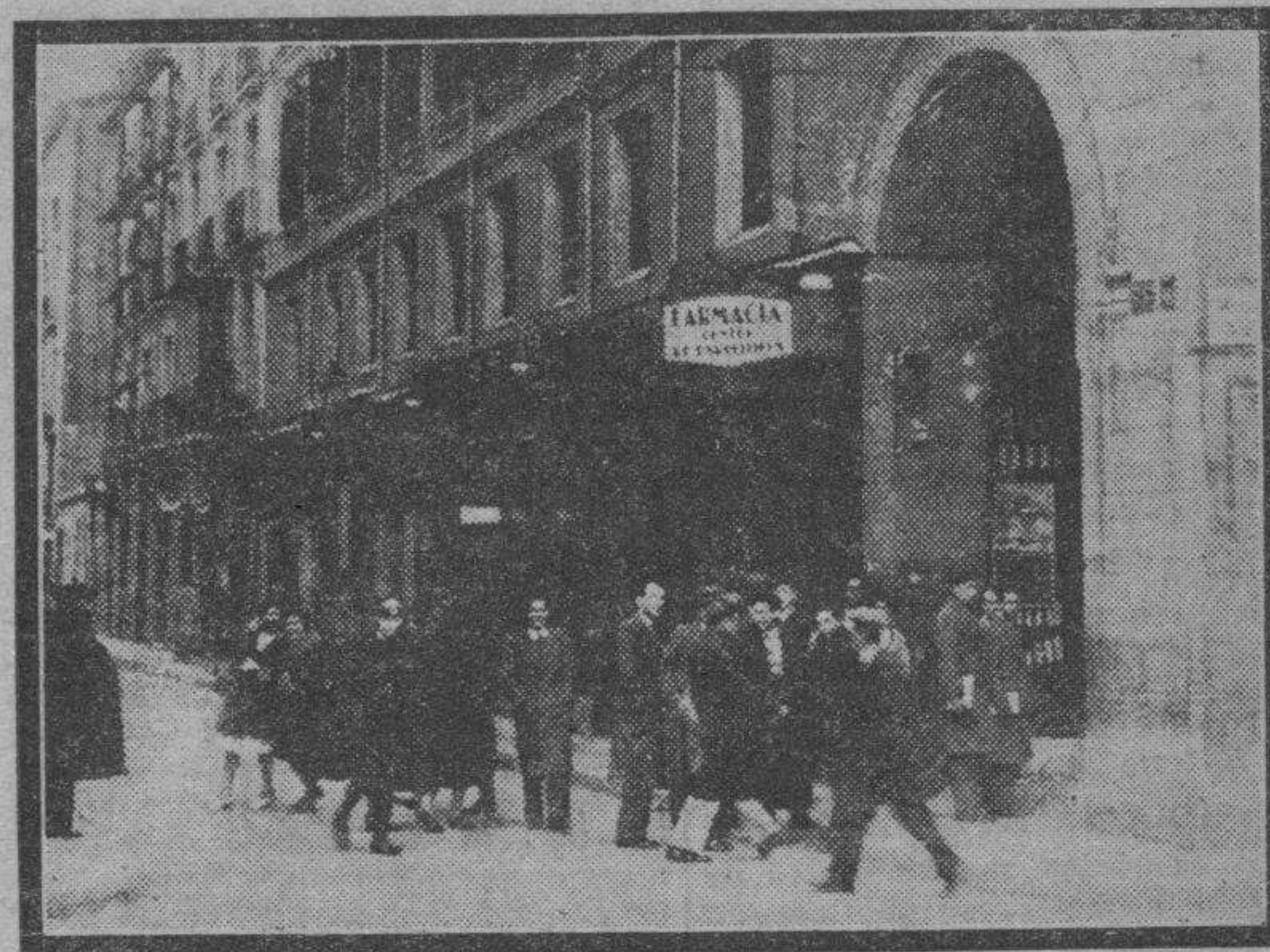
Entrada de la calle de Cinco Marzo, lugar donde el domingo ocurrió el tiroteo entre la policía y un grupo de sospechosos.