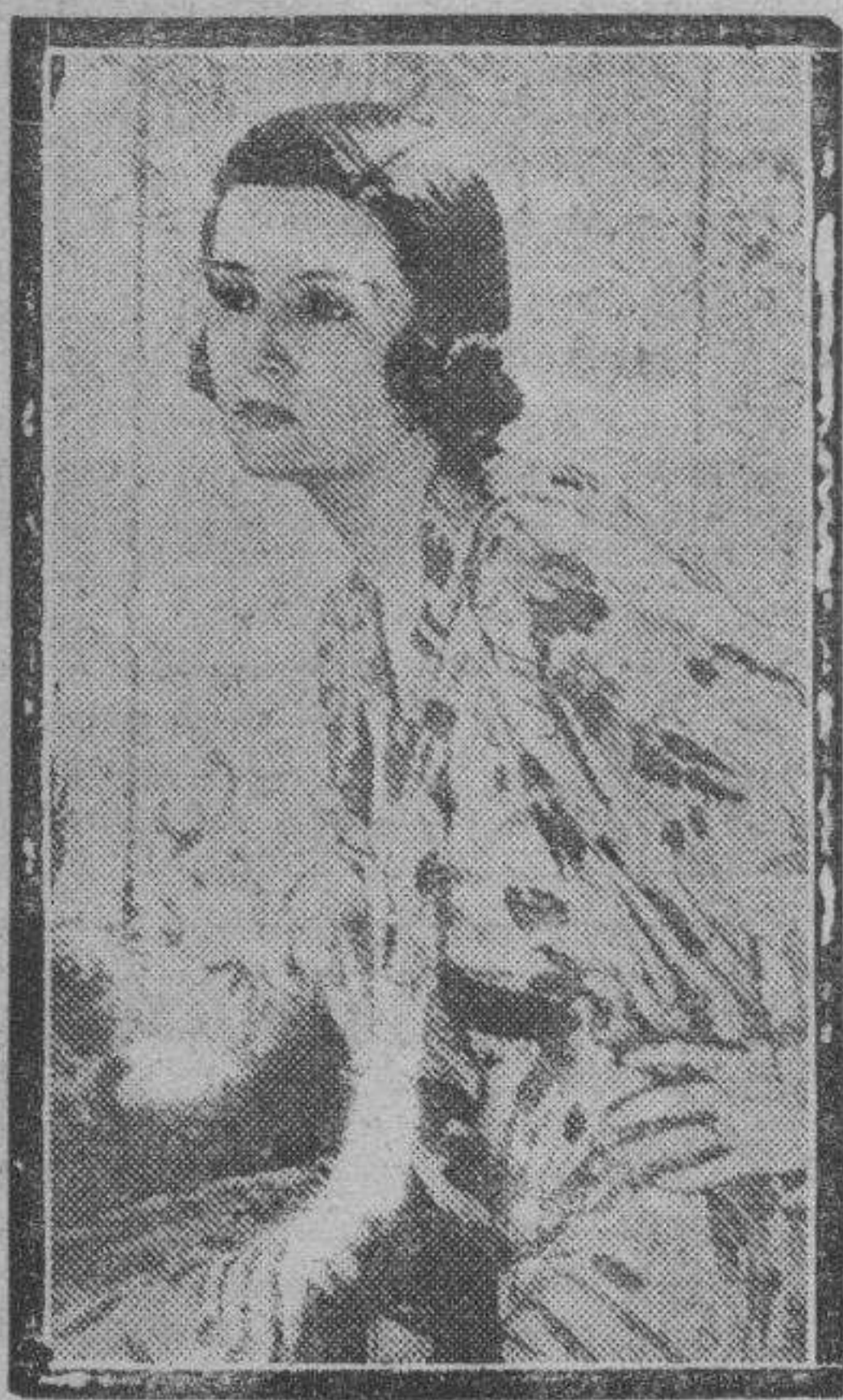
"Ensemble" chic realizado en muselina, fondo crema con motivos de flores y hojas estampadas en azul y verde. El vestido es de estilo muy sencillo y el cinturón es de terciopelo verde. La chaqueta se adorna de una pelerina y un cuello echarpe anudado delante.