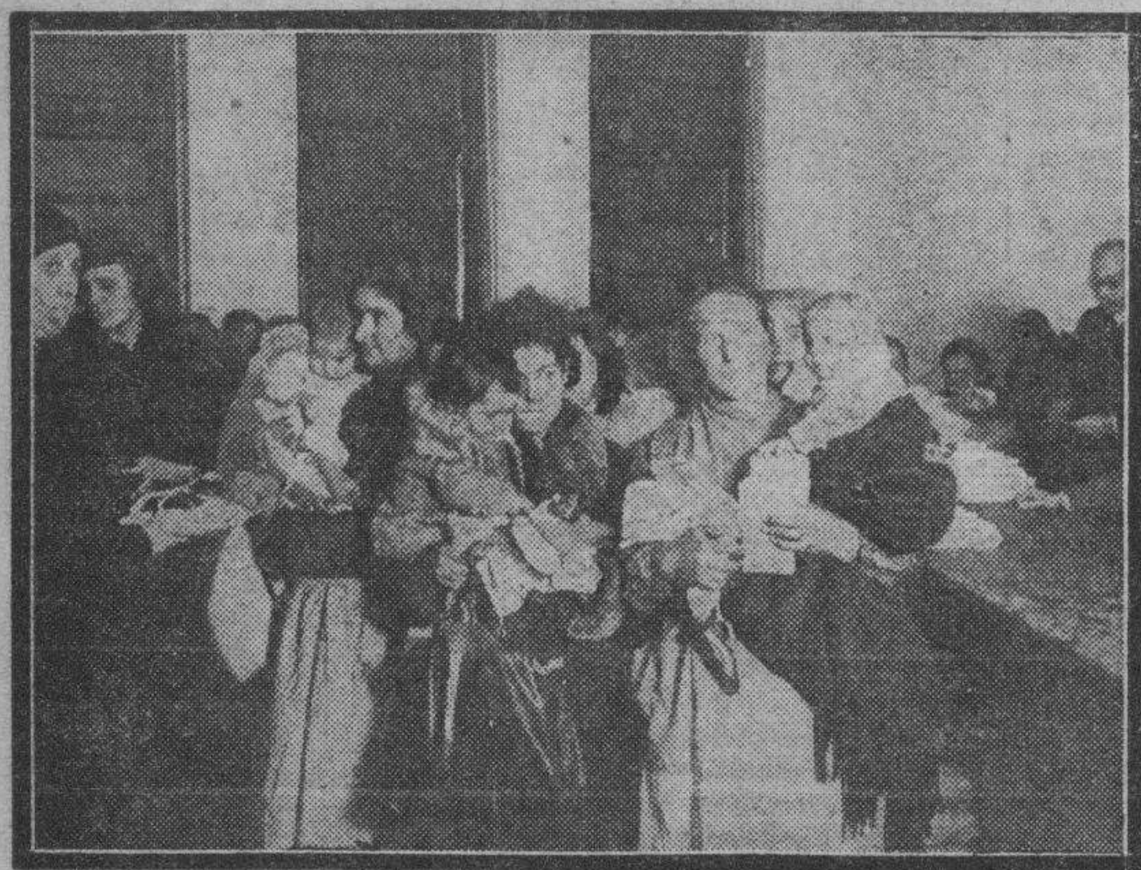
Los momentos del reparto de ropas y obsequios a los niños del Refugio, acto que revistió la máxima solemnidad.