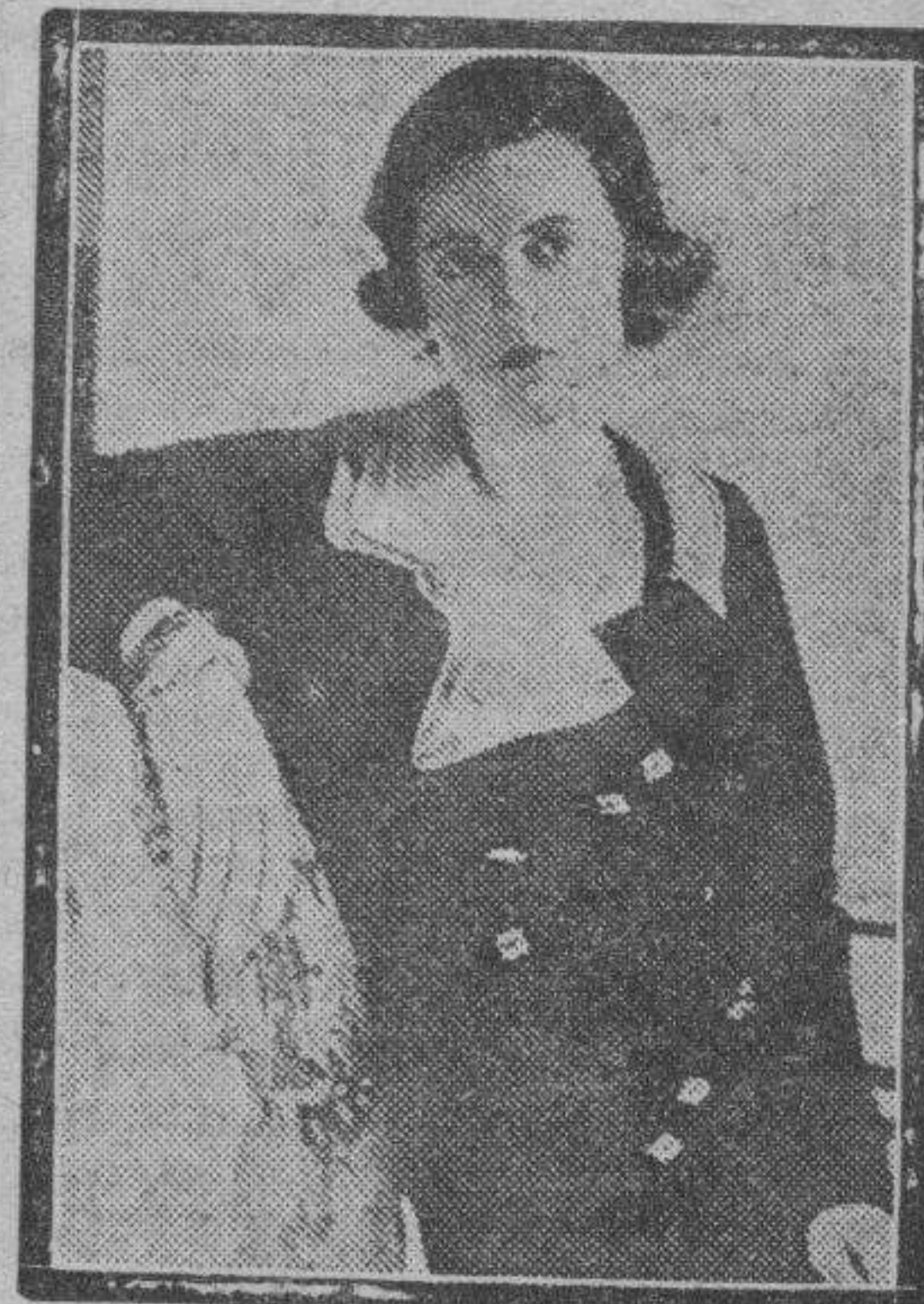
De gran simplicidad es este vestido de crepé marocain azul marino. El corsaje tiene un descote asimétrico realizado por un cuello triple de organdí blanco. El cinturón del mismo género drapea el talle y se cierra en un moño atrás. Botones de acero completan su adorno.

Los cinturones permanecen y son indispensables en los trajes de mañana y para todo andar, lo mismo que en los abrigos; desde el momento que se quiere dar al traje una nota de más fantasía, desaparece el cinturón y queda la línea "souple" y suave, sin indicación del talle, a no ser en el corte estudiado e ingenio del traje.