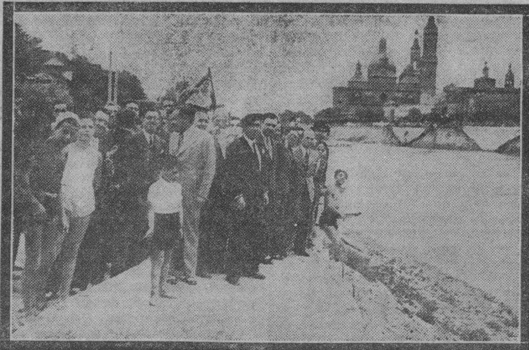
El alcalde y varios concejales rodeados de los entusiastas directivos de "Helios", en la visita que efectuaron el domingo al Centro Naturista.