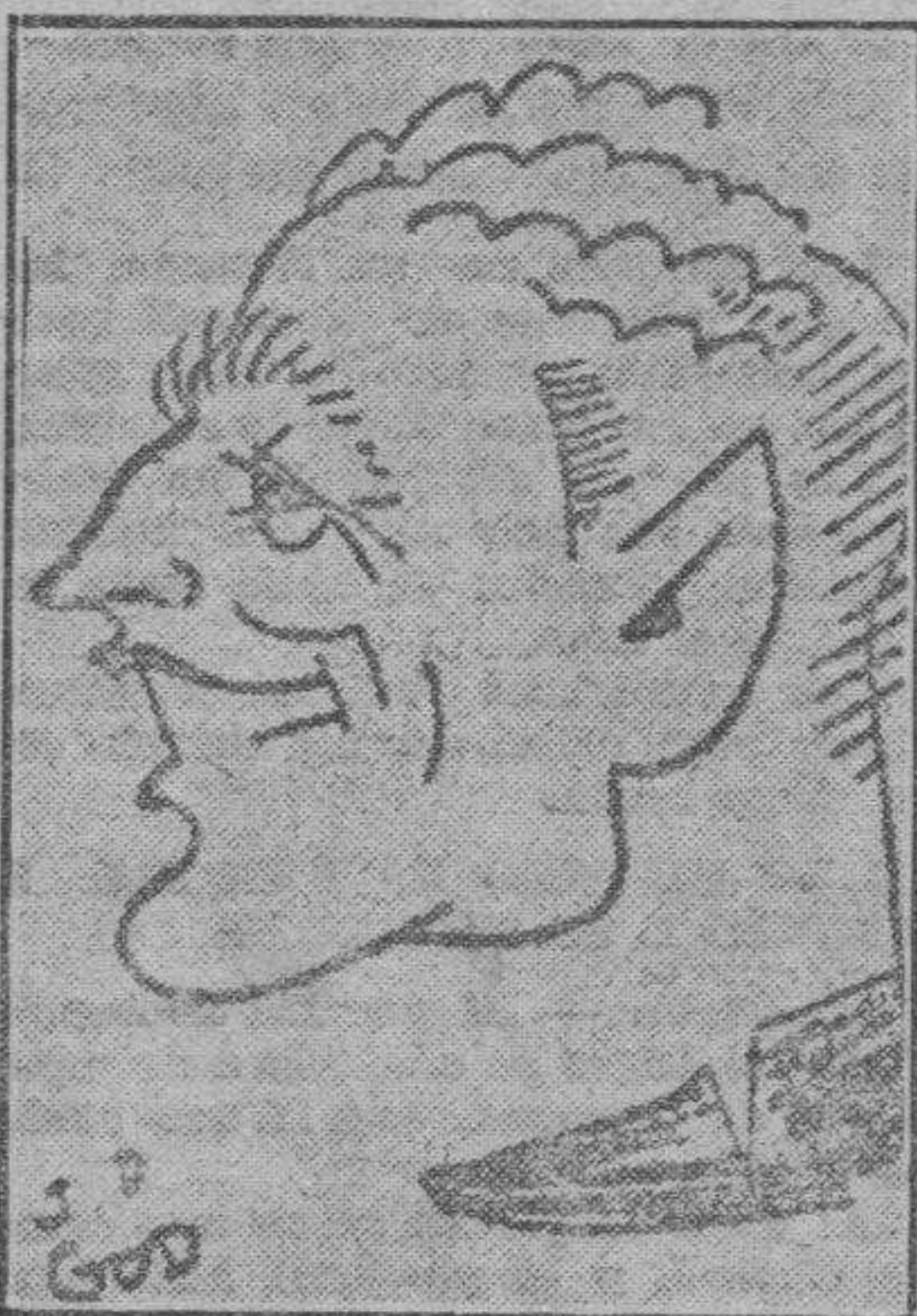
Leducq, el gran corredor ciclista francés, actual detentor del "maillot" amarillo en la clásica Vuelta a Francia.