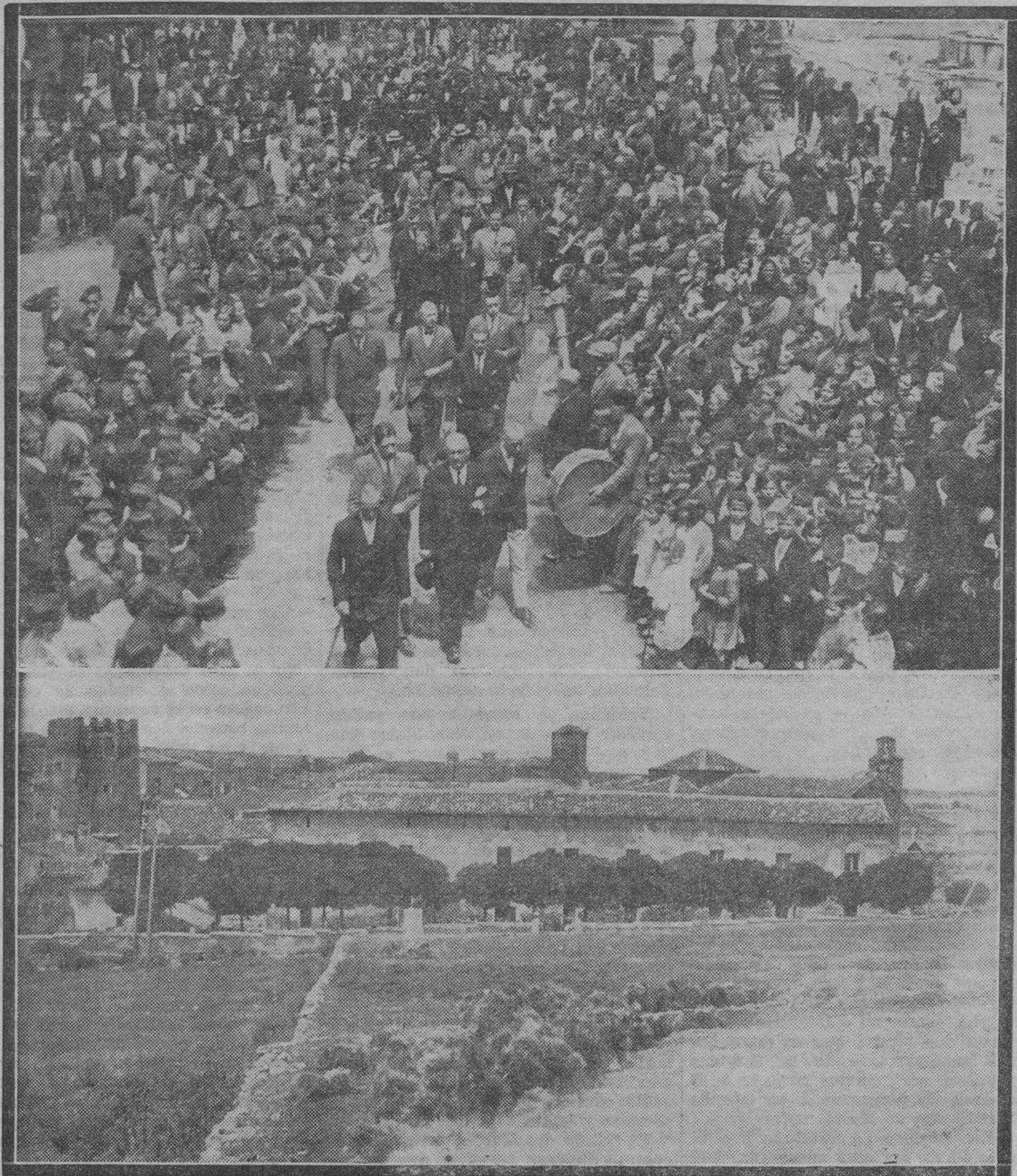
Arriba: El gobernador civil y las representaciones zaragozanas a su llegada a Agreda. Abajo: Una vista de la residencia de las colonias.

Como se tenía anunciado, el domingo se celebró con gran brillantez la inauguración en Agreda del hermoso edificio que la Diputación adquirió en dicha localidad para destinarlo a colonia veraniega de los niños asilados en el Hospicio provincial.