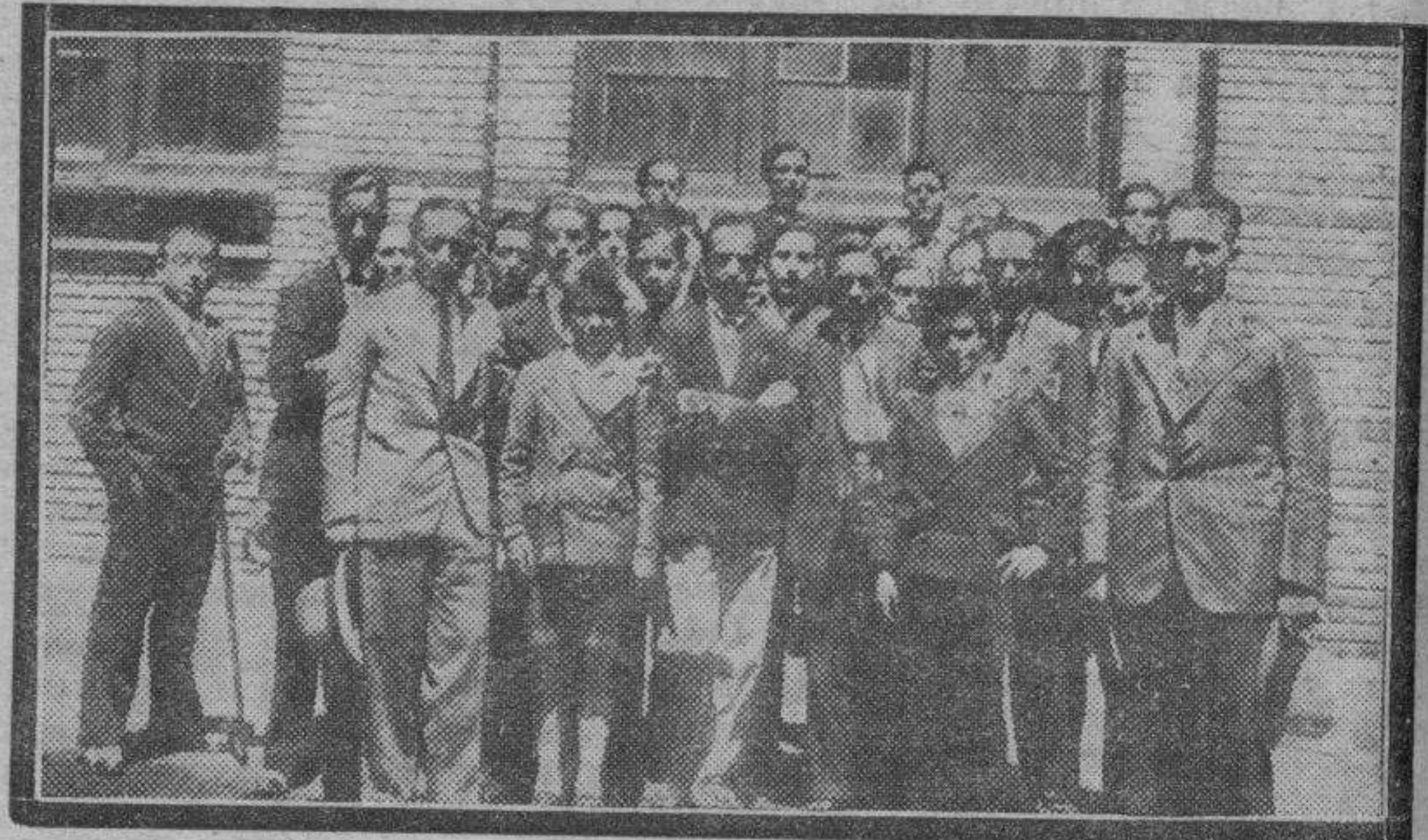
Los profesores y alumnos de la Academia Mercantil de Teruel han realizado un viaje a nuestra ciudad, donde han visitado diversos establecimientos fabriles. En la fotografía aparecen los excursionistas al salir de visitar una fábrica.

Instruyó diligencias el Juzgado municipal para lograr el esclarecimiento del suceso.