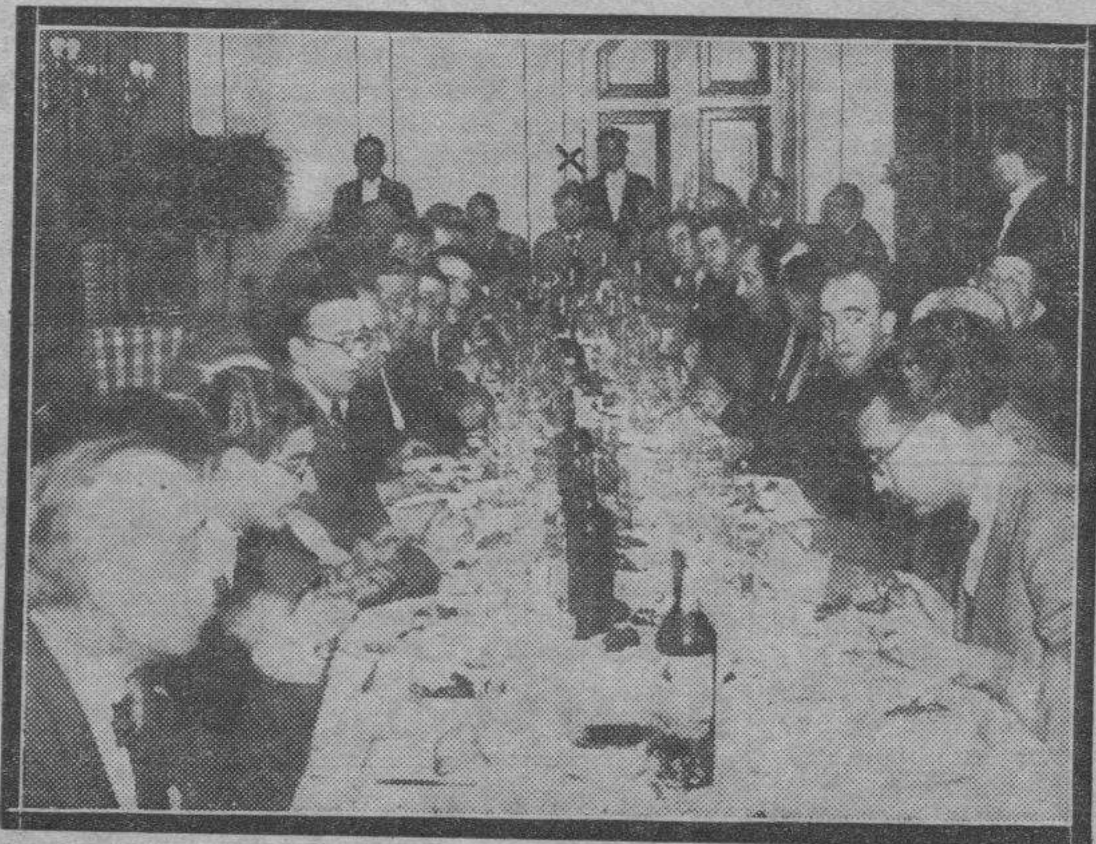
Un aspecto del banquete organizado por un grupo de amigos en honor del escultor Honorio García Condoy, para celebrar su éxito en la Exposición Nacional de Bellas Artes.

Había tratado de suicidarse y para llevar a cabo su fatal intento se arrojó al Canal Imperial de Aragón, por la Almenara del Pilar.