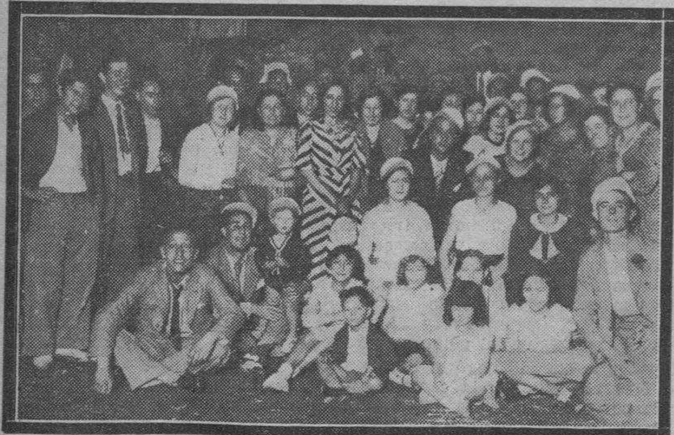
OASPE.—Concurrentes a la verbena de San Pedro, tan magistralmente organizada por la "Peña Zékin".