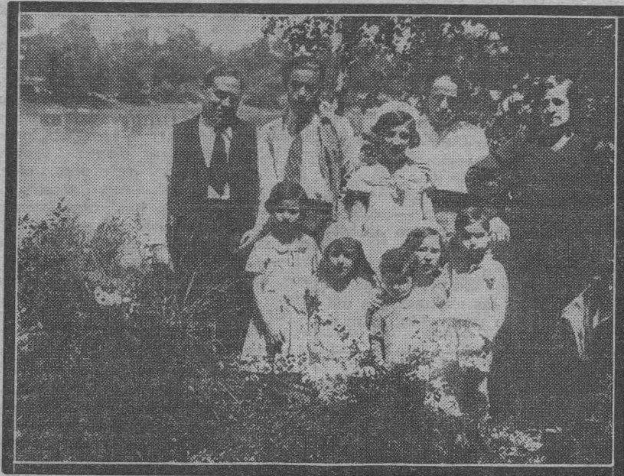
Uno de los numerosos grupos familiares que asistieron el pasado domingo al soto de los pescadores, con motivo de la brillante fiesta celebrada por la simpática Sociedad en tan encantador lugar.

¡Facilidades! ¡Facilidades! No nos cansaremos de repetirlo, sobre todo en época de crisis”.