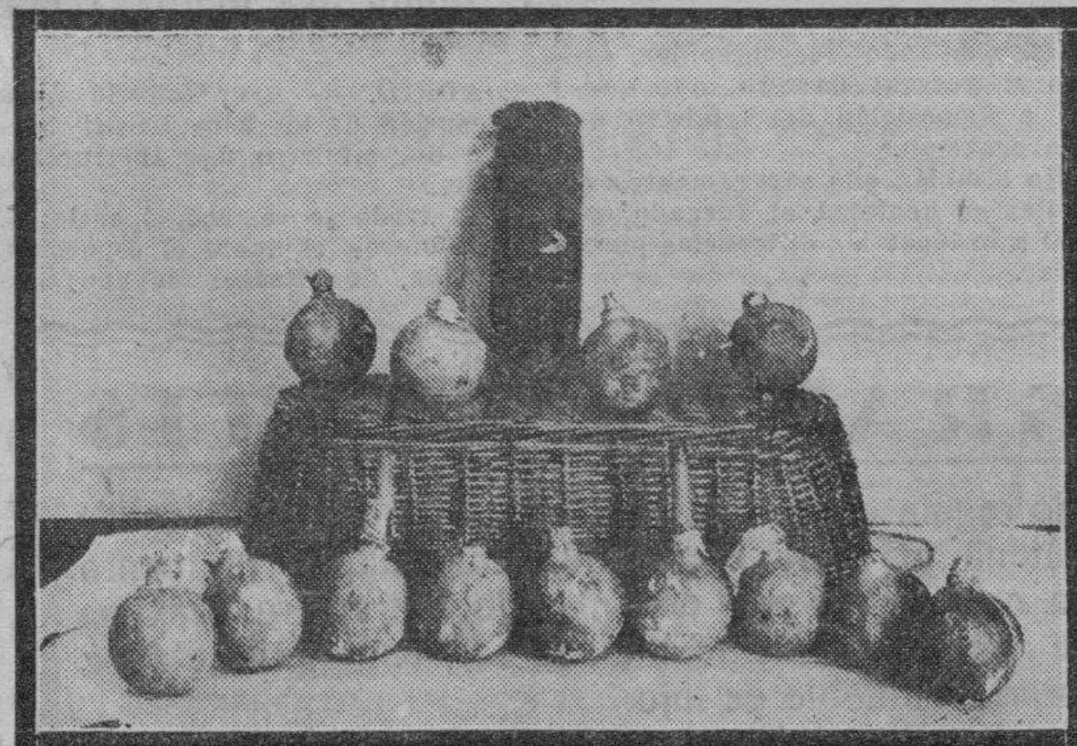
Las catorce bombas halladas por la policía en una cueva de los terrenos próximos a la "torre" de Palomar.