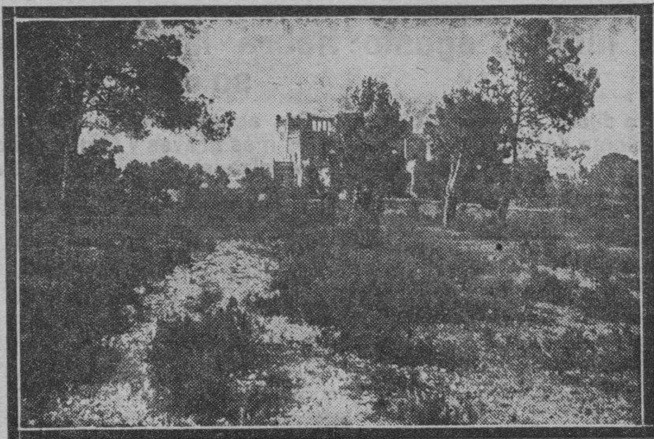
Los terrenos próximos a la "torre" de Palomar, donde ayer encontró la policía las bombas.

Su carga era: dinamita, azúcar y metralla.