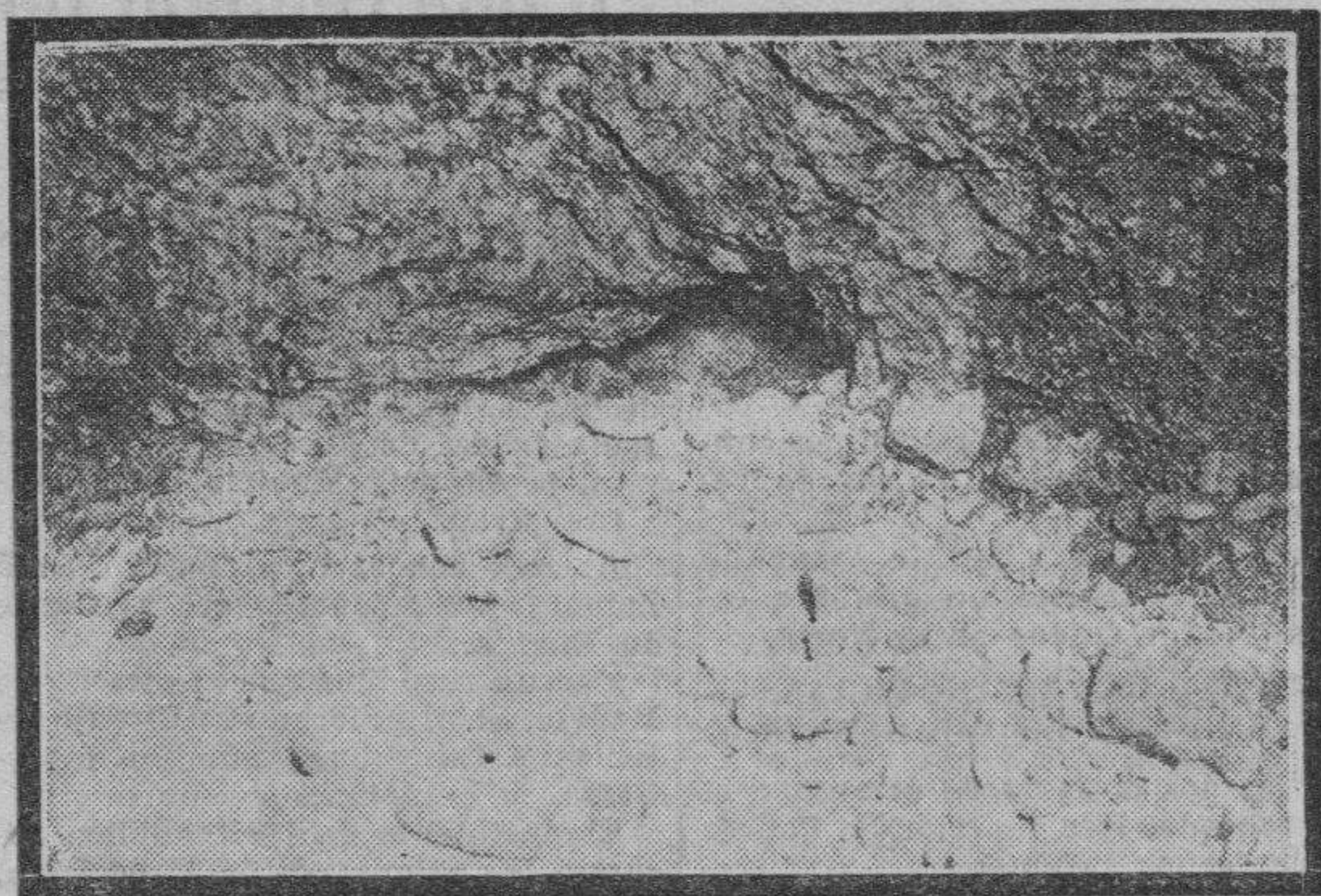
Interior de la cueva donde la policía encontró los explosivos.