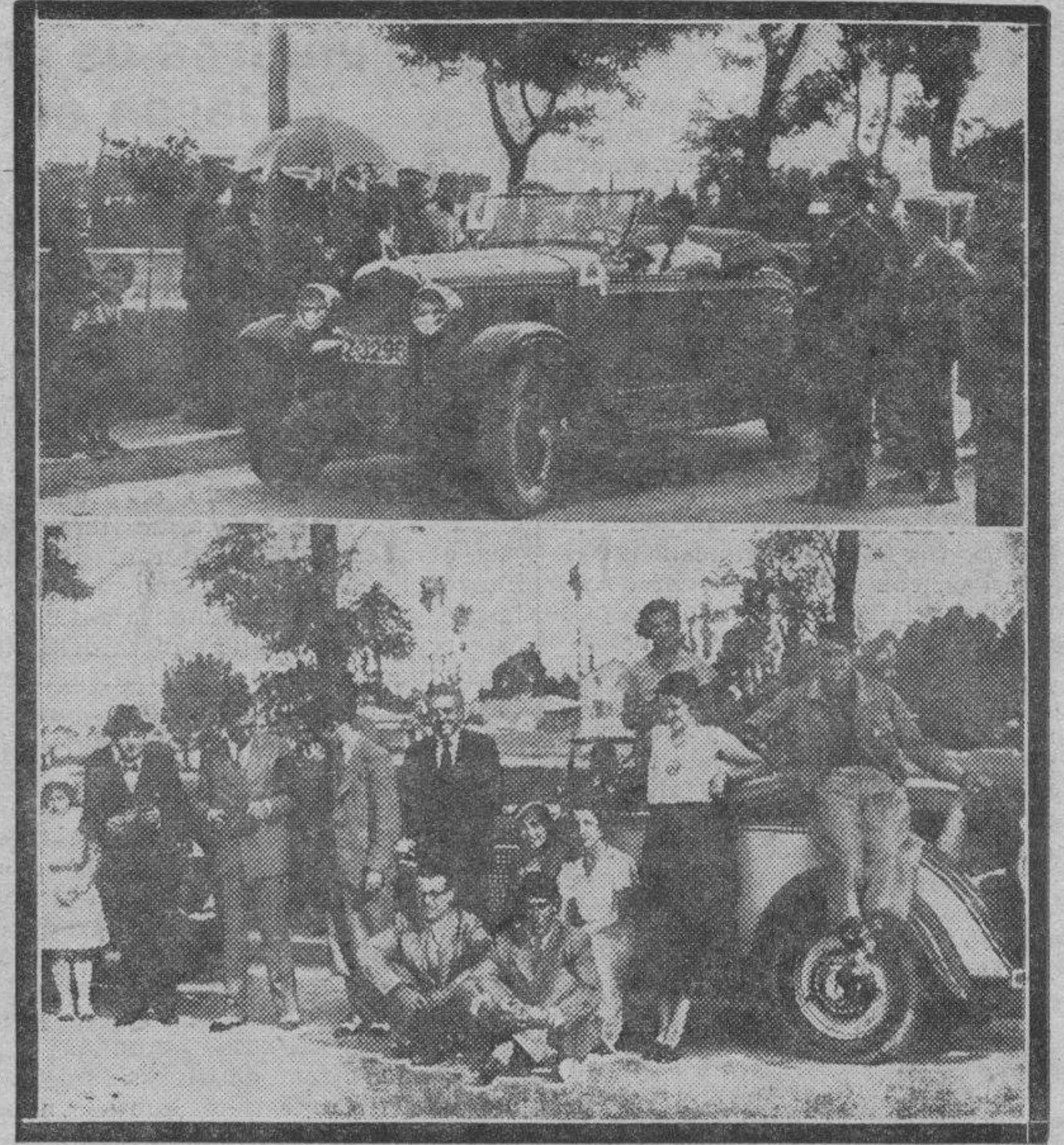
De la carrera de regularidad. — Uno de los coches al tomar la salida, y varios de los participantes en la brillante prueba automovilista.

La Cruz Roja llega también cerrando la carrera, informando del servicio prestado en la misma y de la normalidad con que se ha desarrollado la prueba.