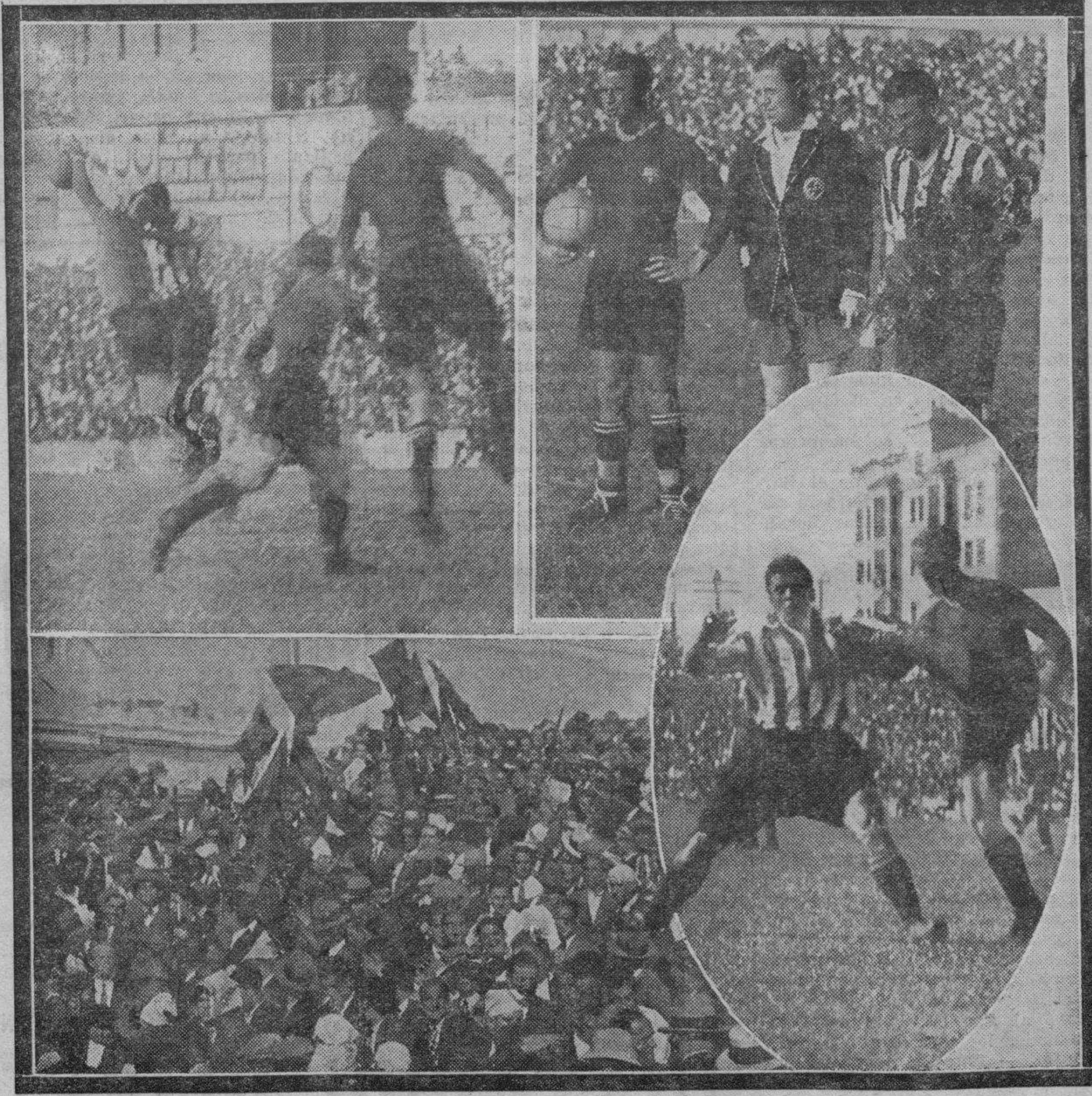
Dos momentos del encuentro: Los capitanes y el árbitro antes de empezar el "match", y un rincón del campo de Chamartín.

El Barcelona juega ahora más pausado y el Athlétic realiza con más fre-