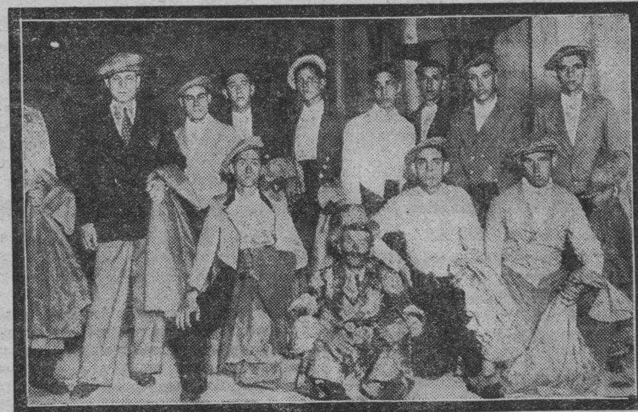
Los diestros, unos improvisados y otros no, que hicieron gala de sus condiciones para eclipsar a las "estrellas" del cielo taurino con varios cornúpetos de la ganadería de Santos, consiguiendo que se entusiasmara la parroquia en varias ocasiones.