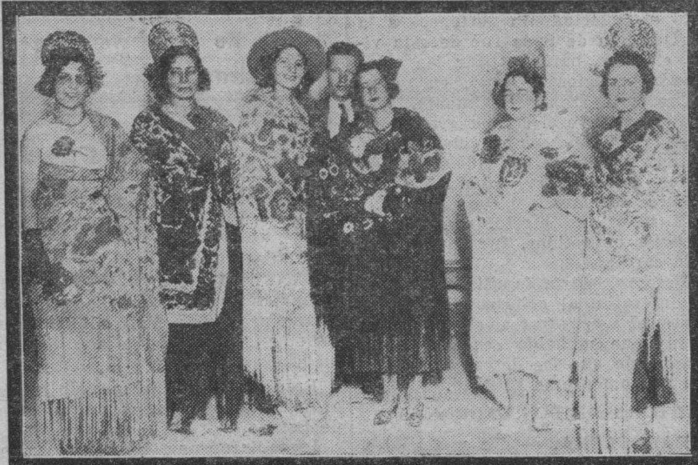
Las seis bellísimas señoritas, de las muchas y guapas que exornan el barrio de Jesús, que anteaayer, por la noche, presidieron la becerrada organizada por la Comisión de Festejos, y que, al decir de los ciudadanos que asistieron a ella, fueron la nota más saliente de la fiesta taurómaca.