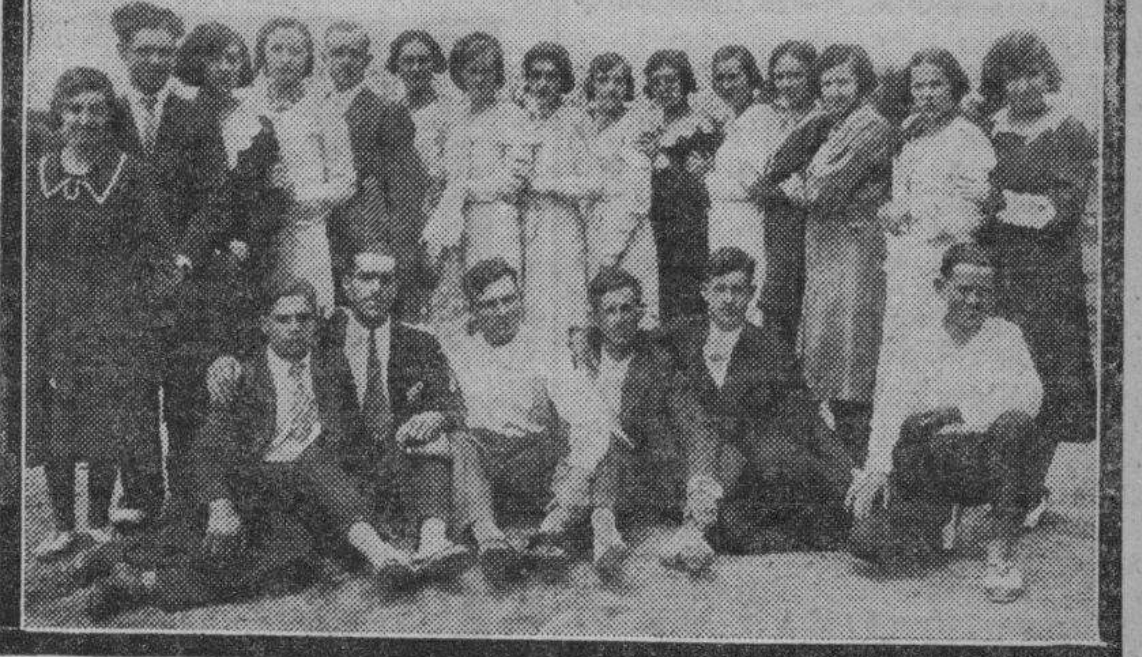
SOBRADEL. — De arriba a abajo: El público saliendo de la solemne festividad religiosa celebrada en la iglesia parroquial en honor del Patrón. Un grupo de muchachos que, con su buen humor, han dado extraordinario aliciente a los festejos. Unas pocas de las guapas señoritas que con su belleza ha constituido la principal atracción de las fiestas de Sobradiel, al decir de propios y extraños.