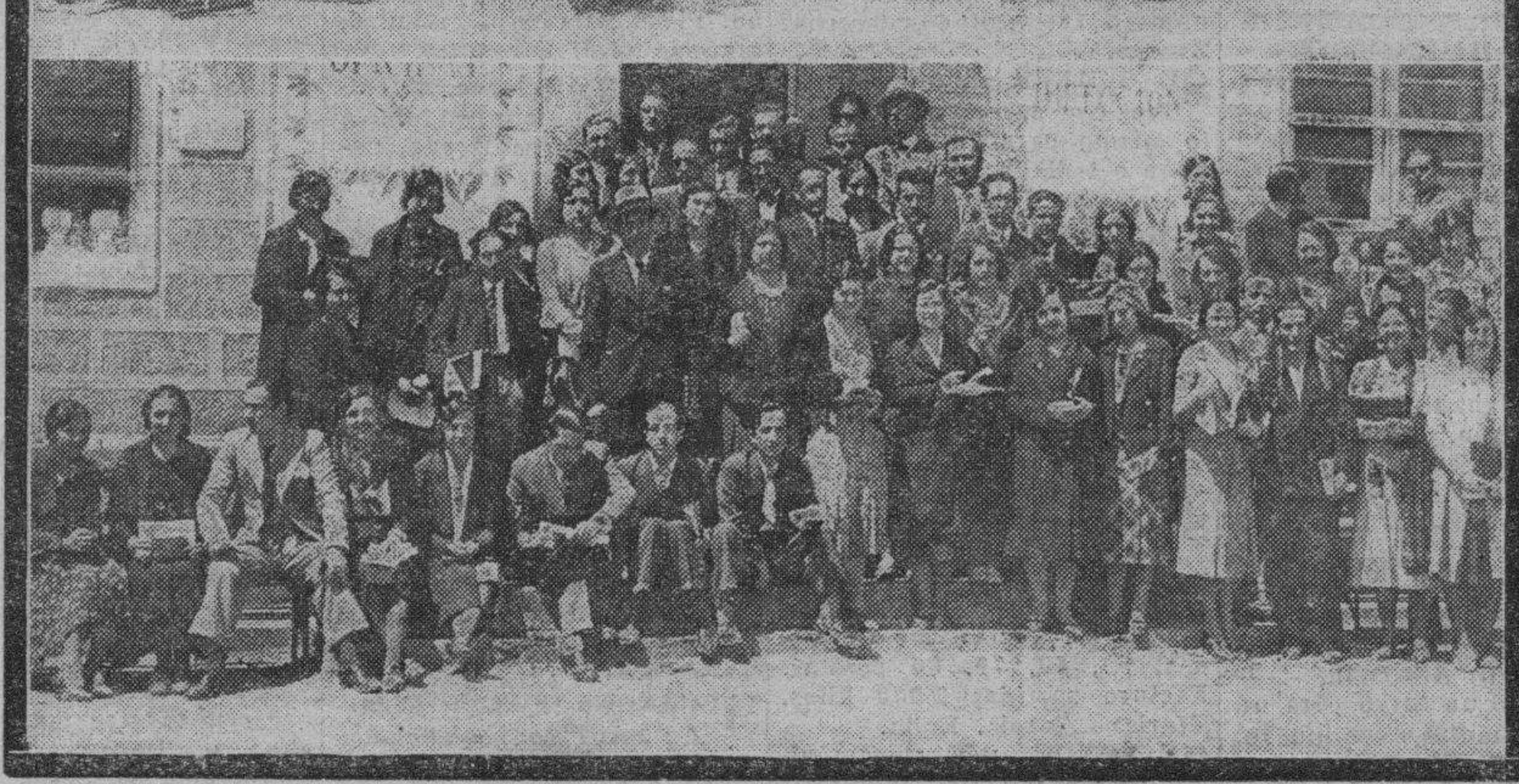
La celebración de los cursillos ha dado ocasión a los alumnos del Magisterio de otras provincias para visitar nuestra ciudad. En el grabado aparecen—de arriba a abajo—alumnos del Magisterio de las Normales de Navarra, Soria y Huesca, fotografiados durante su visita a la Granja Agrícola.

Fué ordenado el reparto de buen número de folletos impresos a los cursillistas, relativos a los diversos servicios que tiene montados la Granja Agrícola de Zaragoza.