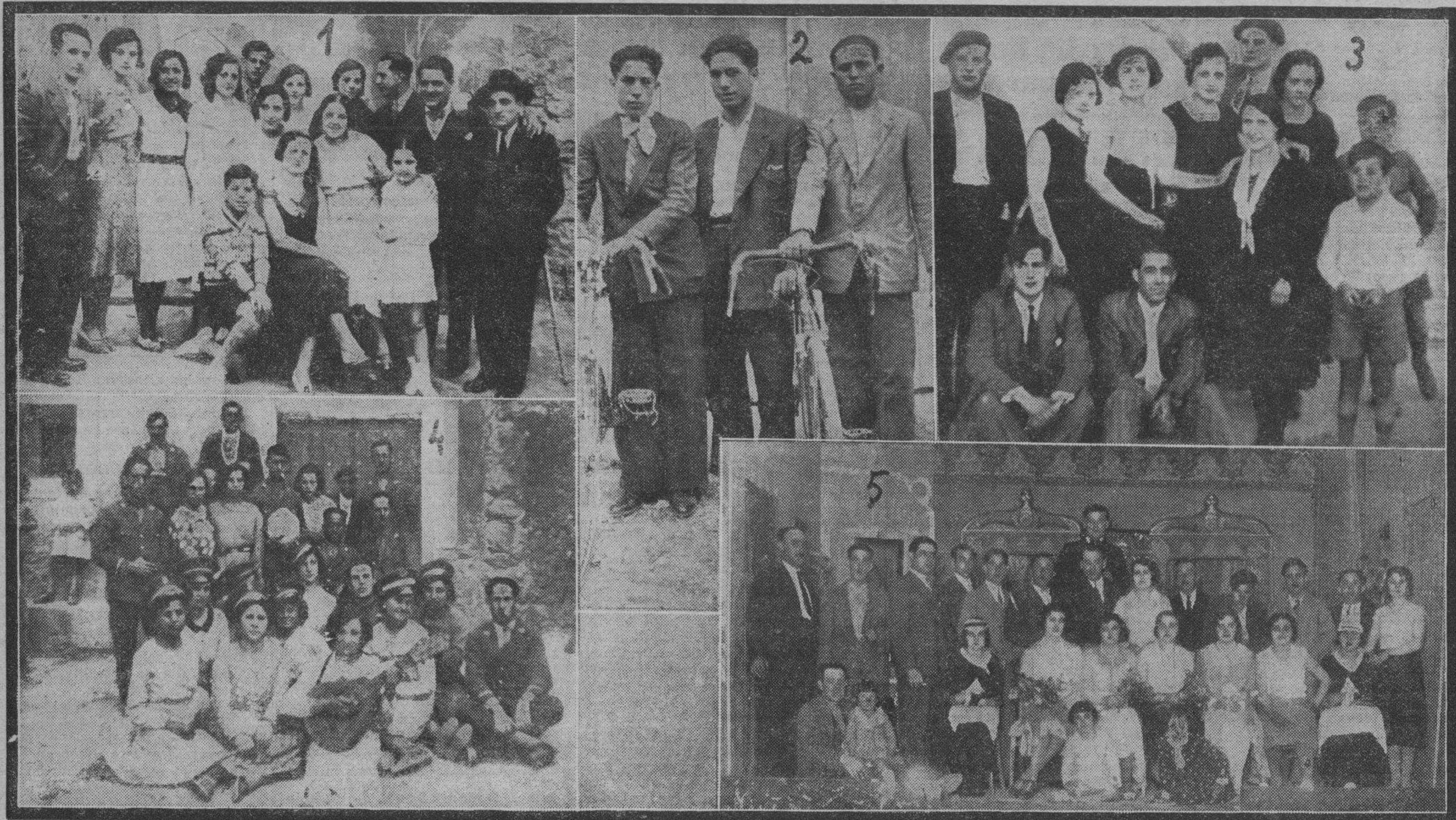
1 y 3: Grupos obtenidos durante las fiestas en Tardienta. 2: Los corredores ciclistas en las fiestas de La Almolda. 4: De las fiestas en Alconchel de Ariza. 5: El cuadro artístico Olímpica, formado por bellas señoritas y distinguidos jóvenes de Arcos de Jalón.