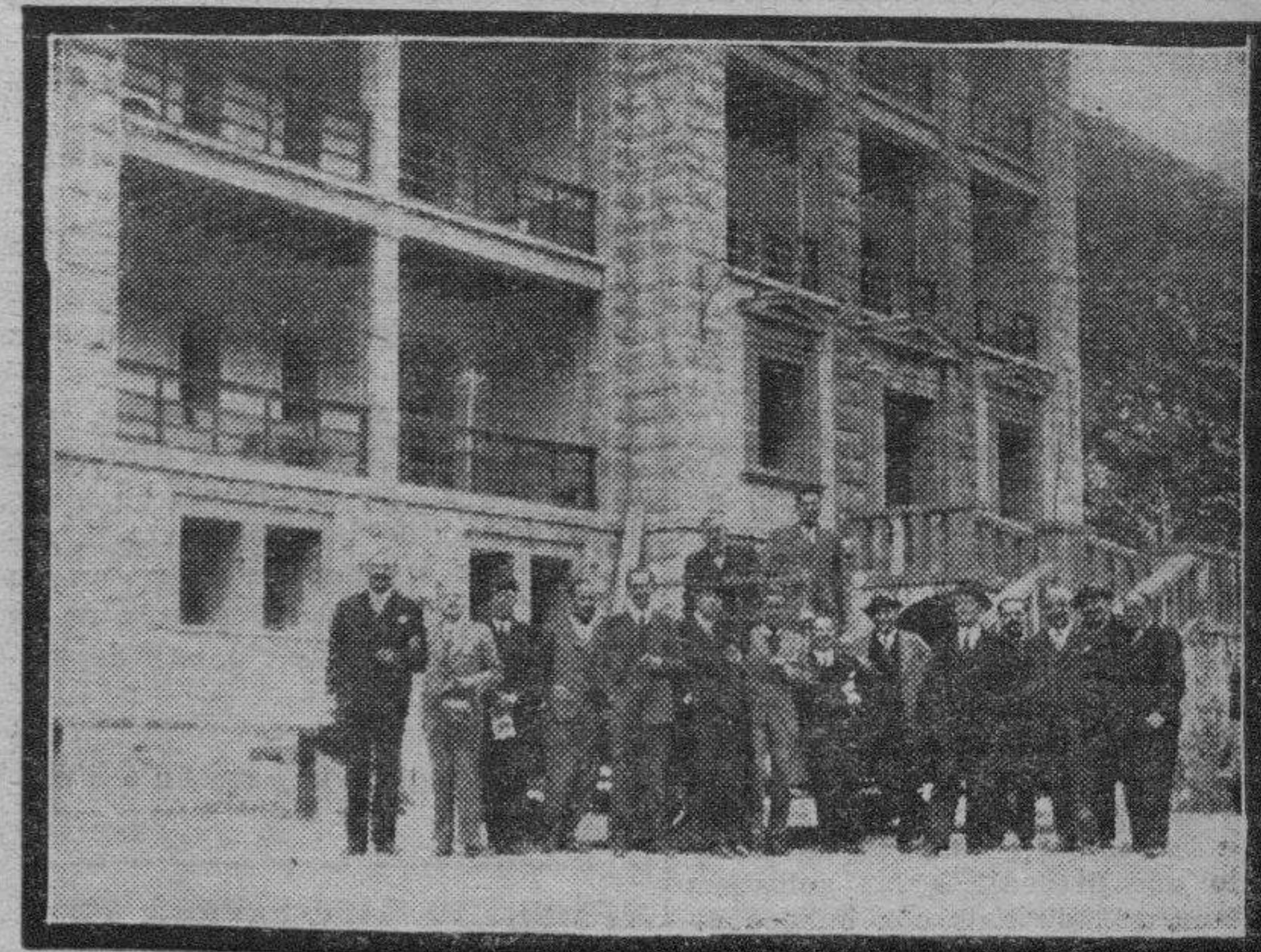
Un grupo de excursionistas.