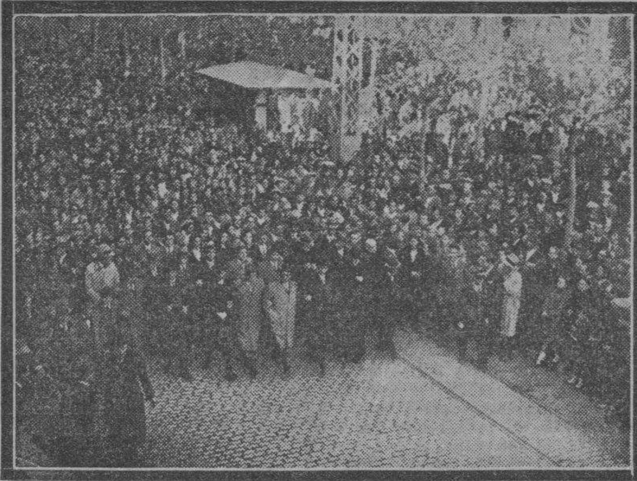
Autoridades y familiares en la presidencia del duelo, al pasar por el paseo de la Independencia.

Si nos pagan con indiferencia obrarán muy mal, y hasta podíamos exigirles una actitud en consonancia con nuestro tesón, para imponerla