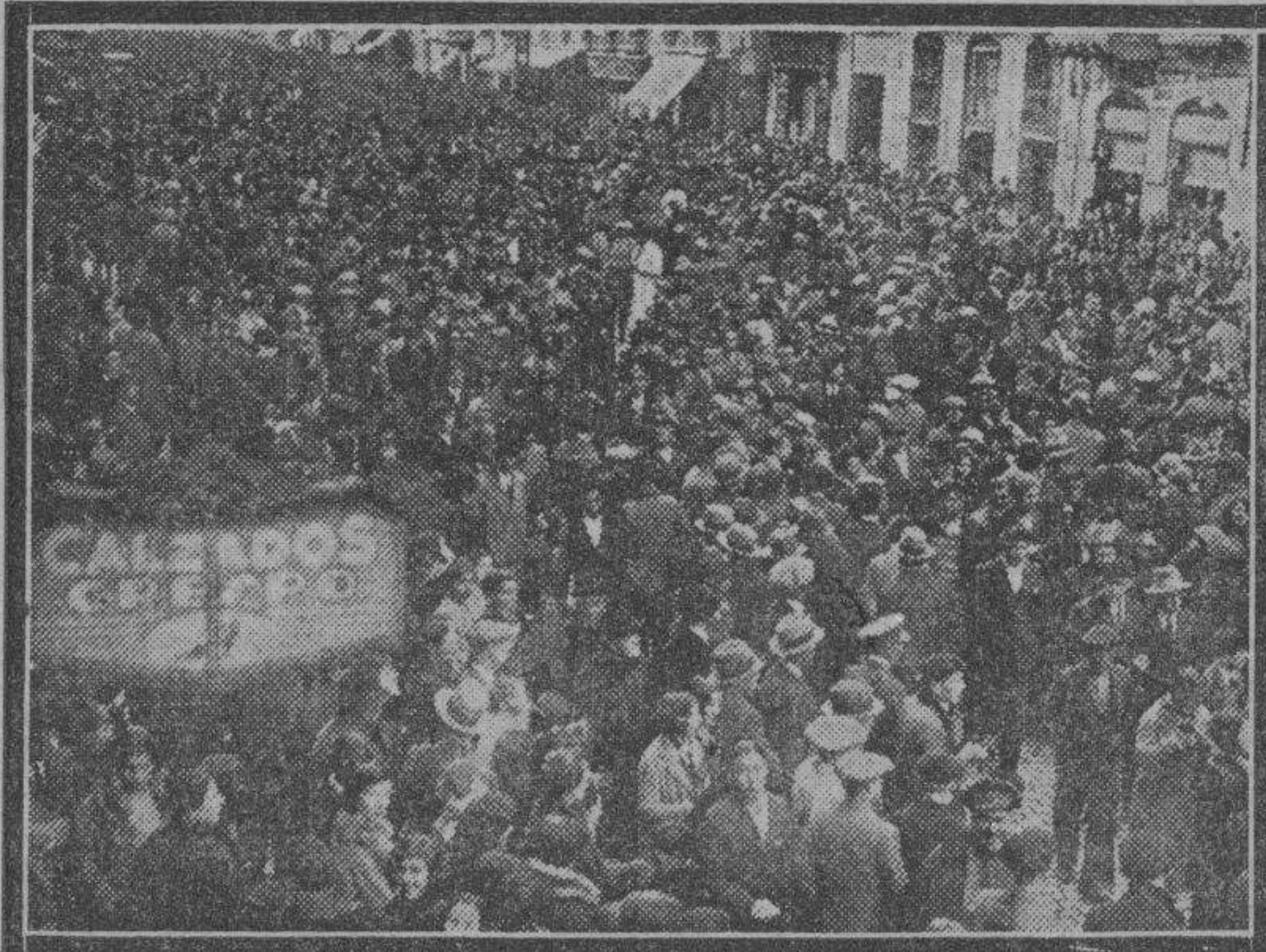
Un aspecto del Coso, en el trayecto de Espartero-Plaza, al pasar el grueso de la manifestación.

Desde las tres y media de la tarde suspendieron el movimiento de coches en todas las líneas. Querían los obreros demostrar que se hallaban sumados a la manifestación luctuosa, de acompañamiento del cadáver, y a la de protesta en su doble