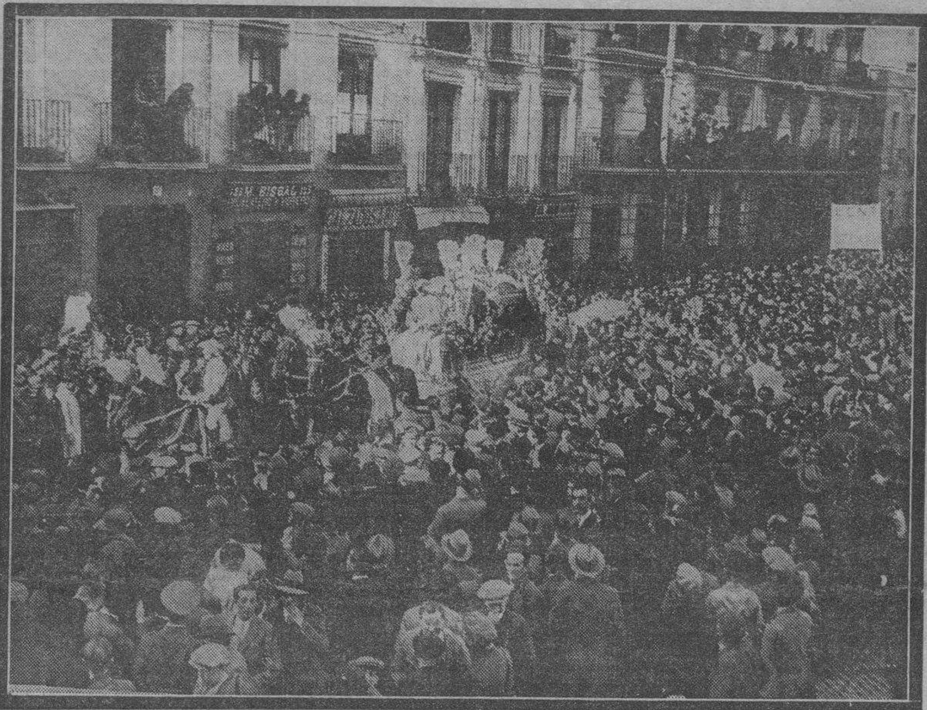
El coche mortuario se abría paso difícilmente entre la compacta muchedumbre que invadía el Coso. Detrás, la caja llevada a hombros por familiares y amigos de la finada.

Es imposible calcular el número de millares a que ascendían las personas que figuraron en el entierro, pero puede asegurarse que ha sido la manifestación más nutrida que en estos últimos años ha desfilado por Zaragoza