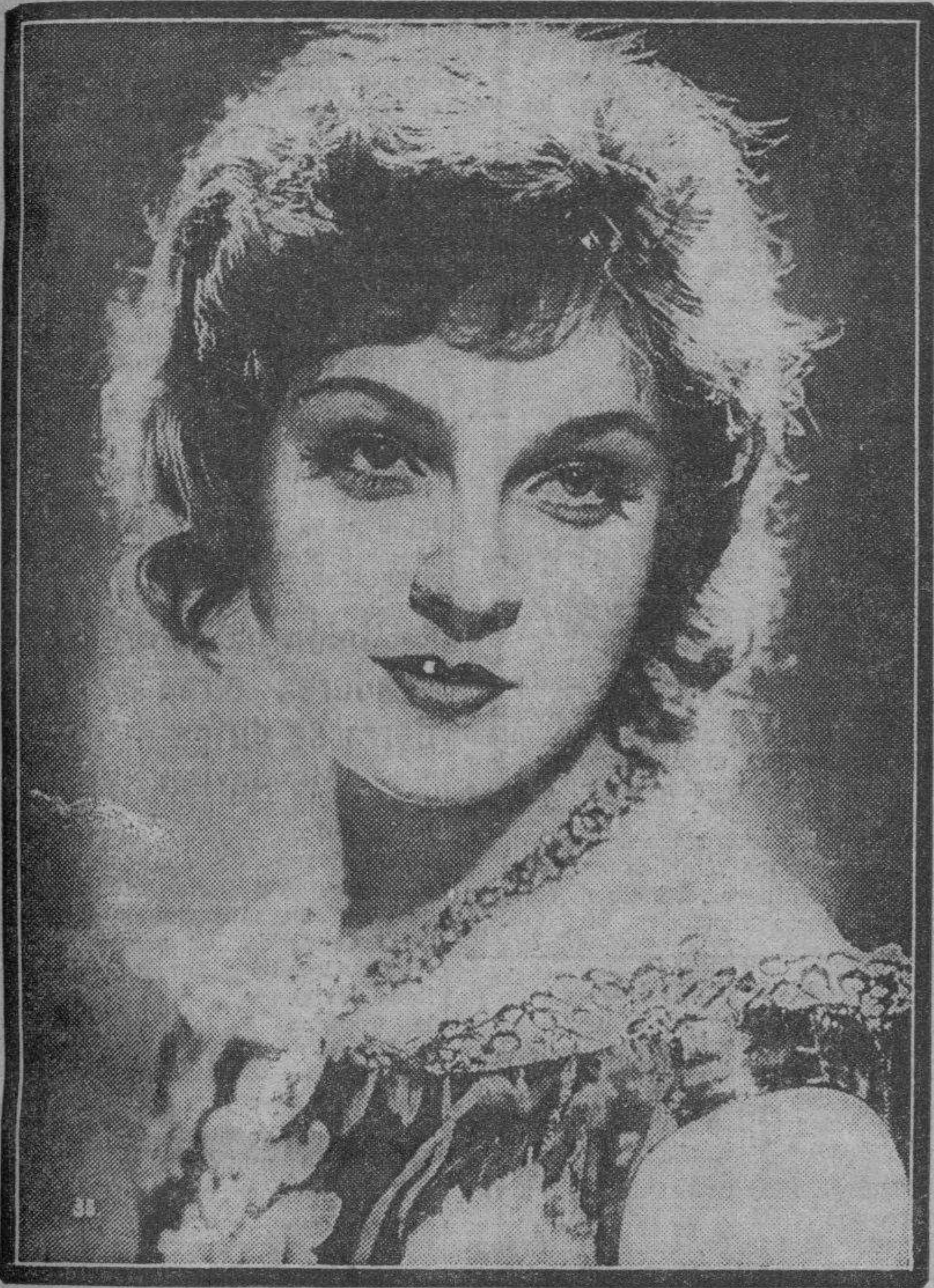
La bellísima actriz cinematográfica Anna Sten, feliz intérprete de la película "Karamasoff, el asesino", obra conceptuada como una joya cinematográfica.