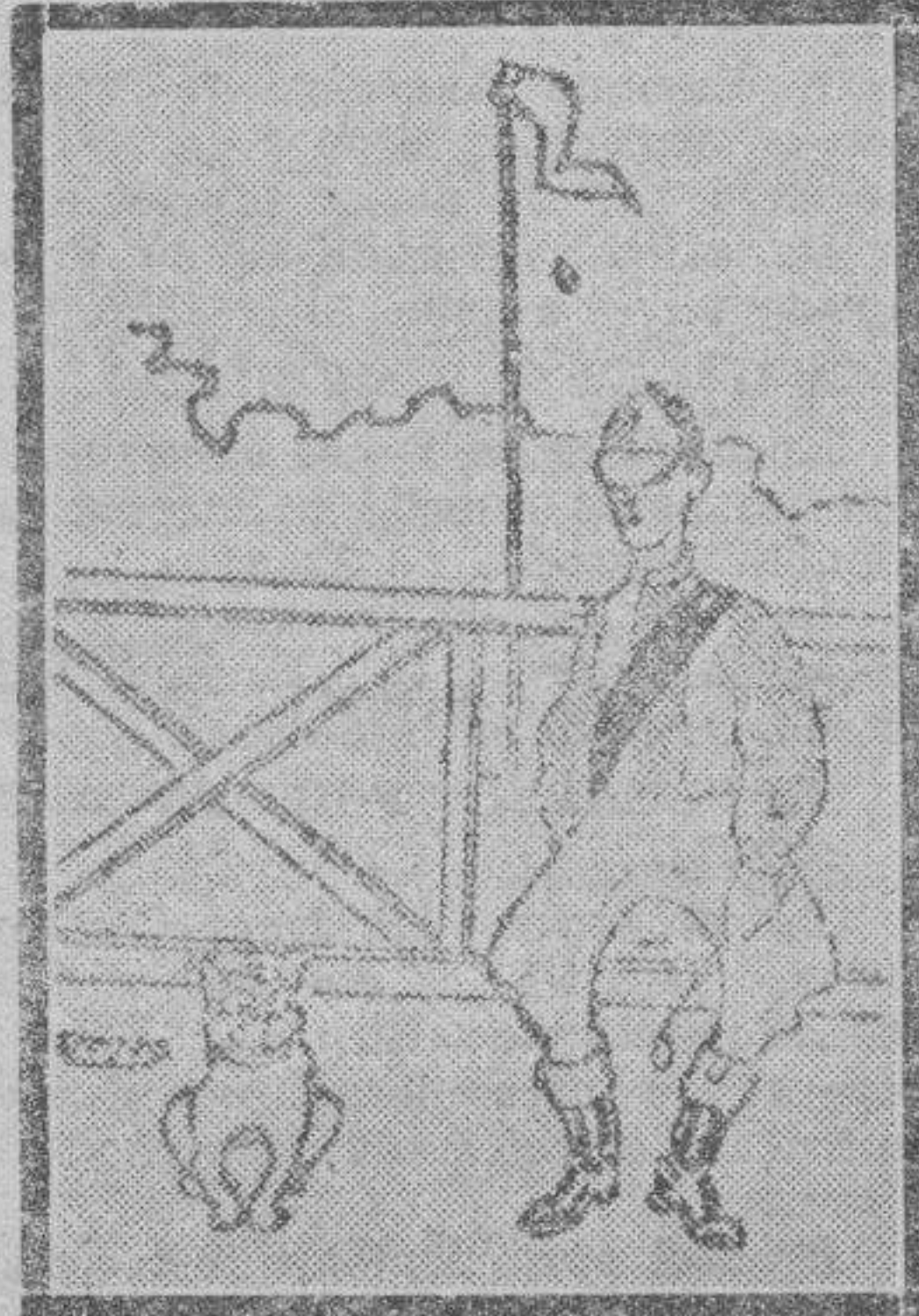
Un perro en el hipódromo. — ¡Gracias a Dios que veo un hombre con las piernas como es debido...!

una capacidad de 300 kilos y equipada con motor de dos tiempos, de unos 200 c. c.