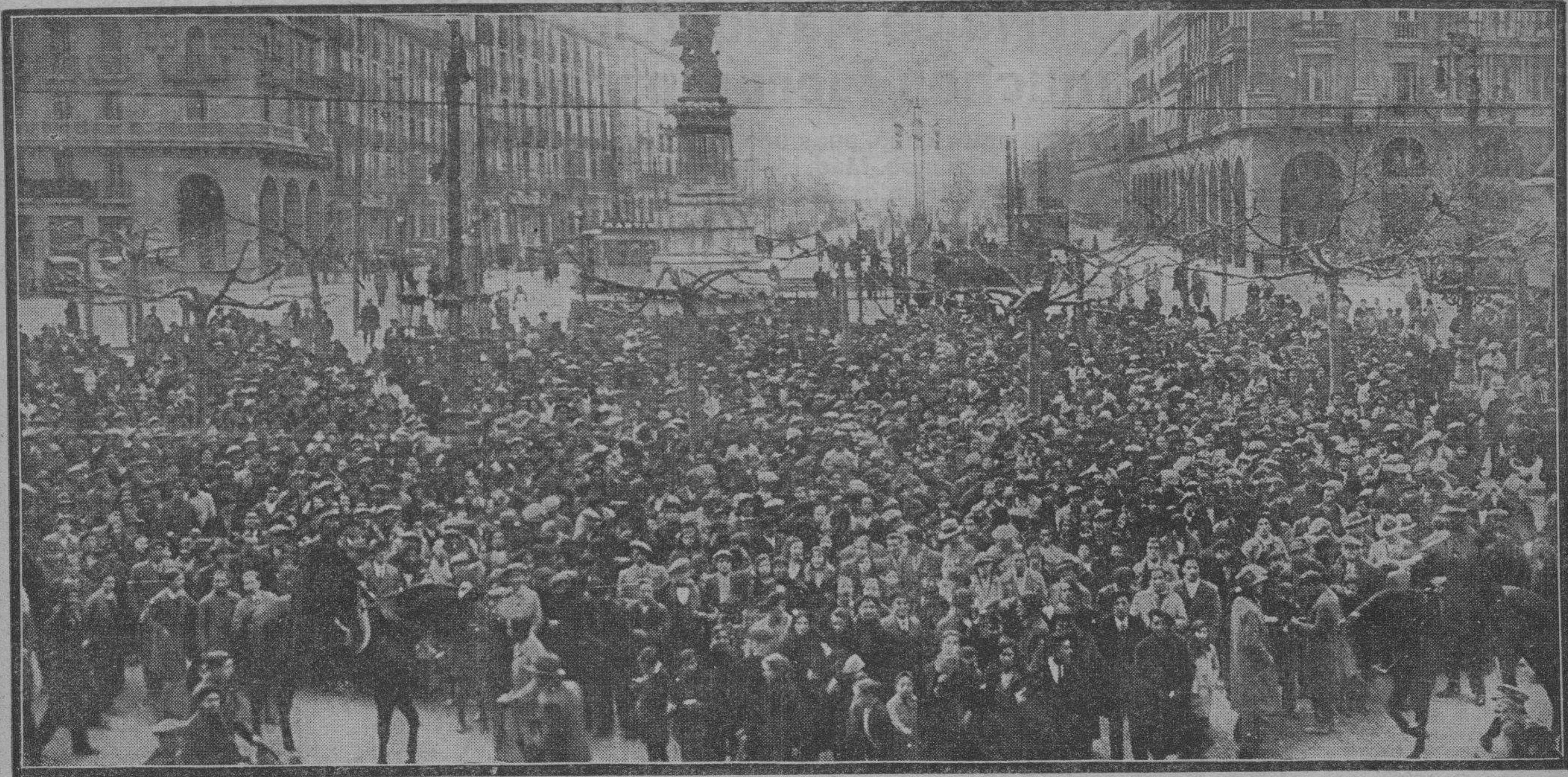
El público congregado frente a las pizarras de LA VOZ DE ARAGON, en la plaza de la Constitución, siguiendo anhelante el curso del sorteo de la lotería.