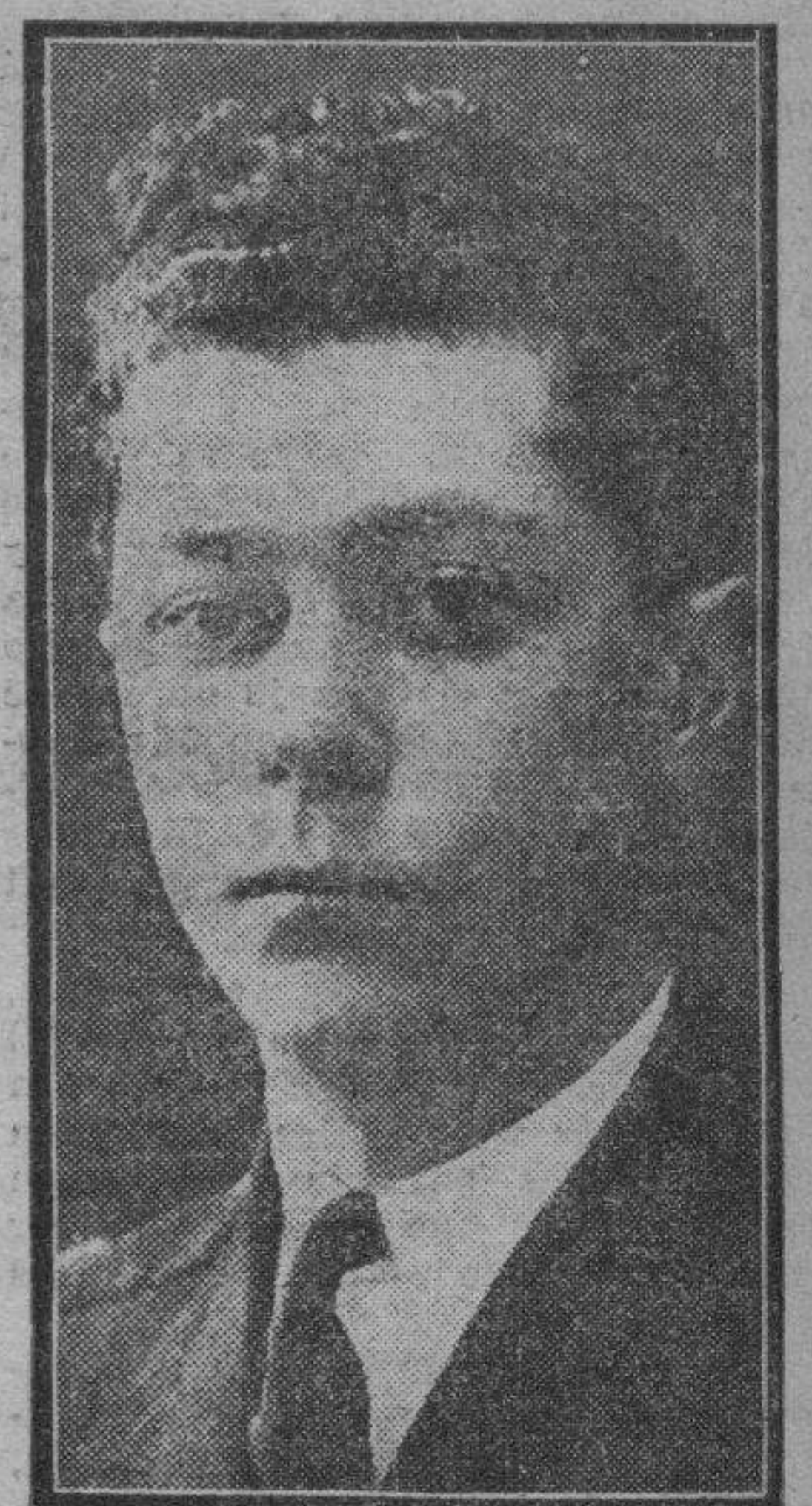
El famoso piloto español, capitán Rodríguez que, con Haya, va a llevar a cabo el "raid" España-Bata.

Añadió que no se habían ocupado de política y que los nombres de los altos cargos de su departamento los facilitaría después de la segunda parte.