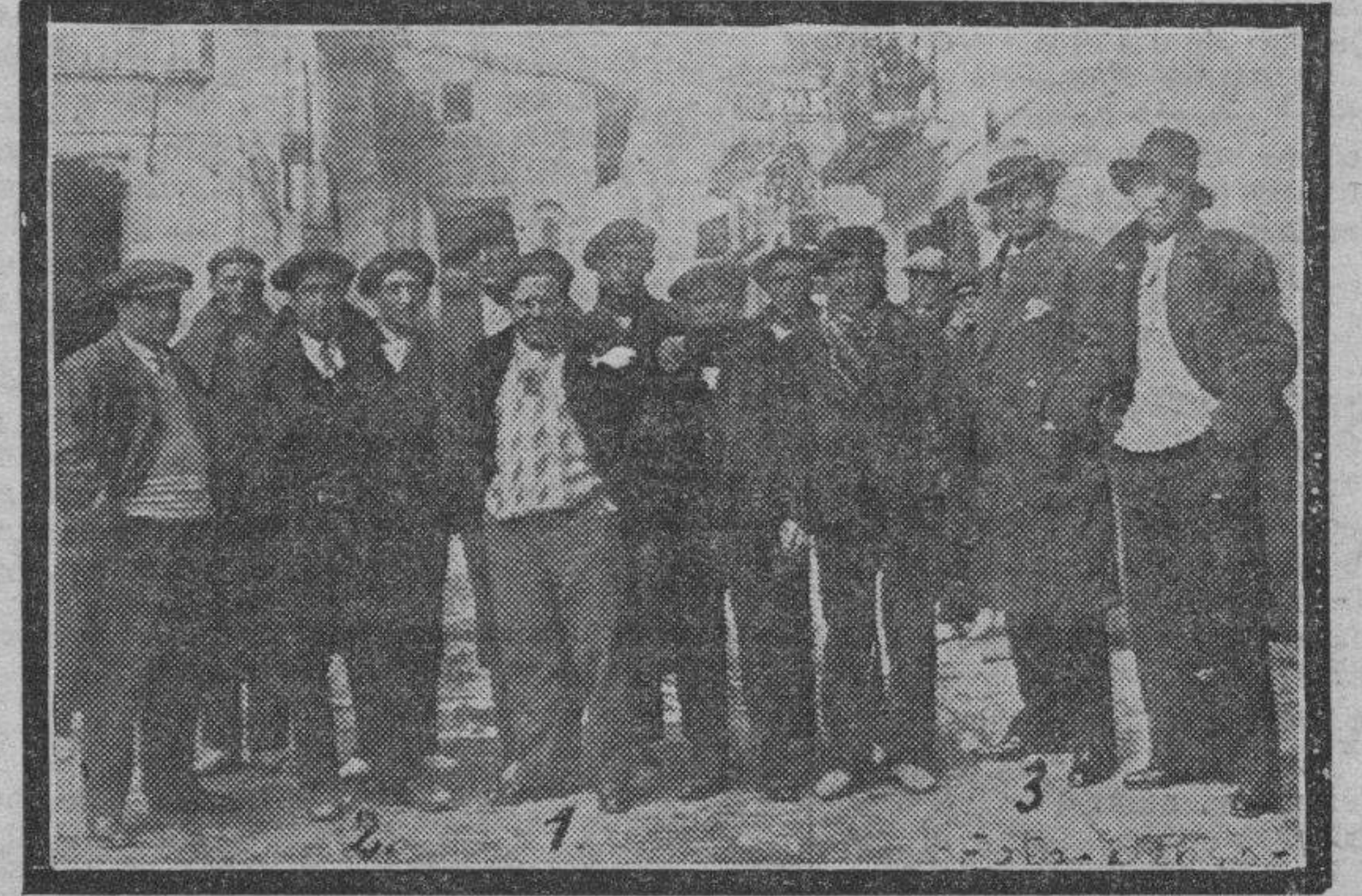
SARRION. — Juan García, el gran tenor aragonés, durante su estancia en Sarrión, su pueblo natal. El tenor (1) aparece rodeado de varios de sus amigos, entre ellos los señores Casinos López (2) y Benso García (3).