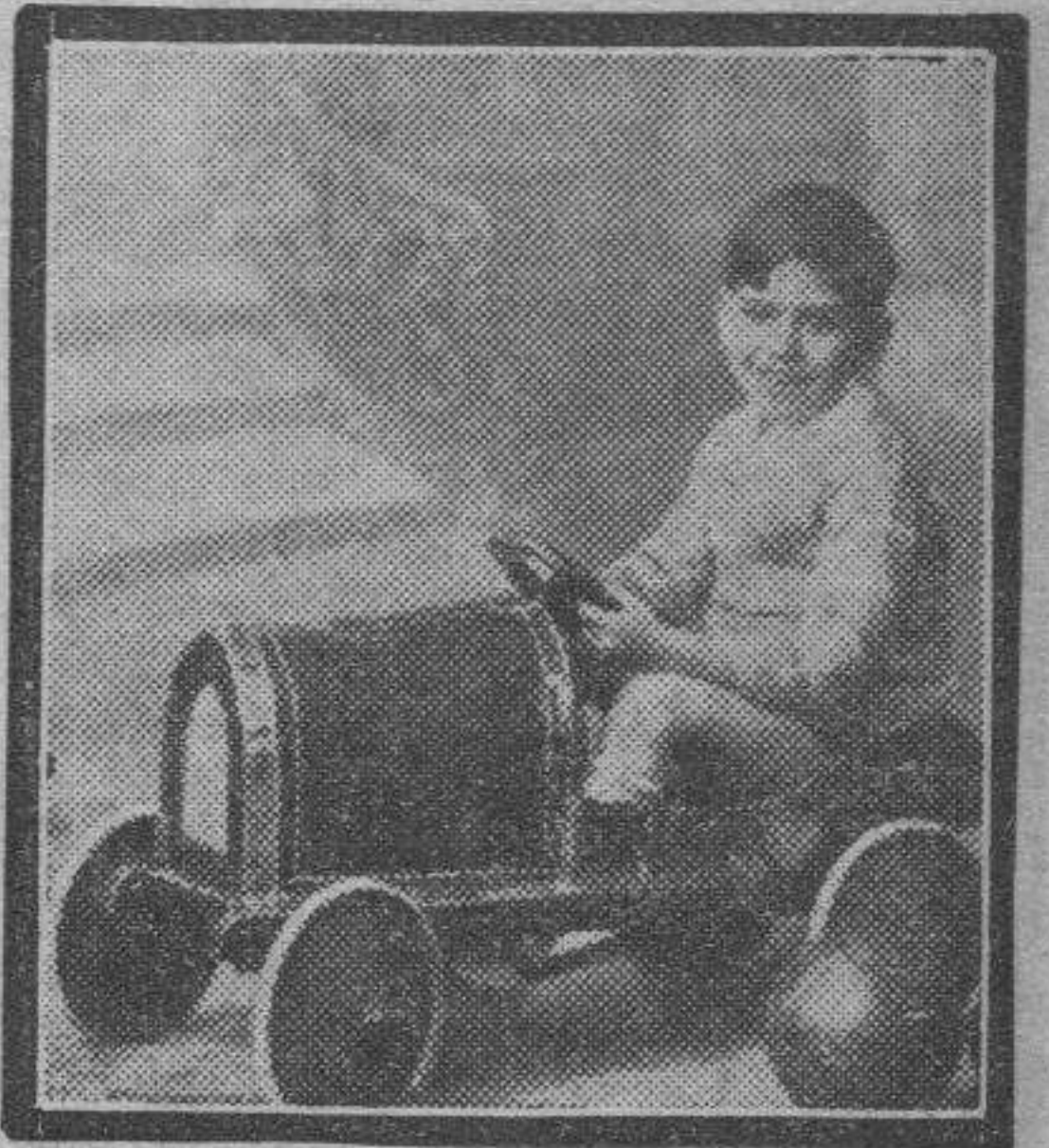
Otro niño, al volante, como el chófer más caracterizado. Es la influencia de la época.

Noche de Reyes zaragozana. Mientras los pequeñuelos duermen, soñando, tal vez, con el juguete preferido y tantas veces deseado en el transcurso del año, sus familiares recorren por triplicado los comercios, bazares y puestos ambulantes en alas del entusiasmo. Un entusiasmo verdaderamente infantil.