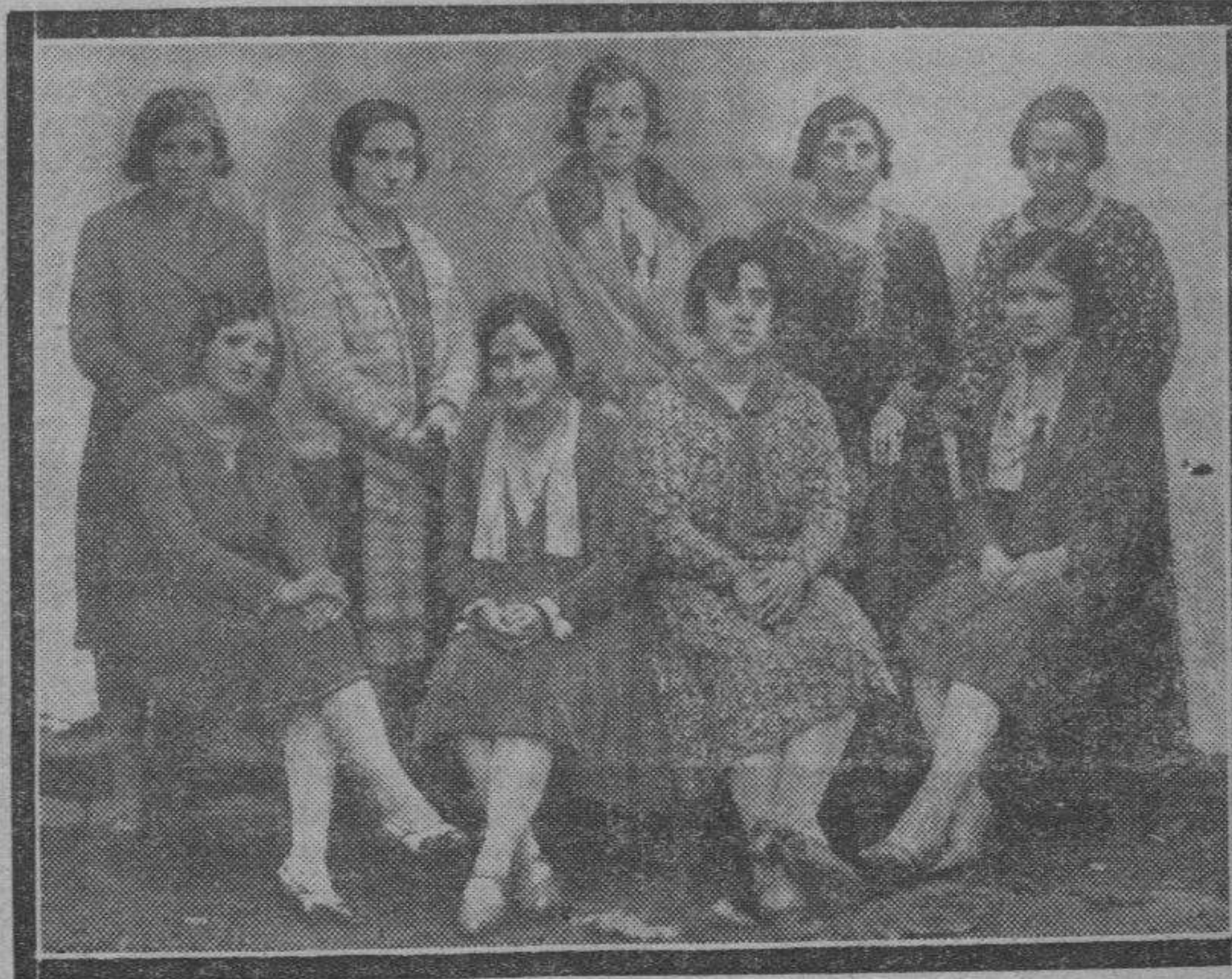
TOBED. — Un grupo de guapas muchachas de la localidad, que ponen en los paseos domingueros una nota de bello colorido.