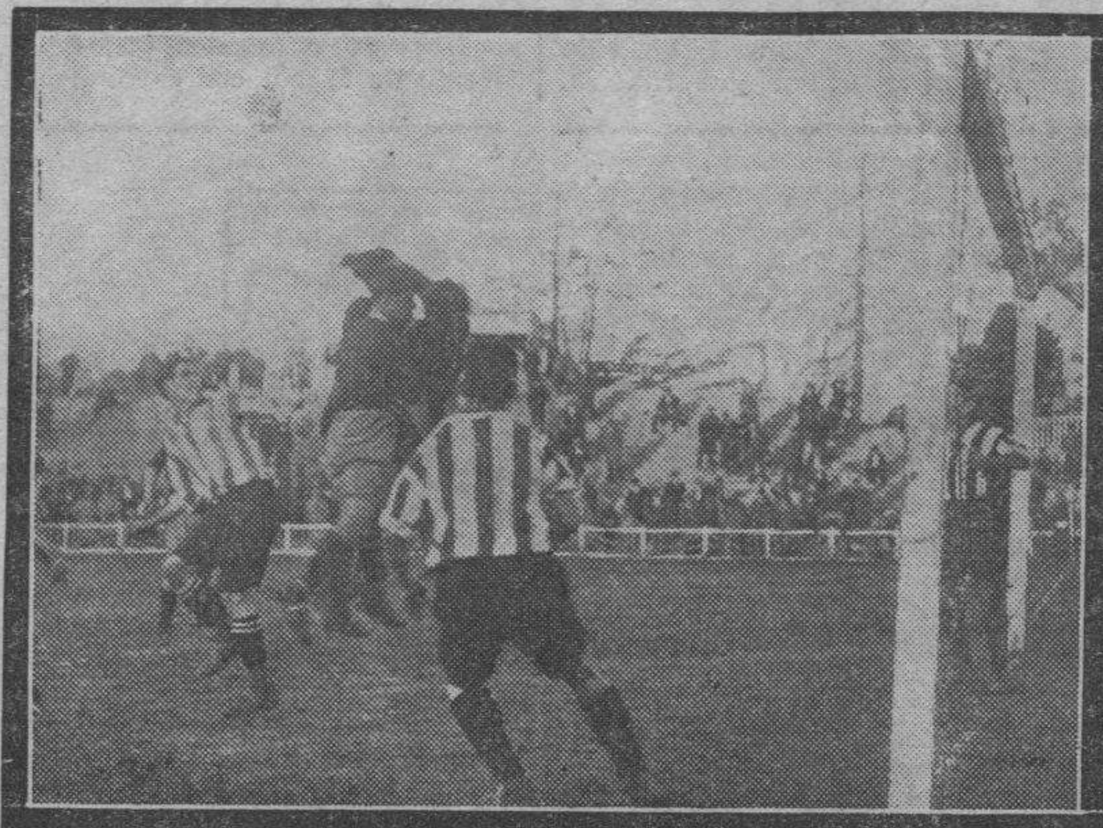
Omist, el guardameta riojano, despejando una apurada situación para su marco.