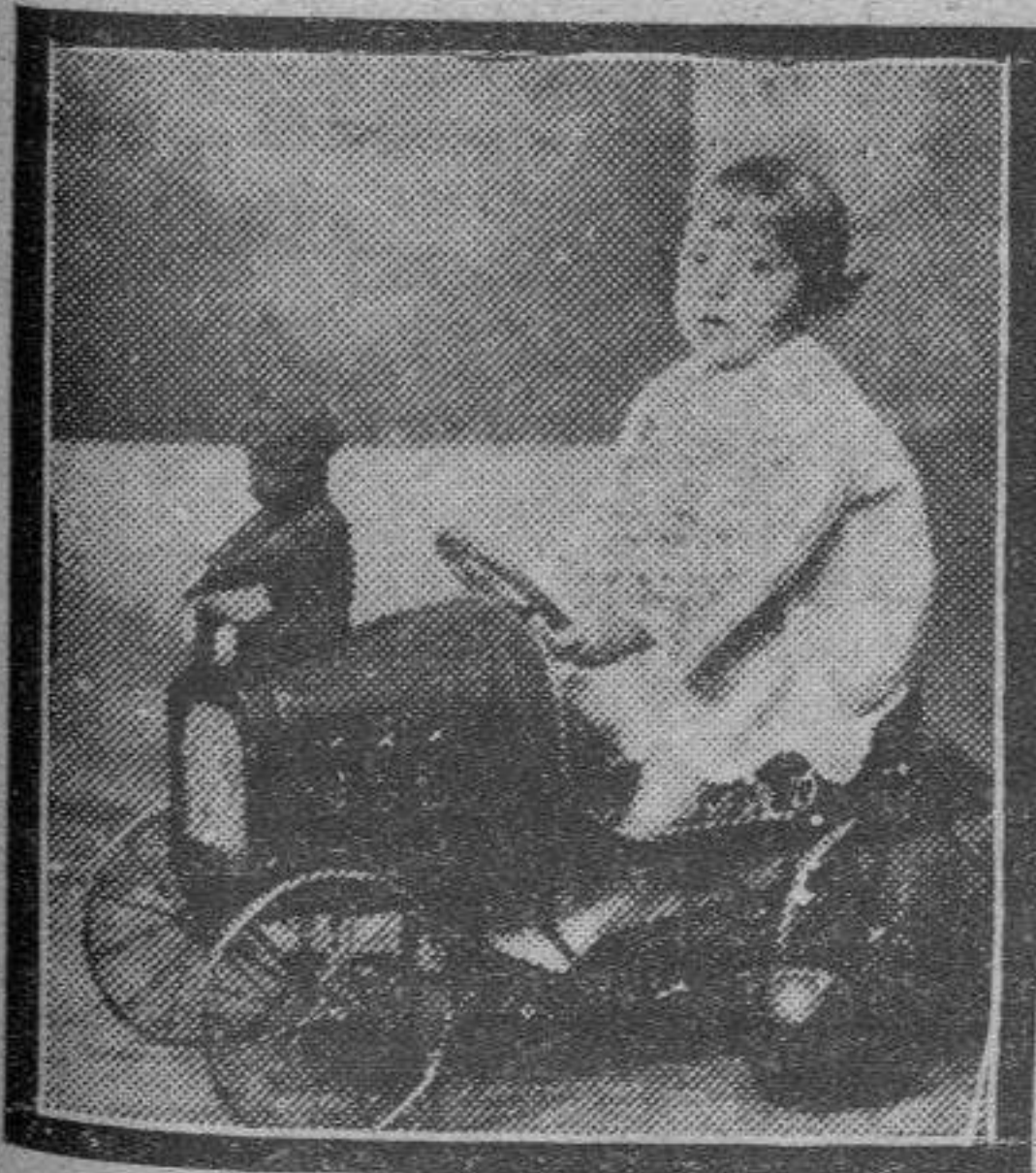
Los chicos de ahora ya no "piden" libros y cartapacios. El vértigo de la velocidad les incita a solicitar, como minimum, un automóvil.

so tiranuelo que reduce a la esclavitud todo cuanto le rodea: personas y objetos. El "Pifín", de Blasco Ibáñez, reduciendo a la categoría de fantoche al tremebundo fiscal en cuyos labios parece como si hubiera encontrado su mejor asiento "lavindicta pública", "la espada vengadora de la ley", es un ejemplo de los infinitos despotas en miniatura que en el mundo han sido, son y serán.