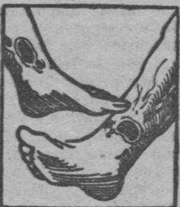
Males en las piernas

La sangre del artrítico esta entorpecida por venenos que provienen de una insuficiencia de vitalidad y por consiguiente, su circulación es del todo defectuosa. Las piernas del enfermo estan hinchadas y entorpecidas con varices dolorosas con peligro de ruptura o de ulceracion interminable. Con frecuencia el artrítico esta atormentado con dolores gotosos o reumaticos que le hacen achacoso y con el tiempo le agotan. Sus riñones estan generalmente obstruidos con nefritis, albuminuria; arena en la orina (mal de piedra) y a veces fuertes dolores en la espalda. Las arterias duras y quebradizas como tubos de pipa (arterioesclerosis) amenazan a cada instante, accidente generalmente pronosticado con insomnios y dolores de cabeza. La mujer artrítica tiene epocas irregulares o penosas y su edad critica es un largo suplicio, con bocanadas de calor, vertigos, jaquecas, postracion profunda, con frecuencia fibromas o tumores en el vientre. Los artríticos de ambos sexos tienen tambien enfermedades de la piel, acné, eczemas, herpes, sarpullidos, prurigo, sporiasis, forunculos, etc., con lesiones molestas y comezones intolerables. Todos esos enfermos de la sangre, todas esas victimas martires del artritis no tienen que desesperarse y creerse incurables pues el