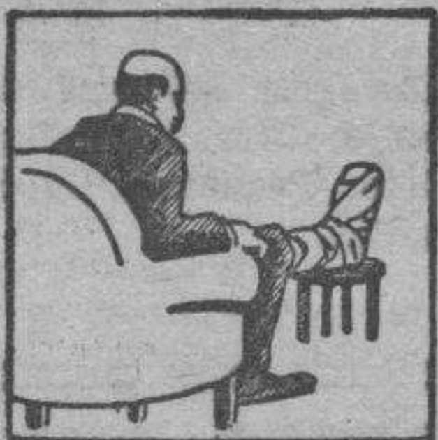
Gota - Dolores