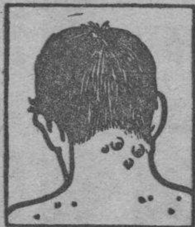
Granos - Forunculos