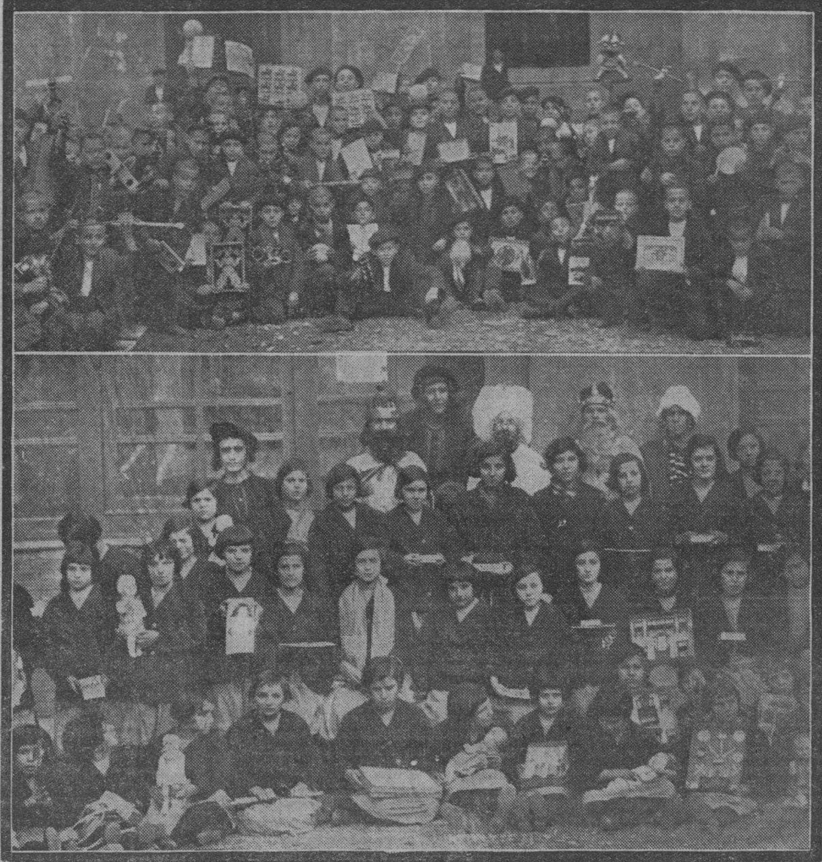
Niños y niñas del Hospicio provincial, después del reparto de juguetes celebrado en el benéfico establecimiento.

Las inscripciones de afiliados son ya numerosísimas, adquiriendo ya en sus comienzos la Unión Yugoslava un carácter verdaderamente nacional. S. S.