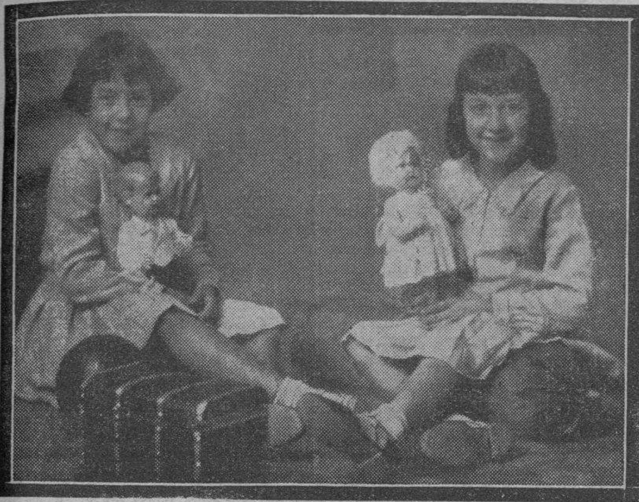
Dos niñas "armadas de todas las armas". Son dos criaturas que valen un mundo. Y no lo decimos por el baúl...

Niños de ayer y niños de hoy. ~La influencia de la época.~La baja de nuestra divisa y la industria nacional.~Negocio redondo.~Alegoría final