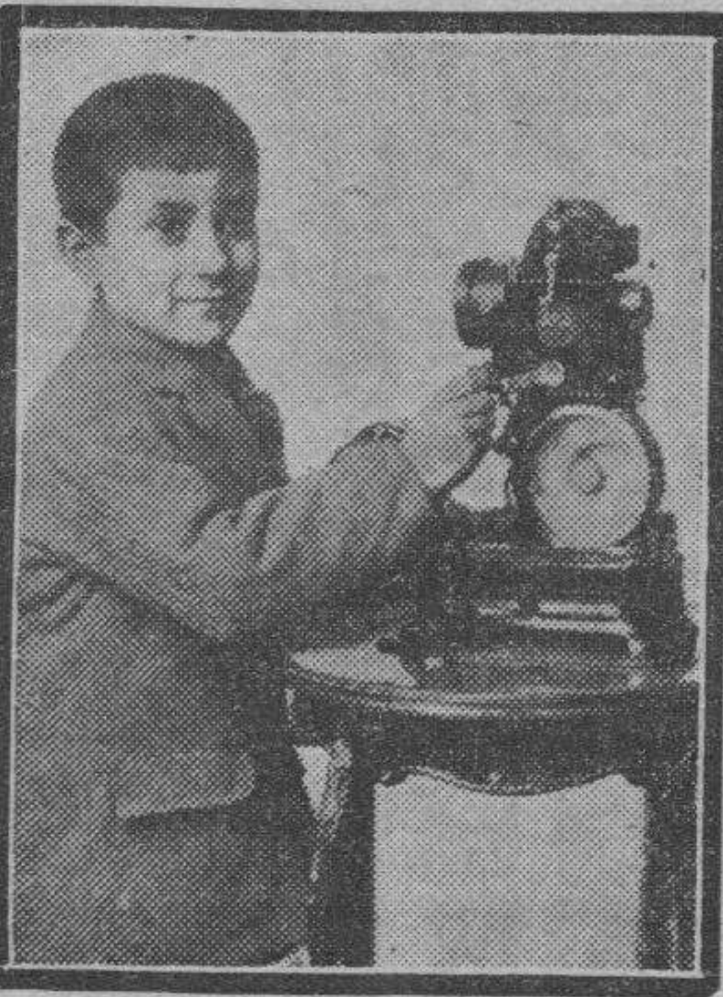
El chico de hoy maneja la máquina de "cine" con la misma facilidad con que antes leían el Catón.

cialidad exclusiva de la época que corremos.