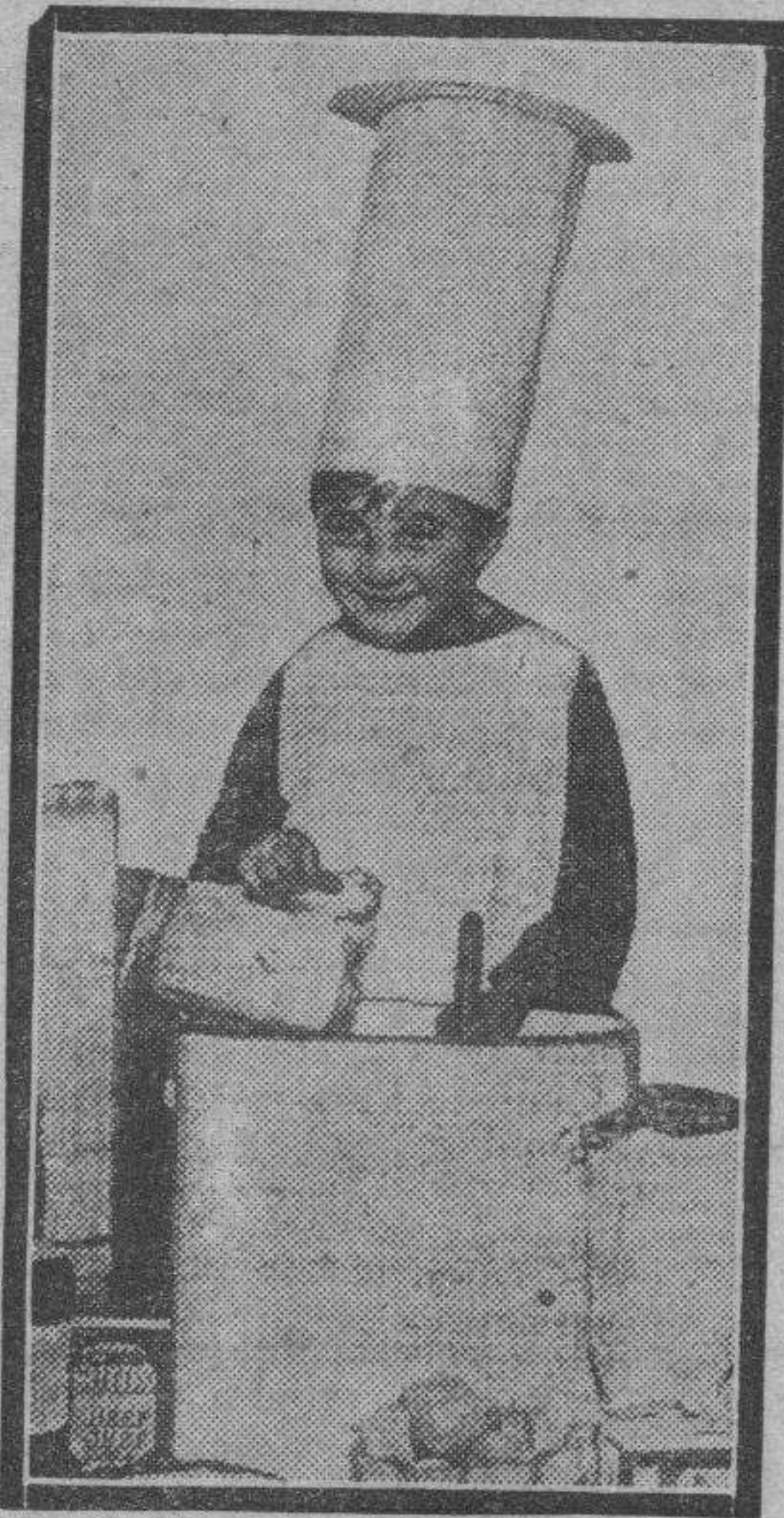
Los niños del siglo XX poseen el sentido de lo cómico. Y hacen uso de él para ridiculizar a los hombres que hacen de su oficio un sacerdocio inútil.

Ridículo sería sentar la afirmación de que los niños de ahora son diferentes en todo a los de hace treinta años. Tan ridículo como decir que un chico no es chico, a pesar de todo su "crecimiento" psicológico. Lo que pasa es que los chicos de esta "hornada" pertenecen a la clase de los "niños-hombres", espe-