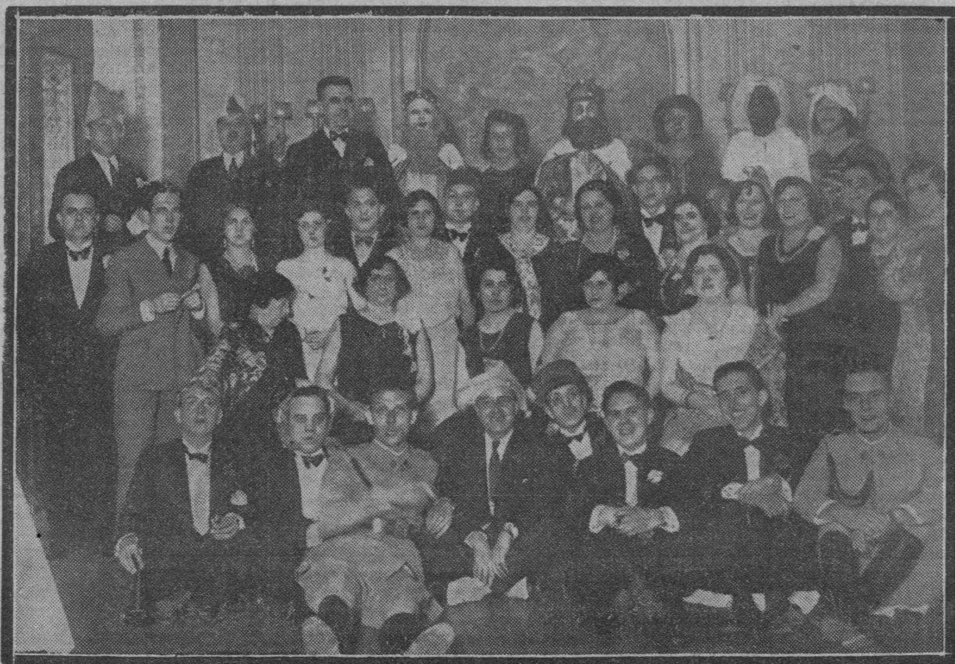
Asistentes a la fiesta celebrada en el Centro Mercantil para conmemorar la festividad de Reyes.

Este resumen ha sido repartido entre los afiliados a la Unión.