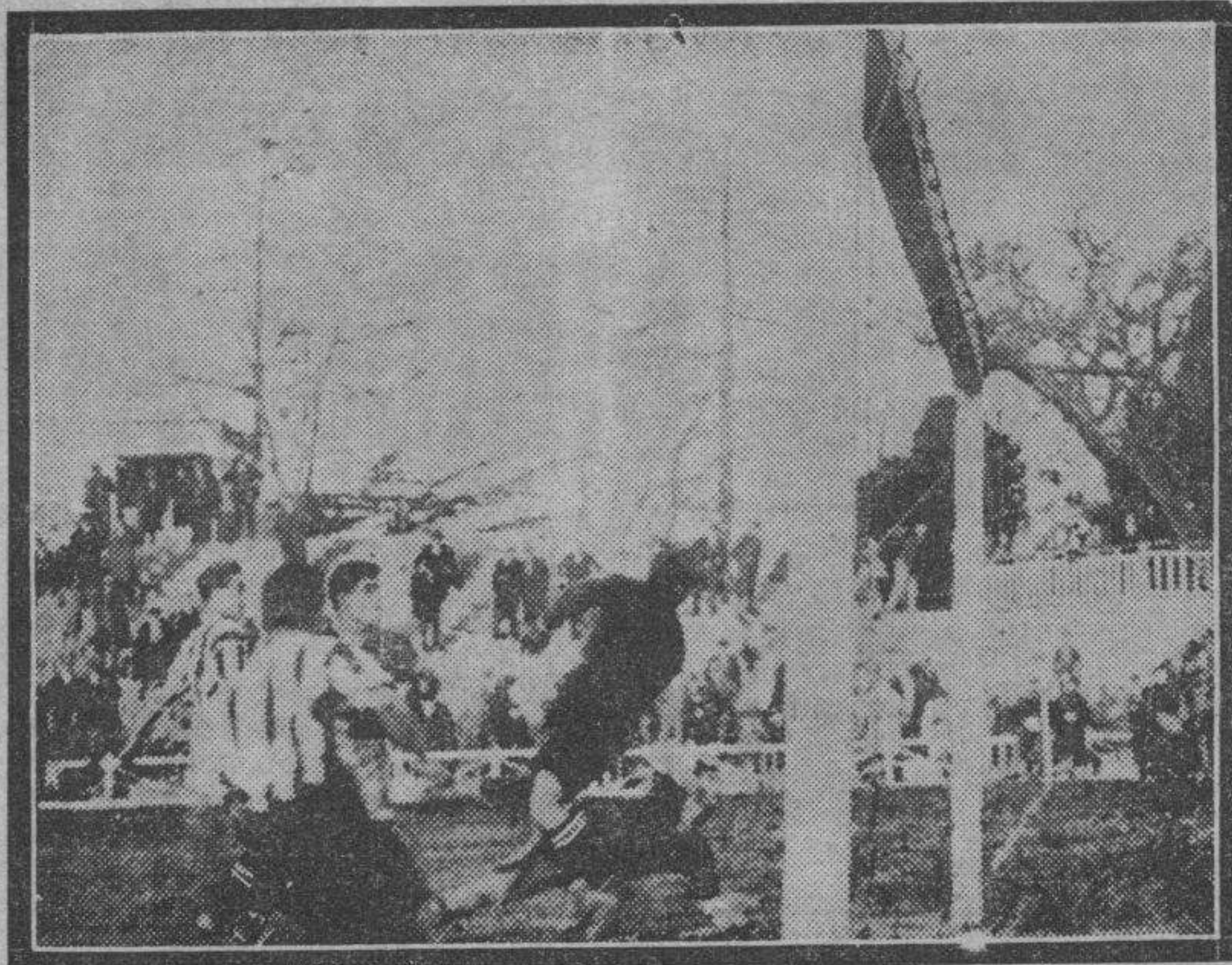
El primer goal marcado por los rojillos al Deportivo logroñés.