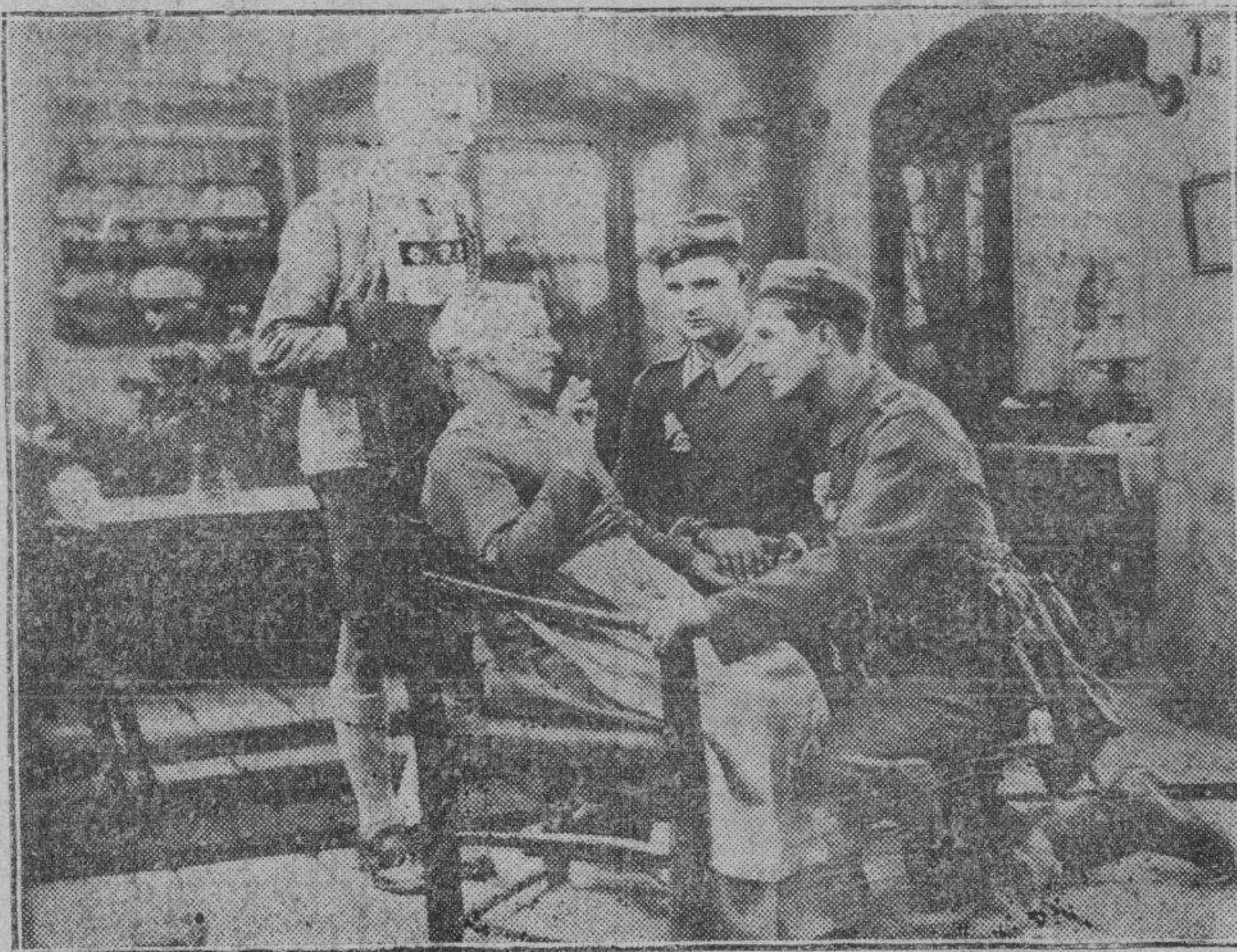
La emocionante escena del gran «film» Cuatro Hijos

LEA USTED NUESTRO CONCURSO CINEMATOGRAFICO