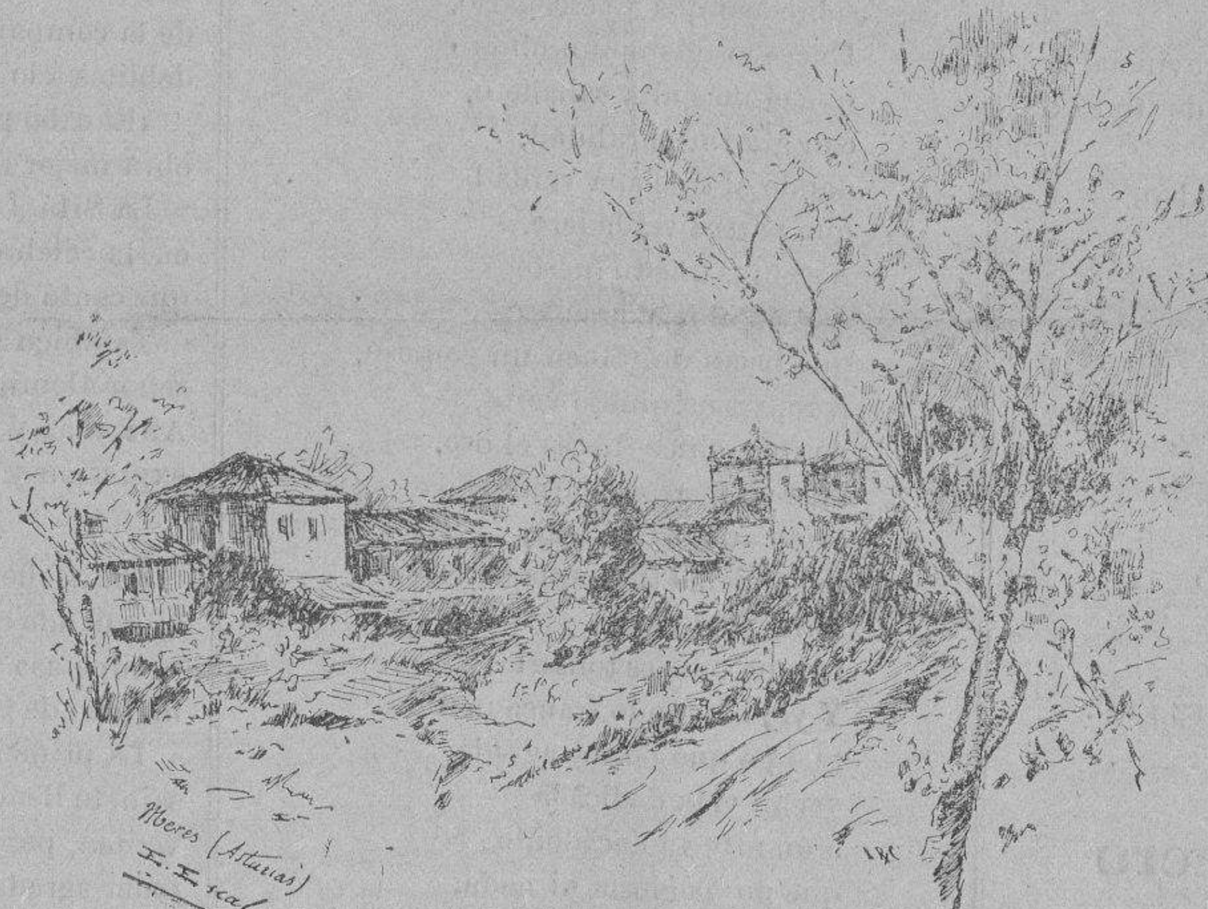
PAISAJE (Cuadro de E. Escalera)

Que si antes no he creído conveniente decir nada,